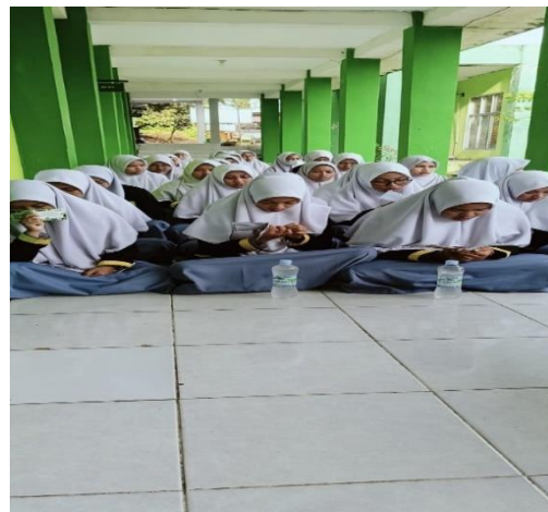
Gambar 2.3 dan 2.4. Pengamalan Zikir Al-Ma'tsurāt di Lorong Kelas