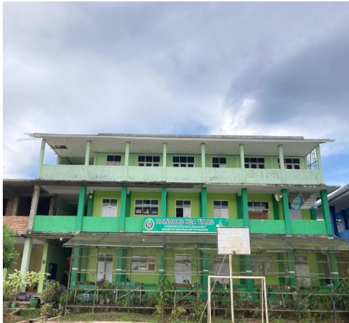
Gambar 1.1. Gedung SMA IT Ash-Shohwah