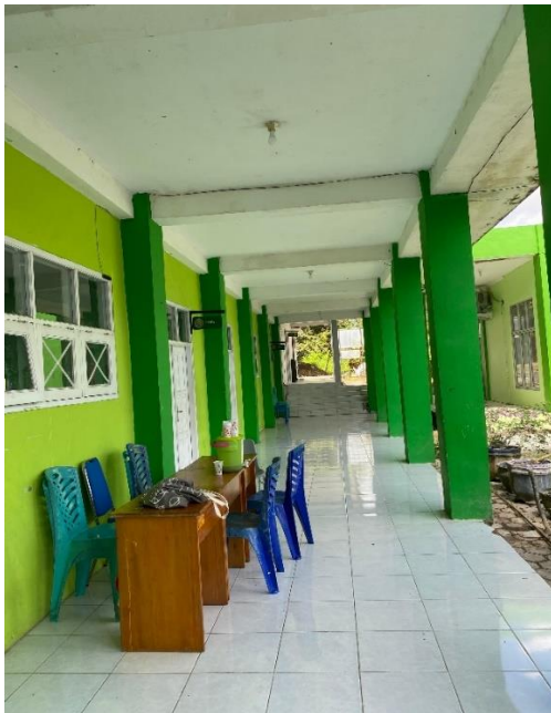
Gambar 1.3. Lorong Kelas