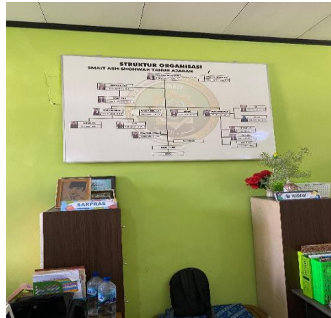
Gambar 1.2. Struktur Organisasi