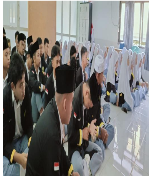
Gambar 2.1 dan 2.2: Pengamalan Zikir Al-Ma'tsurāt di dalam Kelas