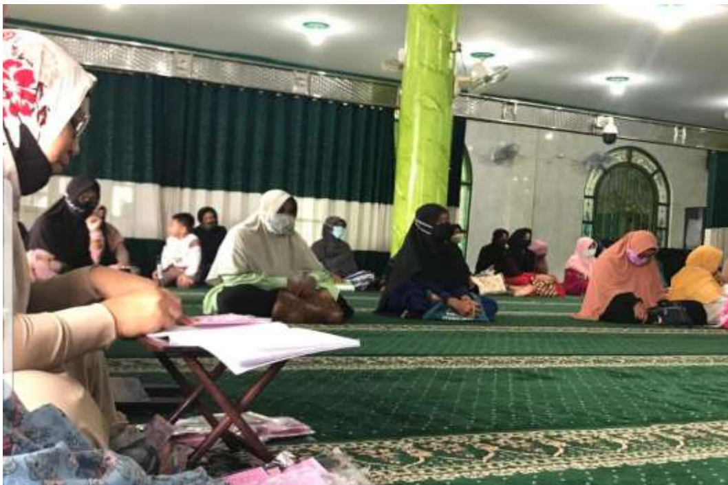
Gambar para jamaah mengikuti pembelajaran agama di majelis taklim