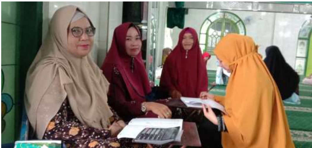
Gambar peneliti melakukan wawancara kepada para jamaah majelis taklim