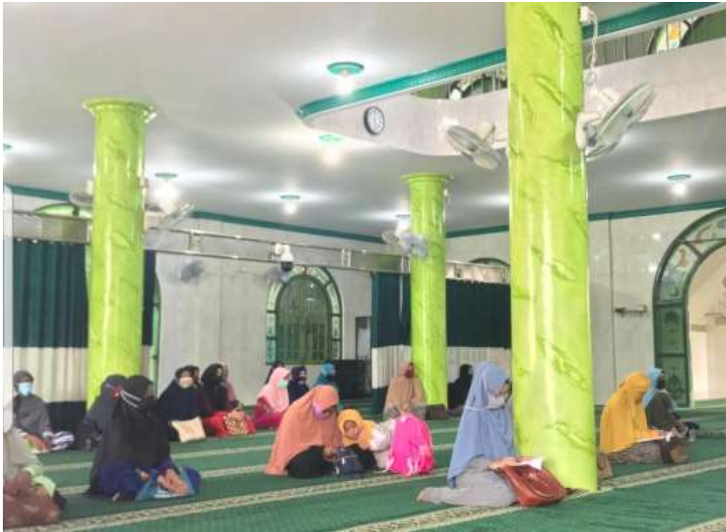
Gambar para jamaah mengikuti pembelajaran agama di majelis taklim