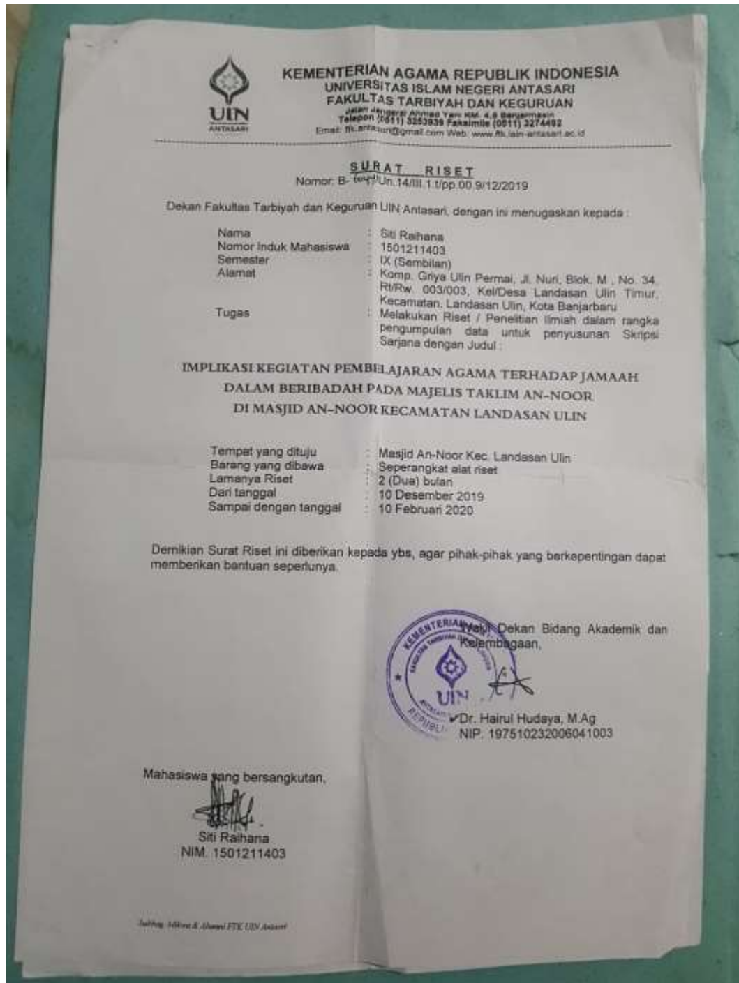
Gambar surat riset penelitian skripsi