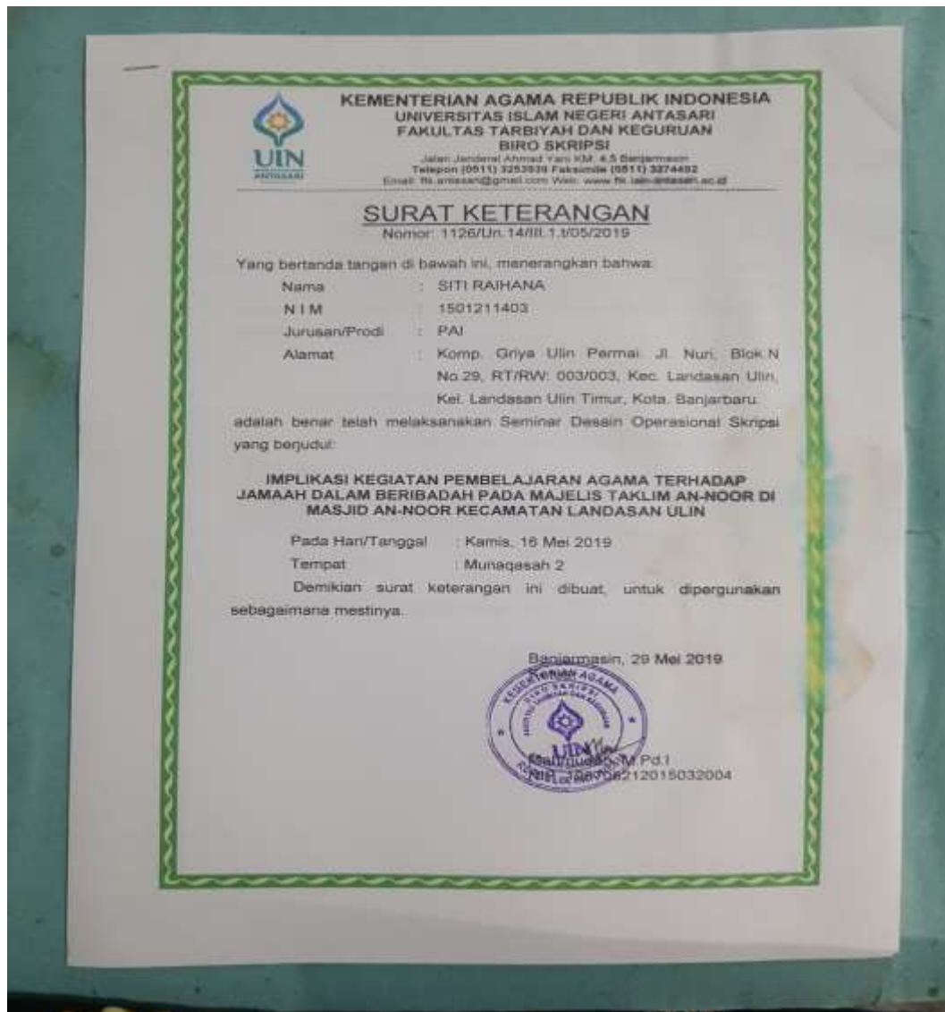
Gambar surat keterangan telah melakukan seminar desain proposal skripsi