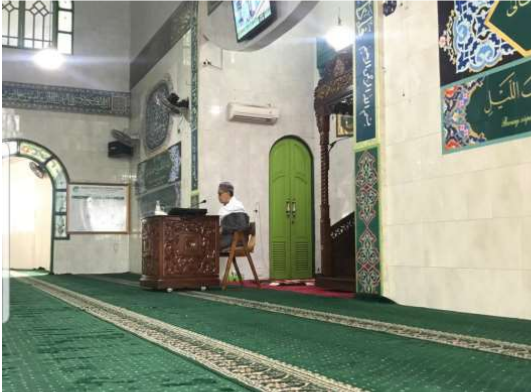
Gambar Ustadz sedang menyampaikan ceramah agama di Majelis Taklim An-Noor