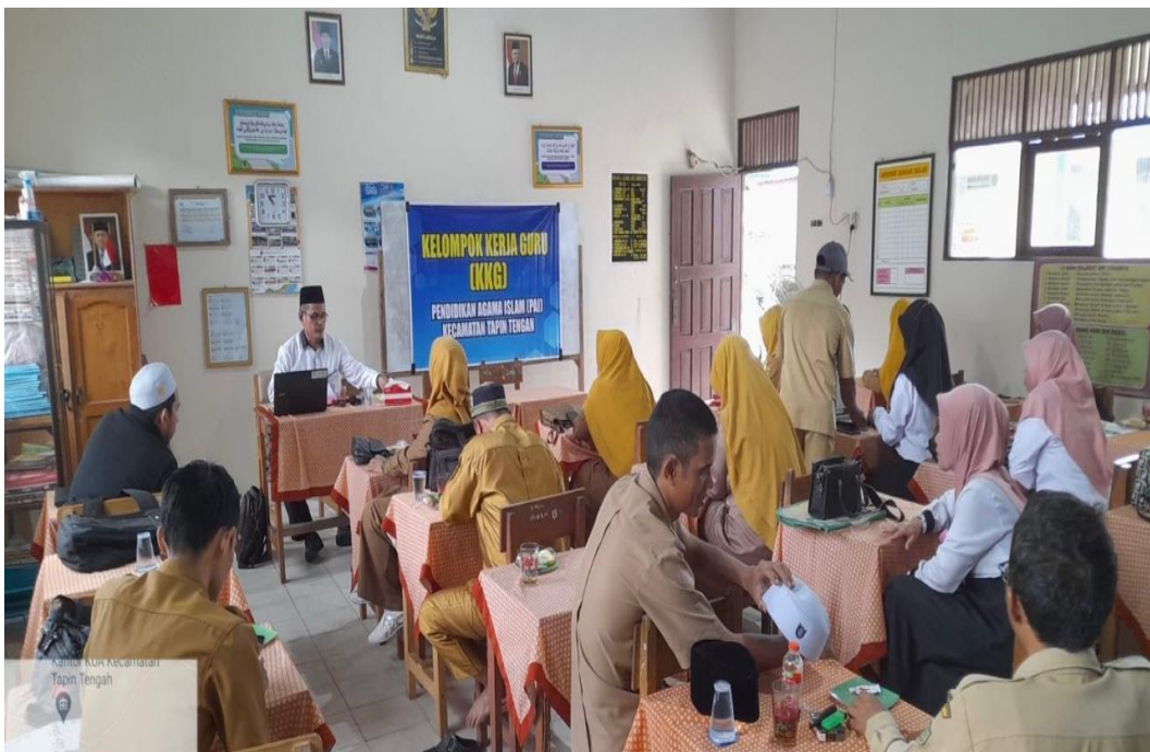
Foto kegiatan pembinaan melalui KKG PAI Kec. Tapin Tengah