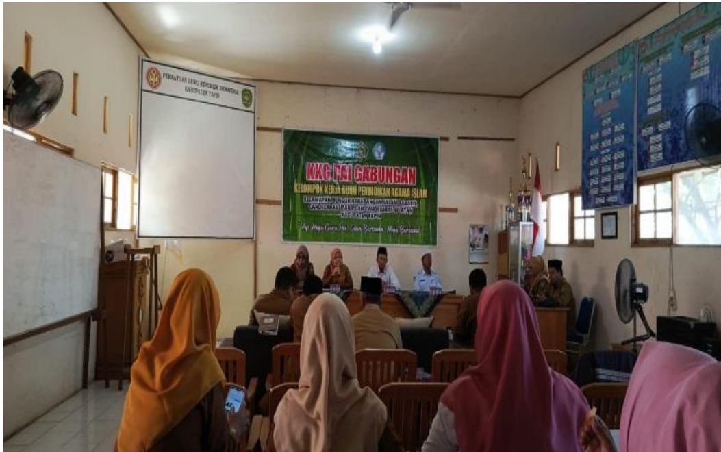
Foto kegiatan pembinaan melalui KKG PAI Gabungan Kec. Salam Babaris, Bakarangan, Bungur, Candi Laras Selatan dan Candi Laras Utara