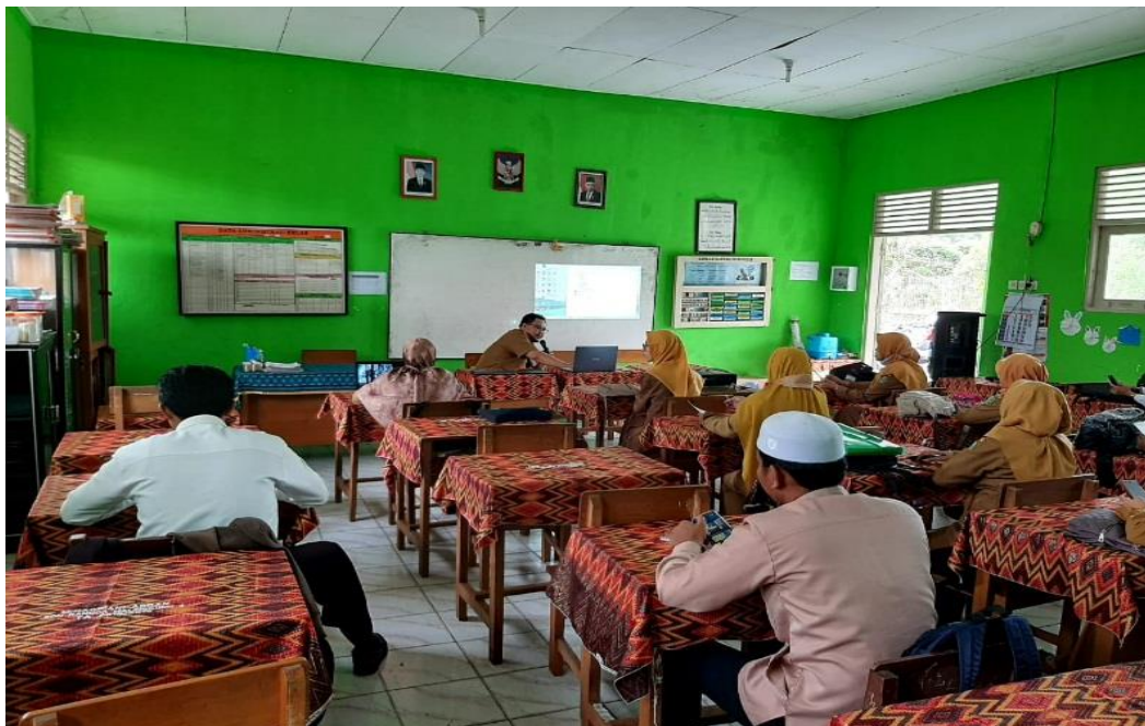
Foto kegiatan pembinaan melalui KKG PAI Kec. Tapin Utara