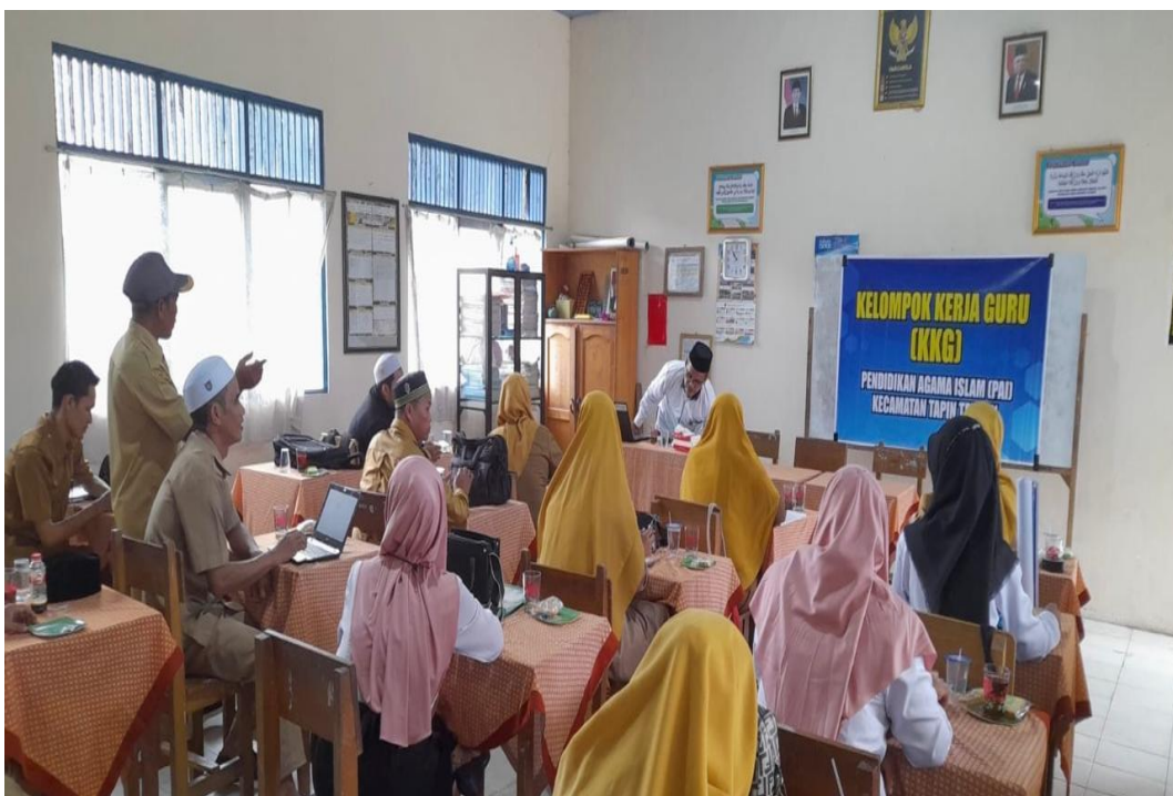
Foto kegiatan pembinaan melalui KKG PAI Kec. Tapin Tengah