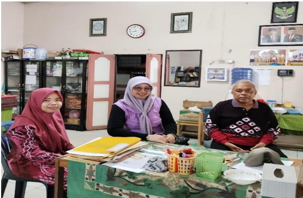
Foto wawancara dengan guru PAI SDN Pematang Karang Hulu