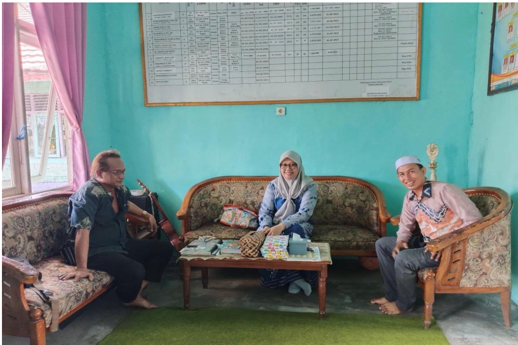
Foto wawancara dengan guru PAI SDN Pebaungan Hulu