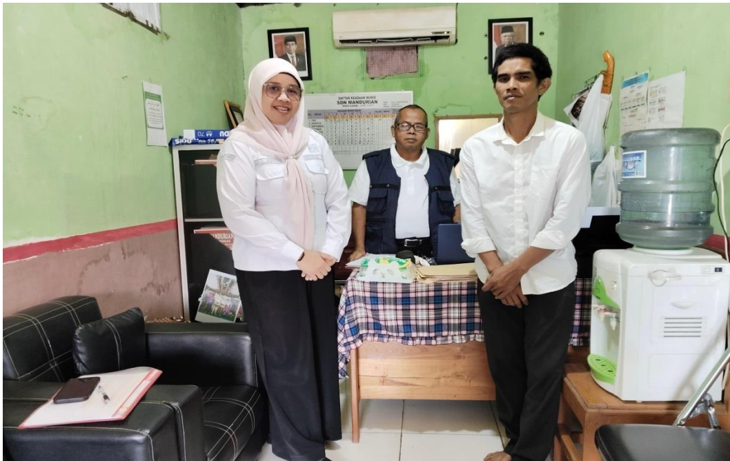
Foto wawancara dengan guru PAI SDN Mandurian