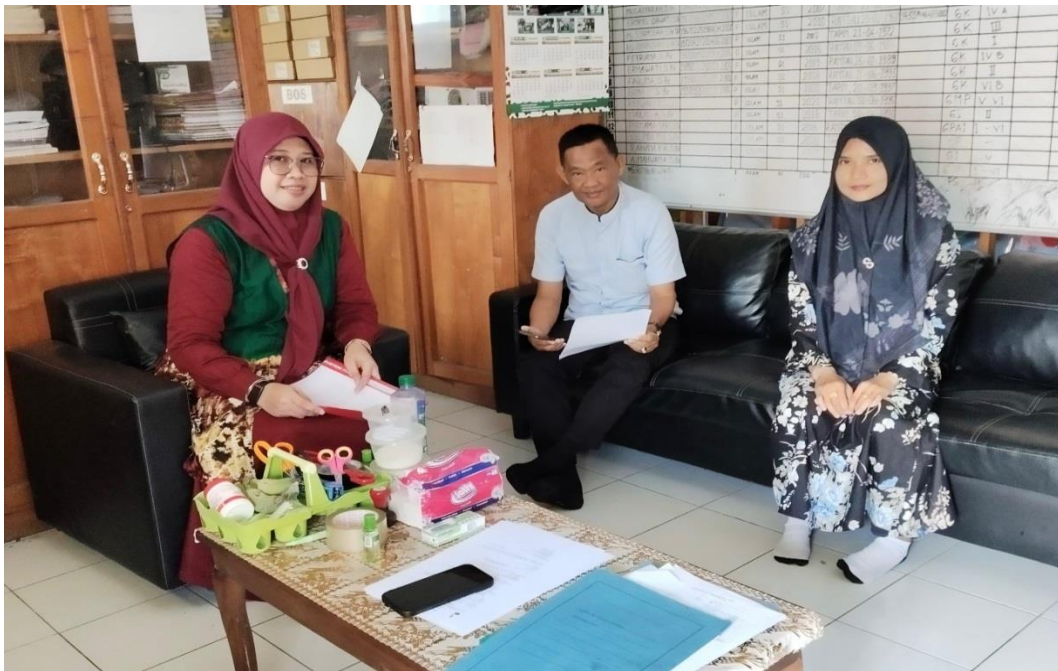
Foto wawancara dengan guru PAI SDN Rantau Kanan 2