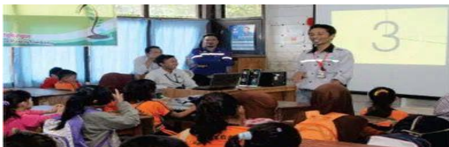
Gambar 4.6 Kampanye Lingkungan di SDN 1 Sungai Dua oleh SHE Jhonlin Group

PT Jhonlin Group yang merupakan perusahaan tambang yang juga ada di sekitar Desa Sungai Dua melakukan kegiatan seperti edukasi terhadap masyarakat, khususnya terhadap pelajar dengan memberikan pengertian tentang kesadaran akan pentingnya perawatan terhadap lingkungan tempat kita berpijak. Kegiatan ini dilakukan dalam rangka memperingati hari lingkungan hidup sedunia tanggal 5 Juni 2014.