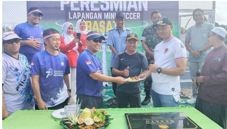
Gambar 4.5 Peresmian Lapangan Minni Soccer bersama PT Arutmin Indonesia

juga, bahwa dengan adanya lapangan Mini Soccer tersebut berharap akan membentuk pelajar yang berprestasi dalam kegiatan olahraga.