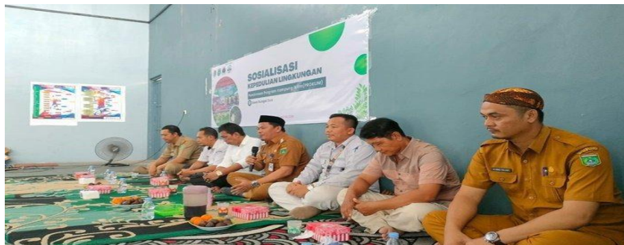
Gambar 4.3 Pelatihan Proklamasi PT Arutmin Indonesia Site Batulicin ajak warga Lestarkan Lingkungan

Program CSR lain yang penulis dapati adalah adanya kegiatan pelatihan Desa yang diperuntukkan untuk mengatasi Bencana di Desa Sungai Dua pada tahun 2024. Pelatihan tersebut diikuti oleh 50 peserta yang terdiri dari anggota Karang Taruna, Badan Usaha Milik Desa (Bumdes), Aparat Desa, Masyarakat, dan perwakilan Tim Penganggulangan Bencana Desa Mantewe.