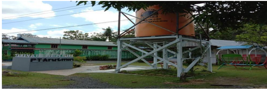
Gambar 4.2 PT Arutmin Indonesia Bangun Taman Air Bersih di Desa Sungai Dua

program tersebut. Dengan tempat yang strategis maka menurut Sekretaris Desa Sungai Dua saat diwawancarai oleh aktualkalsel.com sangat berdampak bagi masyarakat, khususnya bagi anak-anak yang bermain di taman tersebut.