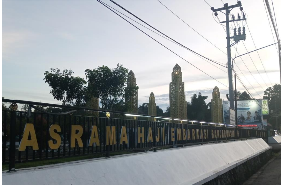
Sambutan Selamat Datang Asrama Haji Embarkasi Banjarmasin kepada Jemaah Haji