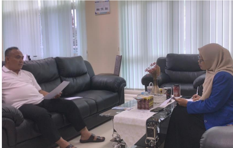
Foto Bersama dengan Kepala Asrama Haji Embarkasi Banjarmasin