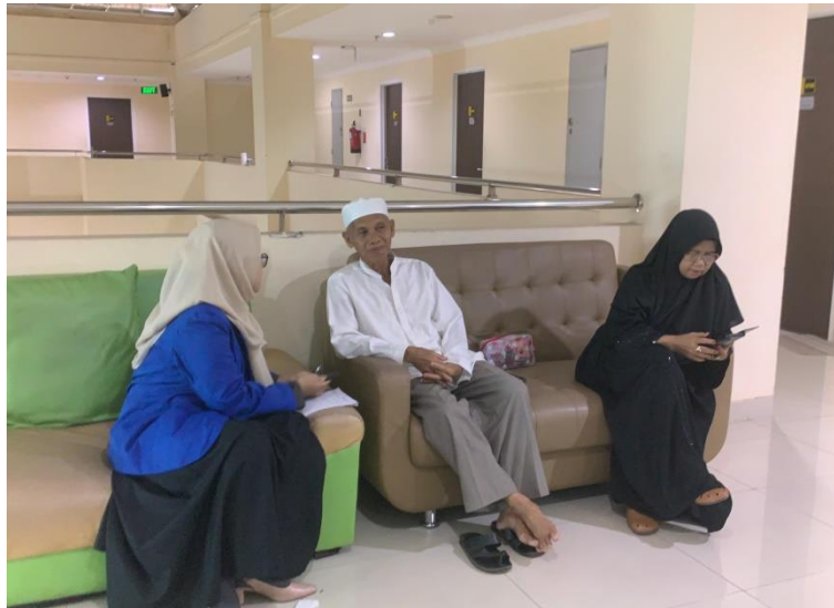
Foto Bersama dengan Jemaah Haji Lanjut Usia