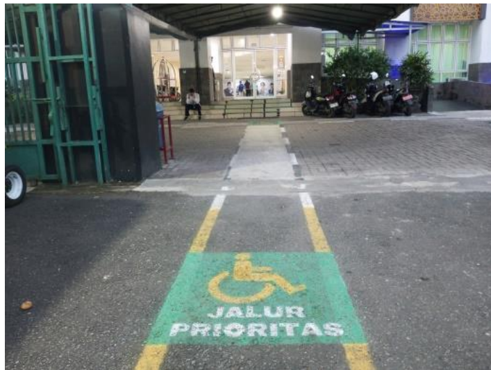
Gambar 4.19 Jalur Prioritas untuk Kursi Roda

lansia dalam bergerak di area asrama haji. Jalur prioritas tidak hanya menyediakan akses yang lebih mudah bagi jemaah haji lansia, tetapi juga memastikan bahwa jemaah haji lansia dapat bergerak dengan nyaman dan aman tanpa terhalang oleh kendala fisik atau lingkungan sekitar. Pengaturan jalur kursi roda memperhatikan kebutuhan spesifik jemaah haji lansia, yang memerlukan bantuan tambahan untuk mobilitas di sekitar asrama haji.