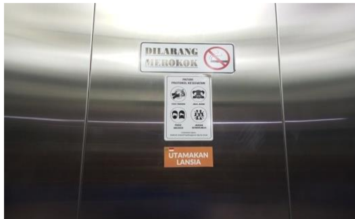
Gambar 4.4 Stiker “Utamakan Lansia” didalam ruang lift