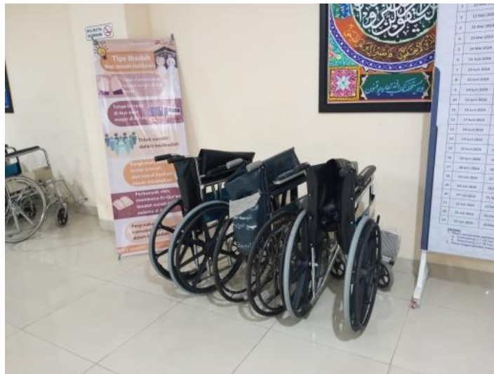
Gambar 4.23 Beberapa Kursi Roda pada salah satu gedung di Asrama Haji Embarkasi Banjarmasin