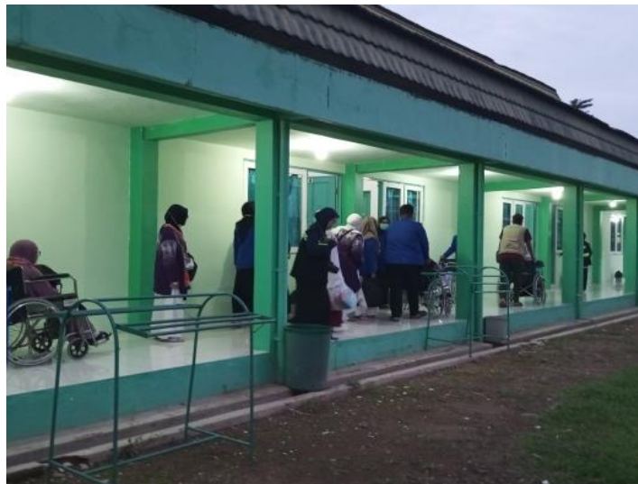
Gambar 4.12 Penyediaan Kamar Khusus untuk Lansia

Fasilitas kamar dinilai cukup untuk memenuhi kebutuhan lansia, sehingga mereka merasa puas dengan layanan yang diterima. Akses mudah ke fasilitas kesehatan dan bantuan dari petugas, memastikan bahwa kebutuhan jemaah haji lansia terpenuhi selama berada di embarkasi.