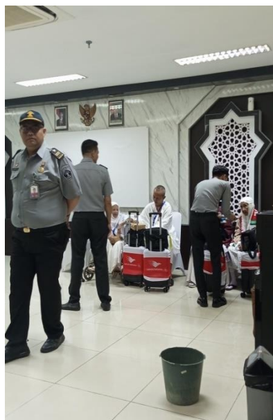
Gambar 4.15 Pemeriksaan oleh Pihak Imigrasi