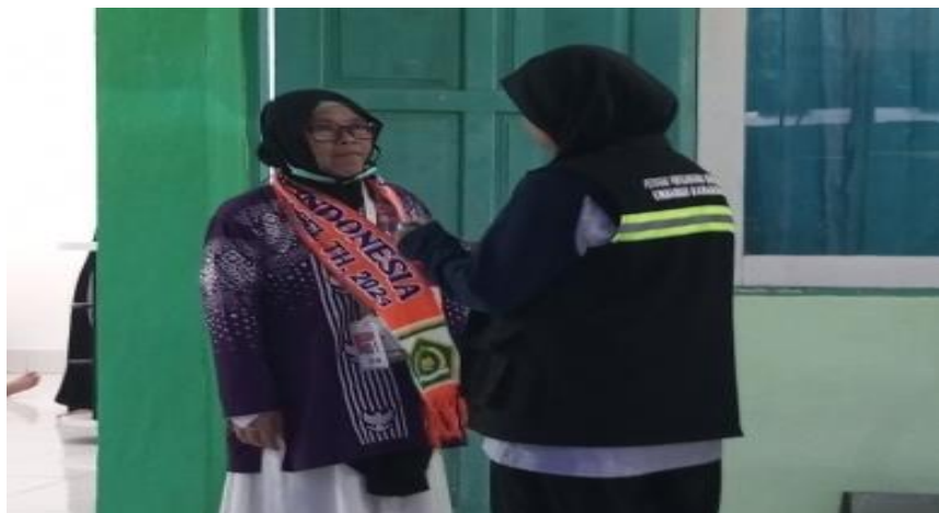
Gambar 4.2 Petugas yang Memberikan Informasi kepada Jemaah Haji Lanjut Usia