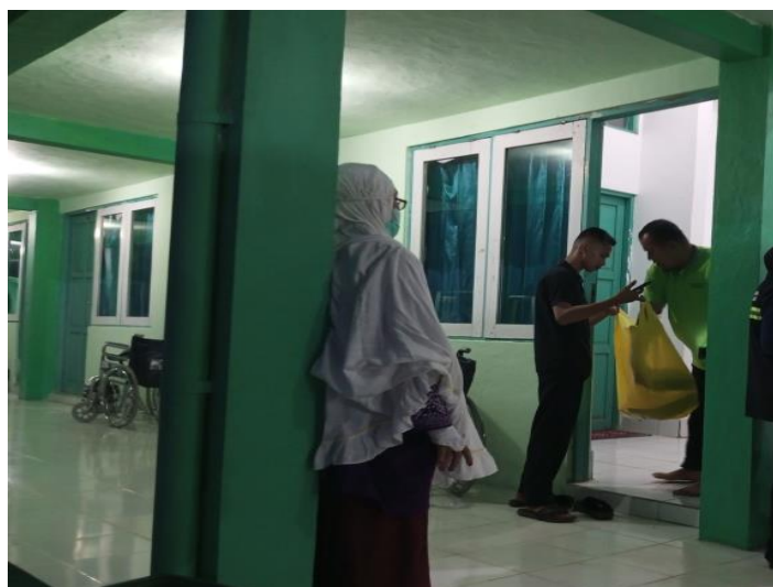
Gambar 4.17 Pembagian Makanan Untuk Jemaah Lansia dari Kamar ke Kamar

diantarkan langsung ke kamar. Bapak Gusti menerangkan bahwa banyak camilan ( wadai ) disediakan serta makanan diantarkan langsung ke kamar. 75 Pelayanan Asrama Haji bagi haji lansia diakui Bapak Nur Asyikin cukup memadai, dengan tambahan susu untuk gizi dan snack, serta perhatian yang baik terhadap masalah kesehatan dan kebutuhan lainnya. 76