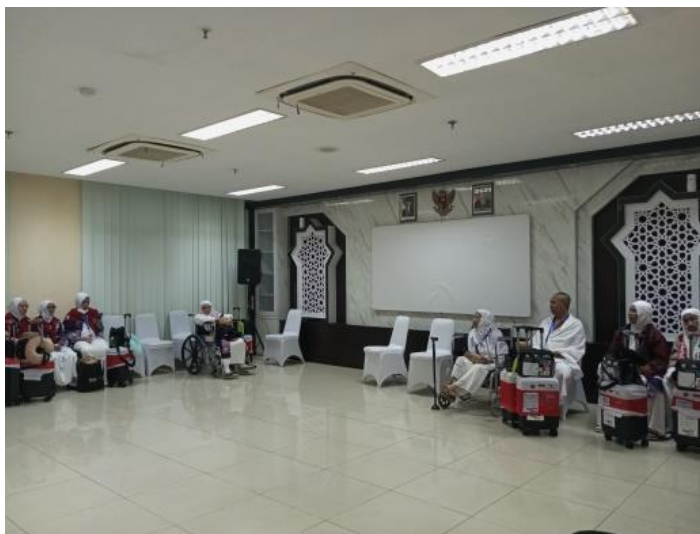
Gambar 4.18 Jemaah Lansia sedang berada di Ruang Tunggu Khusus

yang bisa mempengaruhi kesehatan jemaah lansia. Sesuai dengan hasil wawancara bersama Bapak Rasyid bahwa setibanya di embarkasi, jemaah haji lansia tidak diharuskan mengikuti prosesi seremonial penyambutan seperti jemaah lainnya. Sebagai gantinya, mereka langsung diarahkan ke ruang khusus yang telah disediakan untuk memberikan kenyamanan dan menghindarkan jemaah lansia dari kelelahan akibat seremonial yang tidak wajib bagi mereka. 78