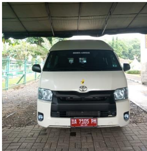
Gambar 4.21 Mobil Toyota HiAce untuk Mobilisasi Lansia

embarkasi. Mobil Toyota HiAce tersebut dirancang untuk menampung sejumlah penumpang yang lebih besar dibandingkan mobil golf, sehingga cocok untuk mengangkut lebih banyak jemaah haji sekaligus. Toyota HiAce dipilih sebagai basis transportasi untuk jemaah haji lansia karena pintu geser yang lebar memudahkan akses masuk dan keluar, terutama saat menangani jemaah lansia yang menggunakan kursi roda dan kemampuan manuvernya yang baik sangat penting untuk navigasi di jalan-jalan perkotaan yang padat.