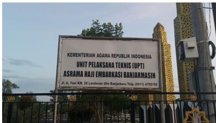
Gambar 4.1 Asrama Haji Embarkasi Banjarmasin