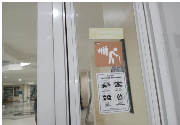
Gambar 4.5 Stiker “Utamakan Lansia” dipintu depan gedung