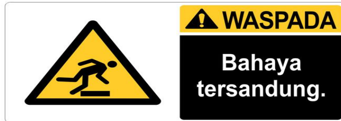
Gambar 4.6 Stiker tanda peringatan untuk memperhatikan langkah dalam berjalan