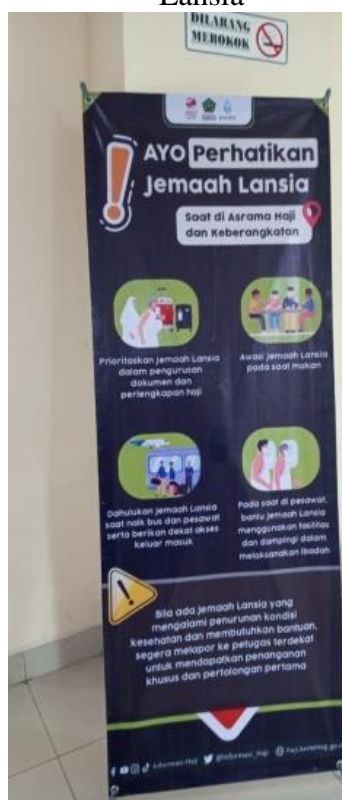
Gambar 4.9 Banner AYO Perhatikan Jemaah Lansia