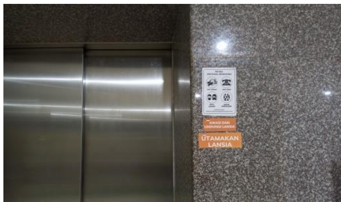
Gambar 4.3 Stiker “Awas dan Lindungi Lansia” dan “Utamakan Lansia” didepan pintu lift

Pemasangan stiker himbauan untuk mendahulukan lansia serta peringatan mengenai lantai licin atau perbedaan ketinggian membantu meningkatkan kewaspadaan dan perhatian terhadap lansia. Petunjuk ini bertujuan meminimalkan risiko cedera akibat kondisi lingkungan yang kurang mendukung. Dengan adanya himbauan tersebut, jemaah non lansia juga diharapkan dapat memahami dan menghormati kebijakan yang mengutamakan kenyamanan lansia dalam bidang pelayanan.