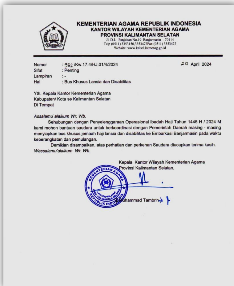
Gambar 4.8 Surat Permintaan Pengadaan Bus Khusus bagi Lansia dari Daerah Menuju Asrama Haji