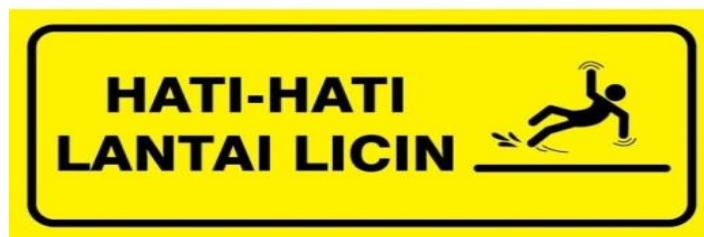
Gambar 4.7 Stiker tanda peringatan bahwa lantai licin