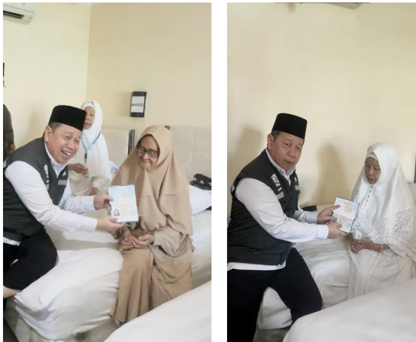
Gambar 4.13 Penyerahan Dokumen kepada Jemaah Lansia