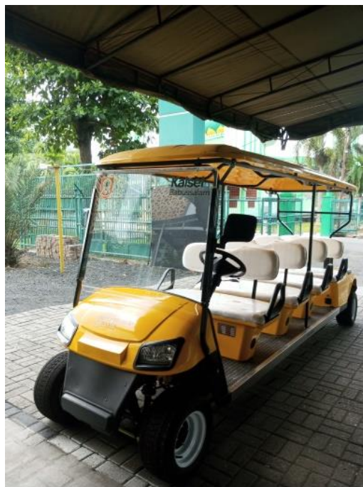
Gambar 4.20 Mobil Golf untuk Mobilisasi Lansia

Banjarmasin menyediakan layanan mobil golf untuk memfasilitasi mobilitas jemaah haji lansia di area embarkasi. 79 Mobil golf yang disediakan dapat mengangkut hingga 7 orang penumpang dan 1 supir yang menjadikannya sarana transportasi yang ideal untuk memfasilitasi perpindahan jemaah haji lansia di area embarkasi dengan kapasitas yang memadai untuk kebutuhan jemaah haji lansia.