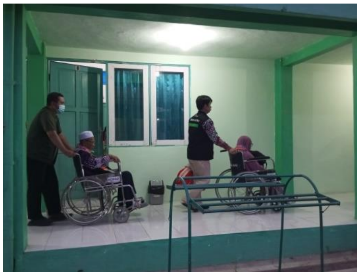
Gambar 4.11 Penyambutan dan Pengantaran Lansia dengan Kursi Roda oleh Petugas

Para jemaah haji lansia akan disambut sejak tiba, baik di bus maupun mobil. Setibanya, jemaah haji lansia akan langsung diberikan kursi roda untuk kenyamanan dan kemudahan mobilitas. Jemaah haji lansia akan diantar oleh petugas ke kamar masing-masing. Pendampingan tersebut mencakup mendorong kursi roda, membantu dalam proses duduk dan berdiri, serta memastikan keselamatan jemaah.