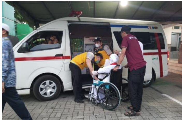
Gambar 4.22 Petugas membantu seorang Jemaah lansia di kursi roda untuk keluar dari mobil Toyota HiAce