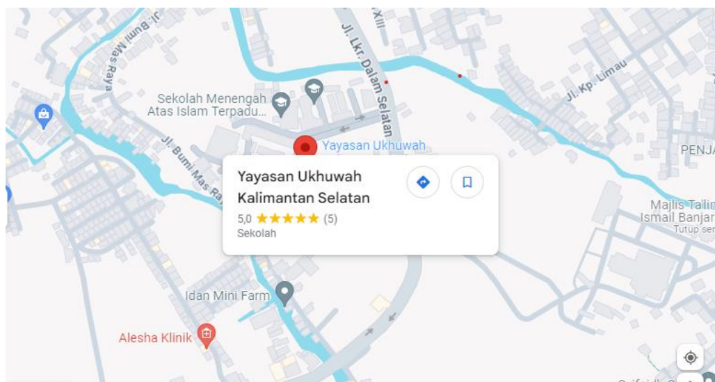
Gambar 3.1 Lokasi Yayasan Ukhuwah Kalimantan Selatan

Lokasi penelitian merupakan objek penelitian yang menjadi tempat peneliti lakukan. Adapun lokasi pada penelitian ini yaitu Yayasan Ukhuwah Kalimantan Selatan yang beralamat di Jalan Bumi Raya Komplek Handayani, Kelurahan Pemurus Baru, Kecamatan Banjarmasin Selatan, Kota Banjarmasin, Provinsi Kalimantan Selatan. Sistem pengupahan pada guru tetap di yayasan tersebut mengacu pada peraturan yayasan No. 04/SK/PY/Int/YS-UKW/VII/2019 tentang Pengupahan Pegawai Yayasan Ukhuwah Banjarmasin. Pemberian upah pada guru tetap Yayasan Ukhuwah Kalimantan sesuai dengan keputusan Gubernur Kalimantan Selatan mengenai penetapan Upah Minimum Kabupaten/Kota disebut UMK, serta komponen upah yang didapatkan guru tetap yayasan sesuai dengan peraturan yayasan.