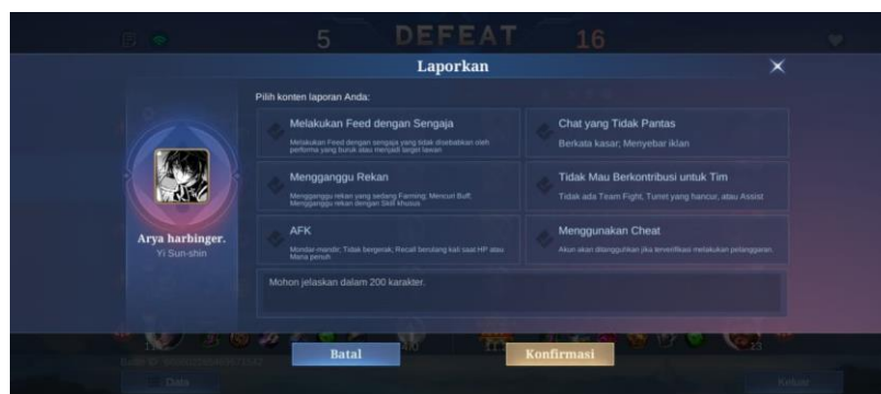
Gambar 4.2 laporan permainan game mobile legend

“Perilaku toxic dalam bermain game mobile legend adalah tindakan atau ucapan pemain yang mengganggu, menghina, atau merusak suasana permainan dan dilakukan untuk melampiaskan emosi serta merendahkan pemain lain.” 34