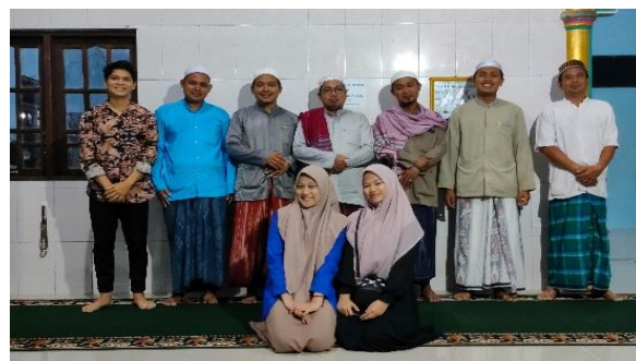
Foto bersama Para Da'i Setelah wawancara