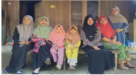
Foto bersama Ustadzah dan Muallaf setelah wawancara