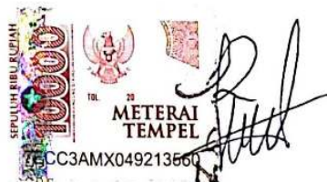
Noor ' Afifah Khumaira