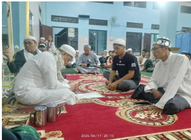
Gambar 4. 3 Membimbing dan Memberikan Motivasi kepada mualaf yang baru

ceramah beliau di Mesjid Al Anwar Malinau yang di dampingi oleh Ustadz Yudi di sebelah beliau. Beliau mengIslamkan warga setempat dan menyampaikan dakwah dengan ceramah dengan lemah lembut memberikan motivasi dan semangat untuk para mualaf dan para warga dalam selalu menuntut ilmu agama Islam.