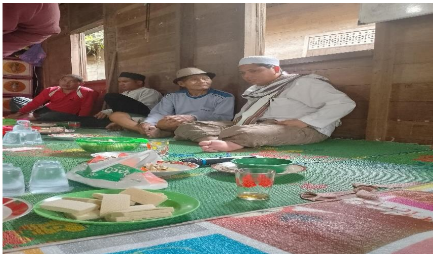
Gambar 4. 4 Kunjungan dan Silaturahmi kepada salah satu rumah Mualaf

Beliau mengunjungi rumah warga dalam bentuk silaturahmi beliau berbicara dengan warga sangat akrab seperti keluarga tanpa membeda bedakan suku apapun itu.