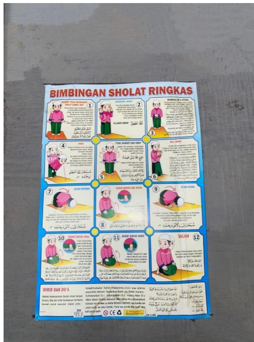
Gambar 4. 7 Simbol keagamaan tata cara sholat

Peletakan beberapa simbol keagamaan seperti tatacara Sholat dan bacaan keIslaman.