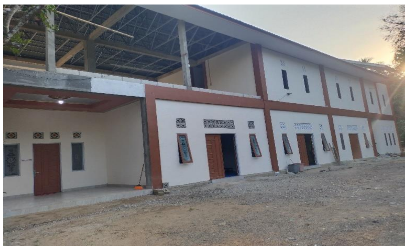
Gambar 4. 6 Pondok Pesantren As-Shoffa HSS

Ustadz mahyudi juga menyampaikan bahwa apa yang disampaikan Habib Salam itu benar adanya, pada wawancara beliau menyampaikan penyampaian: Sekarang alhamdulillah untuk pendidikan masyarakat mualaf sudah ada dijamin di pondok pesantren As Shoffa di kediaman Habib, distu mereka difasilitasi pendidikan gratis. Dan itu di harapkan nantinya para mualaf yang masuk disana keluar bisa menjadi ustad dan menjadi da'i di kampung mereka. 23