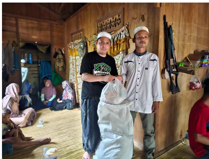
Gambar 4. 5 Pemberian sumbangan setiap kunjungan

Pemberian bantuan berupa sumbangan alakadarnya kepada para mualaf di Kecamatan Loksado tepat nya di Desa Loklahung.