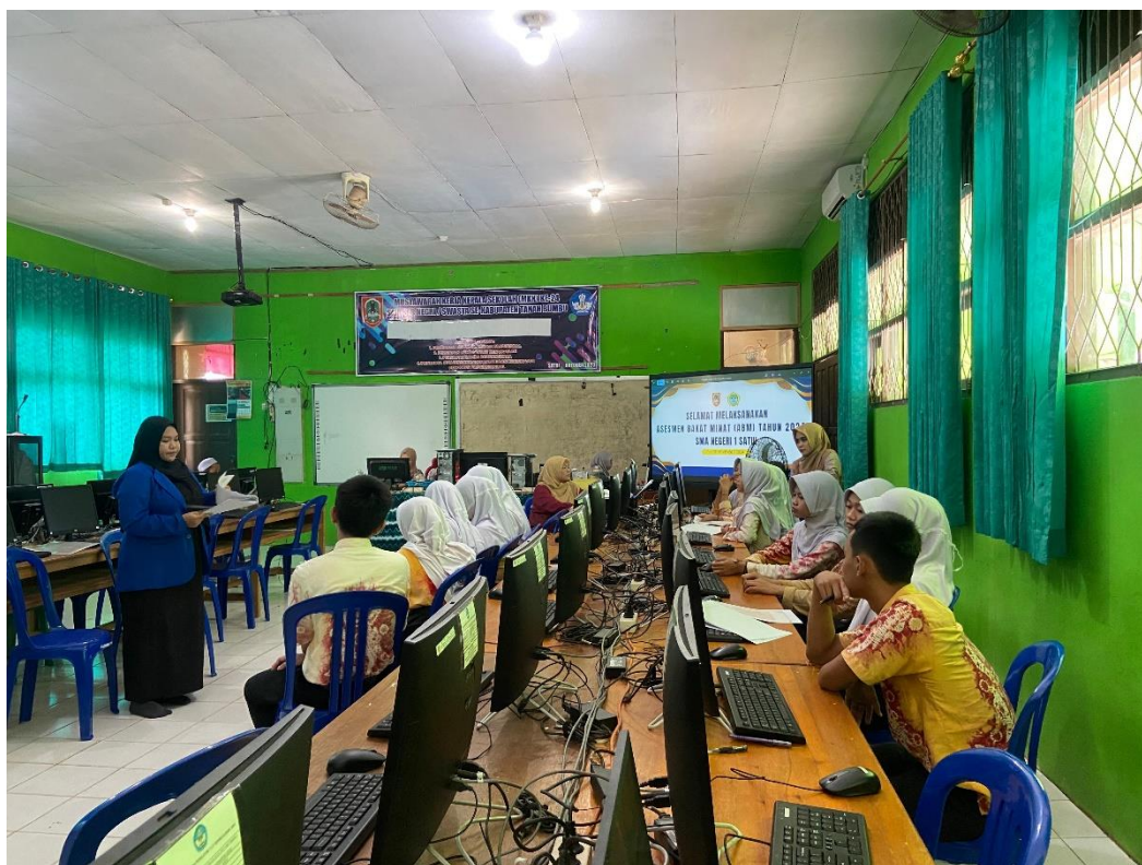
Gambar 2. Peneliti Mengenalkan Produk dan Petunjuk Praktikum Berbasis Etnokimia kepada Peserta Didik