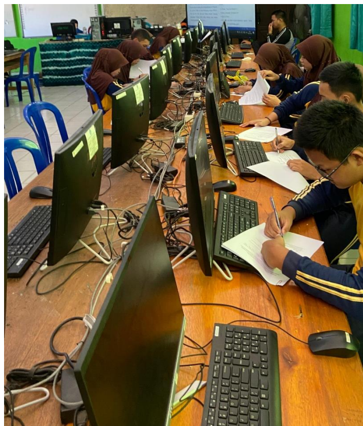
Gambar 4. Peserta Didik Mengisi Angket Respon Peserta Didik