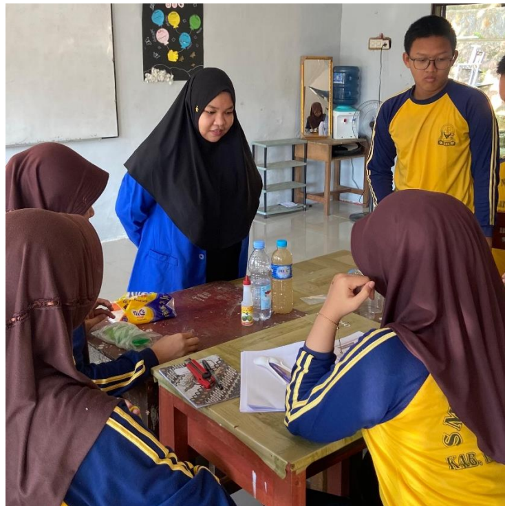
Gambar 3. Peneliti Membimbing Praktikum Peserta Didik