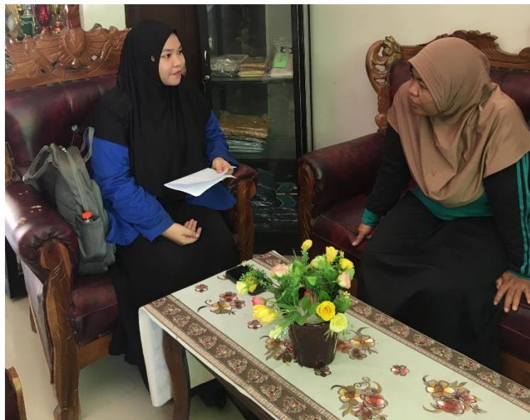
Gambar 1. Peneliti Mewawancarai Guru Kimia