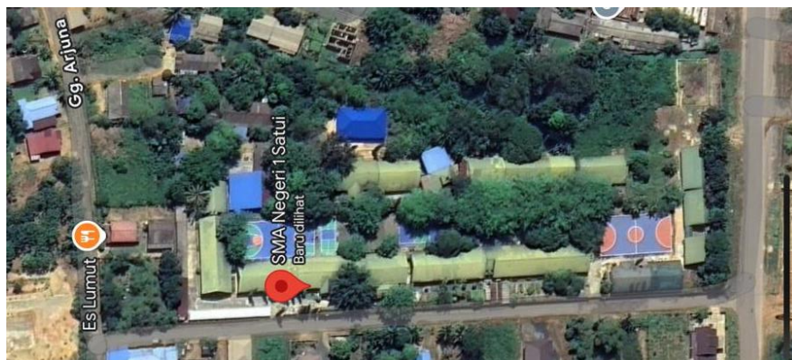
Gambar 3. 2 Letak Geografis SMAN 1 Satui

Gambar 3.2 menunjukkan letak geografis SMAN 1 Satui.