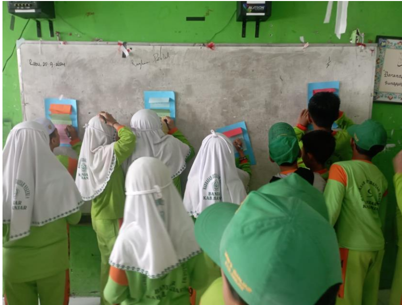
Gambar 4. 3 Kegiatan Pembelajaran Teams games Tournament

Pembelajaran dimulai dengan salam dan doa bersama. Guru kemudian menyapa dengan menanyakan kabar dan memeriksa kehadiran, kerapian, posisi, dan tempat duduk yang benar. Mereka kemudian berkonsentrasi pada materi pokok dengan bertanya, seperti yang dilakukan di buku siswa, dan meminta siswa untuk mendengarkan tujuan pembelajaran.