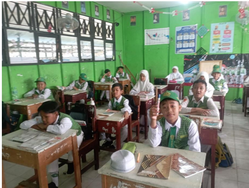
Gambar 4.4 Kegiatan Pembelajaran Talking Stick

Rincian kegiatan pembelajaran yang dilakukan guru dalam setiap pertemuan yaitu Pembelajaran dimulai dengan salam dan doa bersama. Guru kemudian menyapa dengan menanyakan kabar dan memeriksa kehadiran, kerapian, posisi, dan tempat duduk yang benar. Mereka kemudian berkonsentrasi pada materi pokok dengan bertanya, seperti yang dilakukan di buku siswa, dan meminta siswa untuk mendengarkan tujuan pembelajaran.