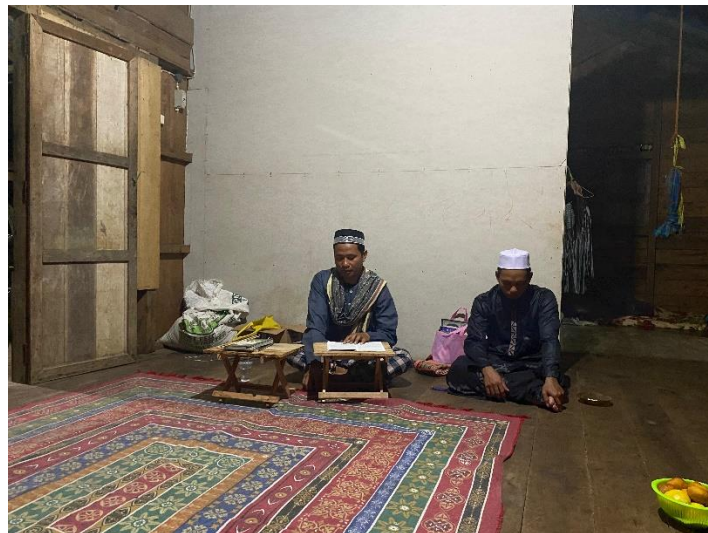
Kegiatan pembinaan ceramah agama di Desa Kambiyain