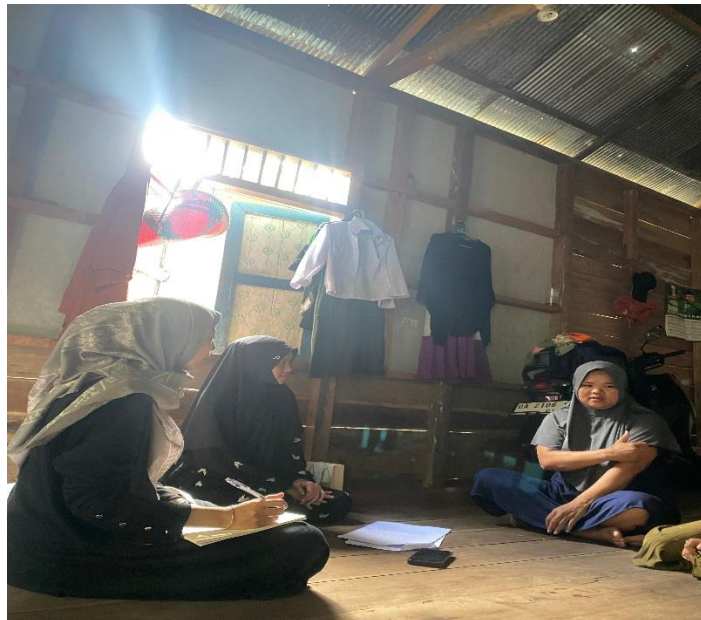
Wawancara dengan mualaf di Desa Dayak Pitap