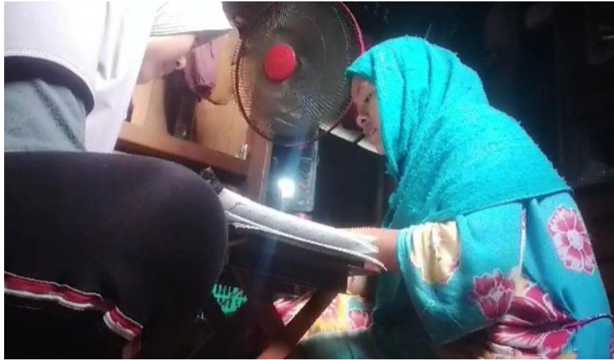
Kegiatan belajar mengaji di Desa Dayak Pitap