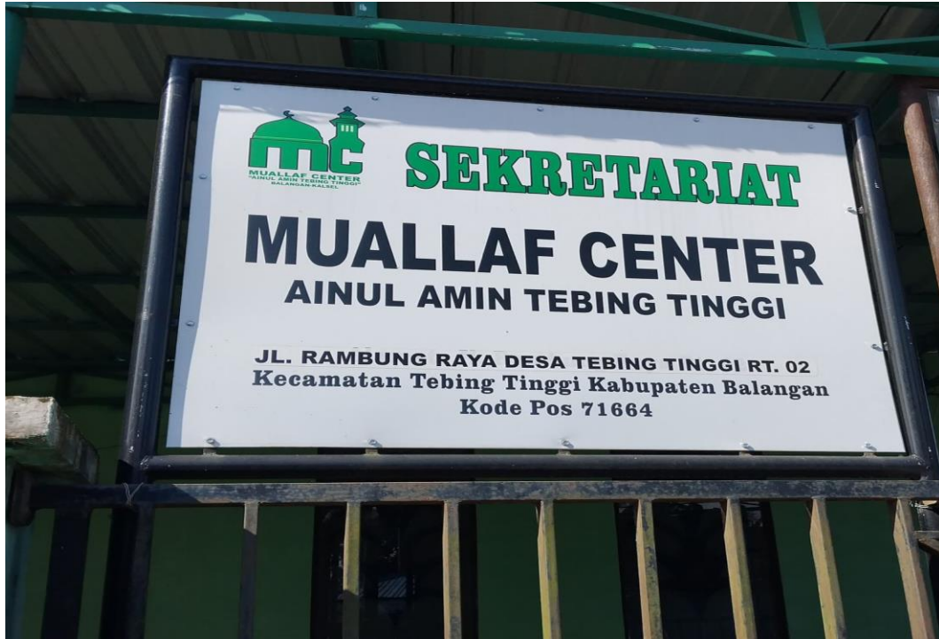
Palang Sekretariat Muallaf Center Ainul Amin