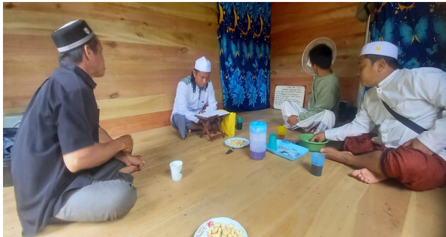
Kegiatan ceramah agama di Desa Dayak Pitap