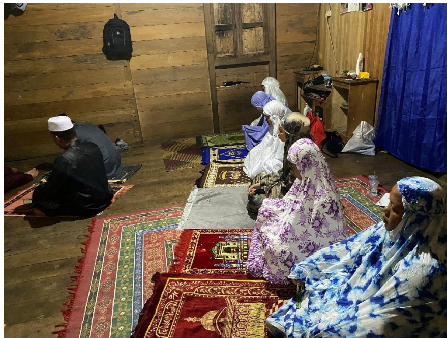
Kegiatan sholat isya berjamaah dengan para mualaf di Desa Dayak Pitap