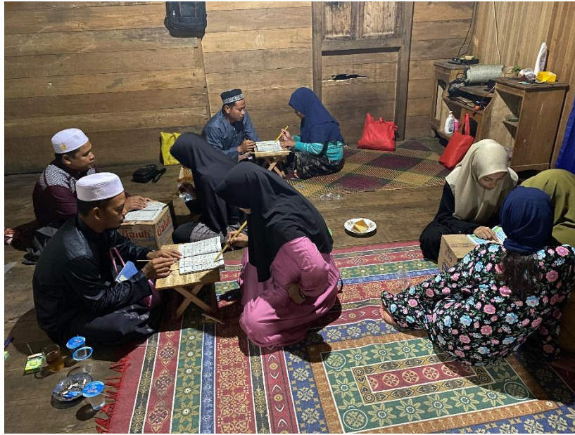
Kegiatan belajar mengaji di Desa Kambiyain