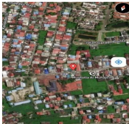
Gambar 3.2 Letak Geografis MA Irtiqaiyah Banjarmasin