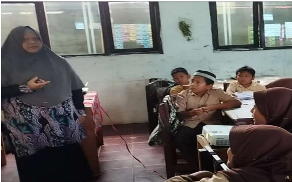
Pelaksanaan Pembelajaran Akidah Akhlak Kelas IV