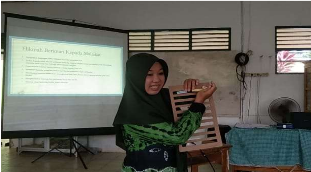
Gambar.6.1. Pelaksanaan Kegiatan Belajar Mengajar Akidah Akhlak