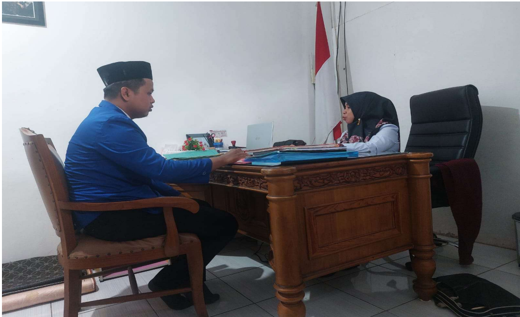
Gambar 6.4. Wawancara dengan Nara Sumber (Ibu Kepala MIN 2 Tanah Laut)