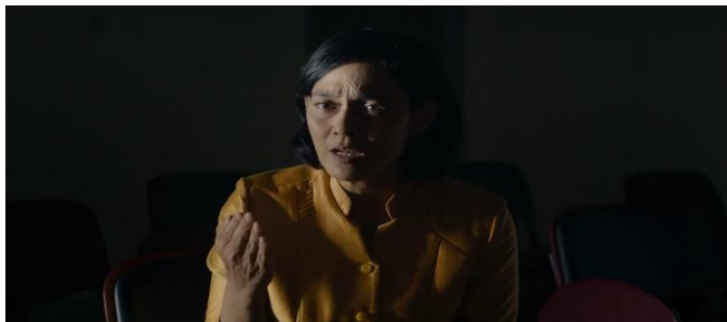
Gambar 5.3 adegan Bu Prani yang menolak permintaan kepala sekolah yang meminta informasi pribadi muridnya dibuka ke publik, karena mempertimbangkan dampaknya bagi murid tersebut