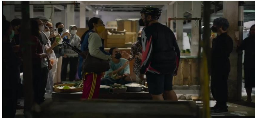
Gambar 2.1 adegan Bu Prani menegur bapak-bapak yang menyerobot antrean