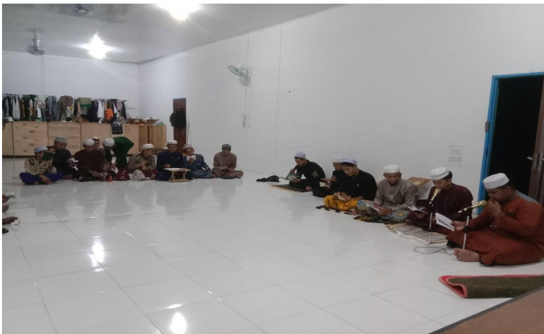
Foto saat kegiatan pembacaan Burdah