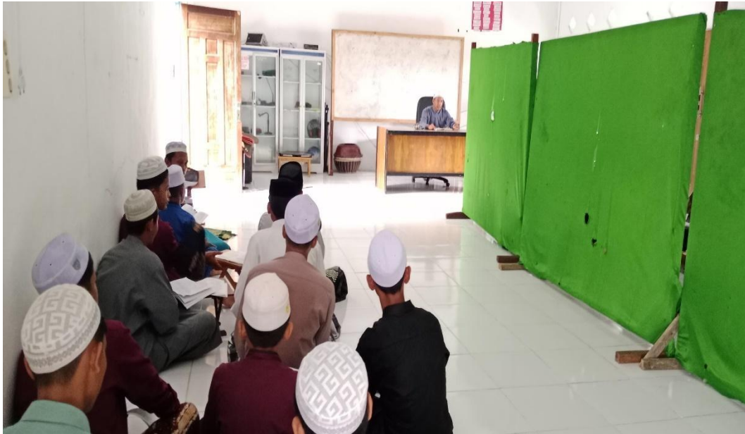
Foto saat santri putra belajar kitab