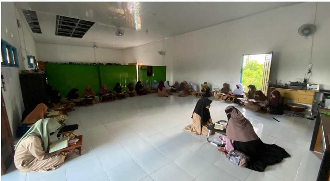
Foto saat kegiatan setoran hafalan santri putri dengan ustazah Husnul Khotimah di Pondok Pesantren Tahfizh Ihya Ulumuddin