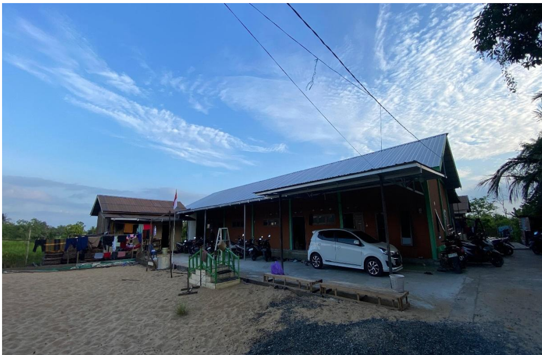
Foto Pondok Pesantren Tahfidz Ihya Ulumuddin Kecamatan Tabukan