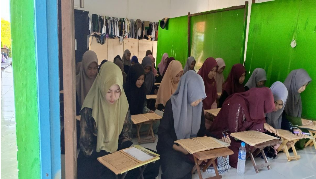
Foto saat santri putri sedang belajar kitab