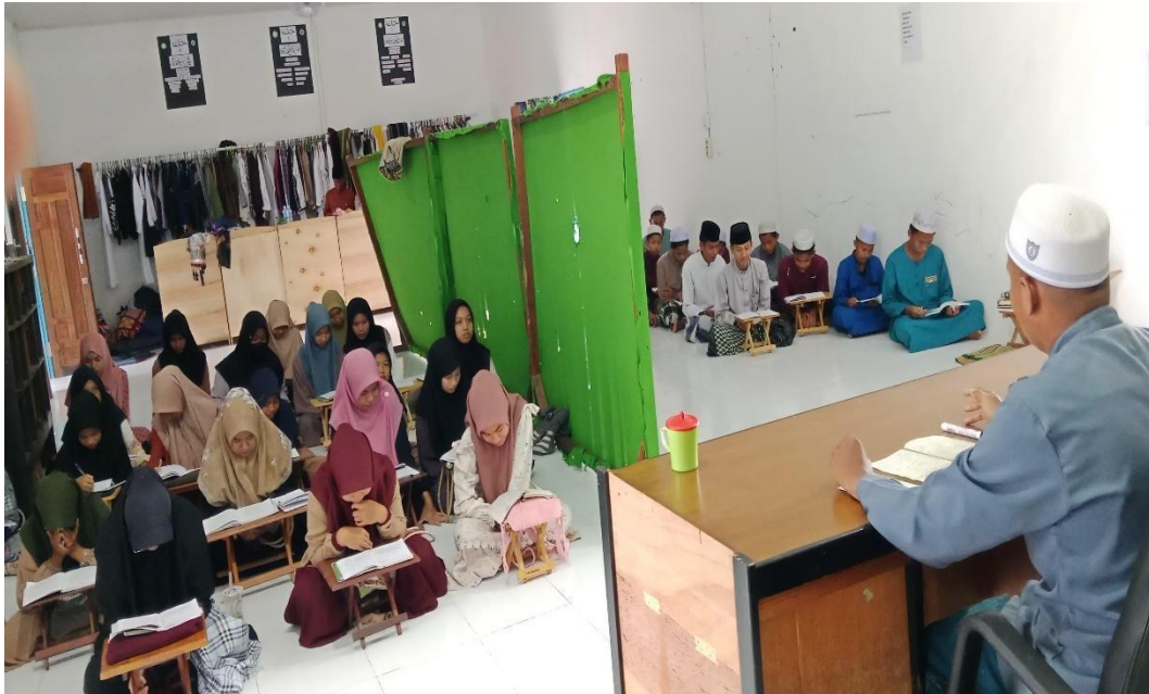
Foto saat kegiatan pembelajaran kitab di Pondok Pesantren Tahfizh Ihya Ulumuddin