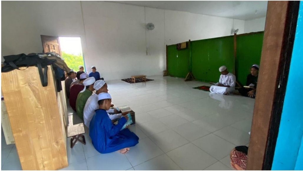
Foto saat kegiatan santri putra menghafal Al-Qur'an di Pondok Pesantren Tahfizh Ihya Ulumuddin