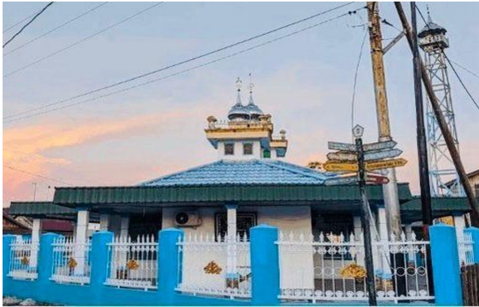
Gambar 4. 2 Pondok Pesantren Tahfidz Ihya Ulumuddin di Kecamatan Tabukan Saat Masih di Langgar At-Taqwa Pada Tahun 2016

Pada tahun 2017, Desa Tabukan Raya ditunjuk untuk mengadakan Musabaqah Tilawatil Qur'an dan saat tahun 2017 Kecamatan Tabukan membangun Gedung LPTQ untuk memfasilitasi kegiatan MTQ di Desa Tabukan Raya, Pemerintah Kecamatan Tabukan memberikan hak izin untuk peminjaman gedung ke Ustadz Khairul Azmi untuk kegiatan santri menghafal Al-Qur'an yang sebelumnya diadakan di Langgar At-Taqwa menjadi di Gedung LPTQ karena meningkatnya minat dari masyarakat di Kecamatan Tabukan terhadap kegiatan menghafal Al-Qur'an maka bertambahlah jumlah santri dan santriwati yang belajar disana.