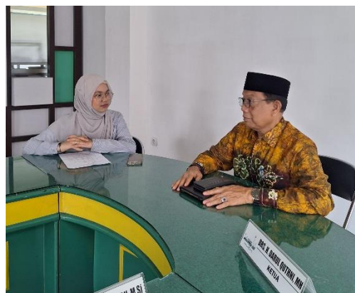
Wawancara dengan pembimbing pemantapan manasik haji