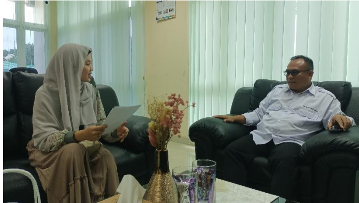
Wawancara dengan Kepala UPT Asrama Haji Embarkasi Banjarmasin