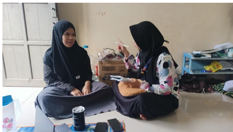
Wawancara dengan jemaah haji tahun 2024