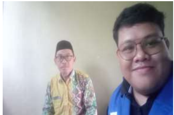
Bersama Penghulu KUA Cempaka 1