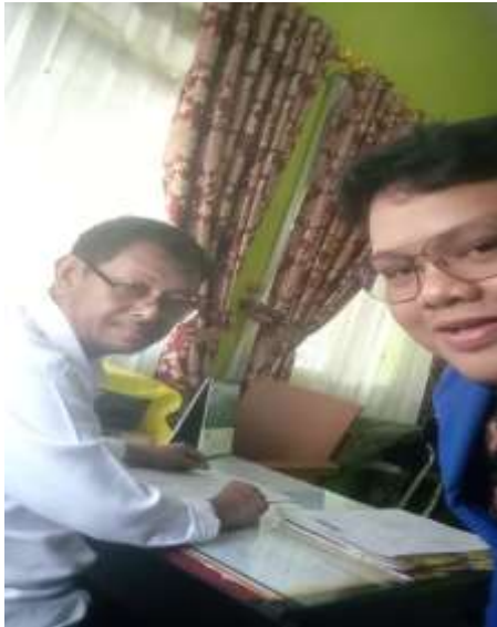
Bersama Kepala KUA Liang Anggang