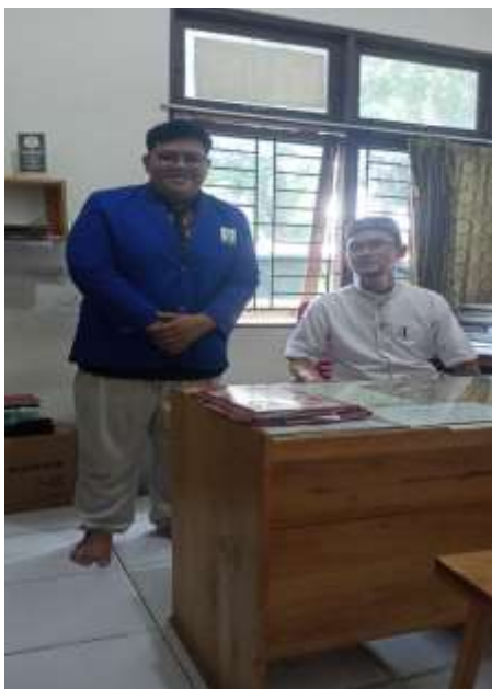
Bersama Kepala KUA Landasan Ulin