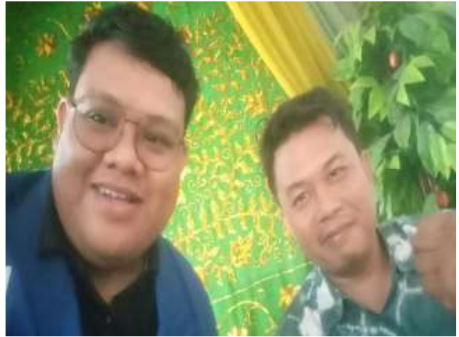
Bersama Penghulu KUA Banjarbaru Selatan 1