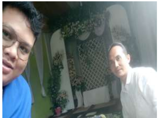
Bersama Penghulu KUA Liang Anggang