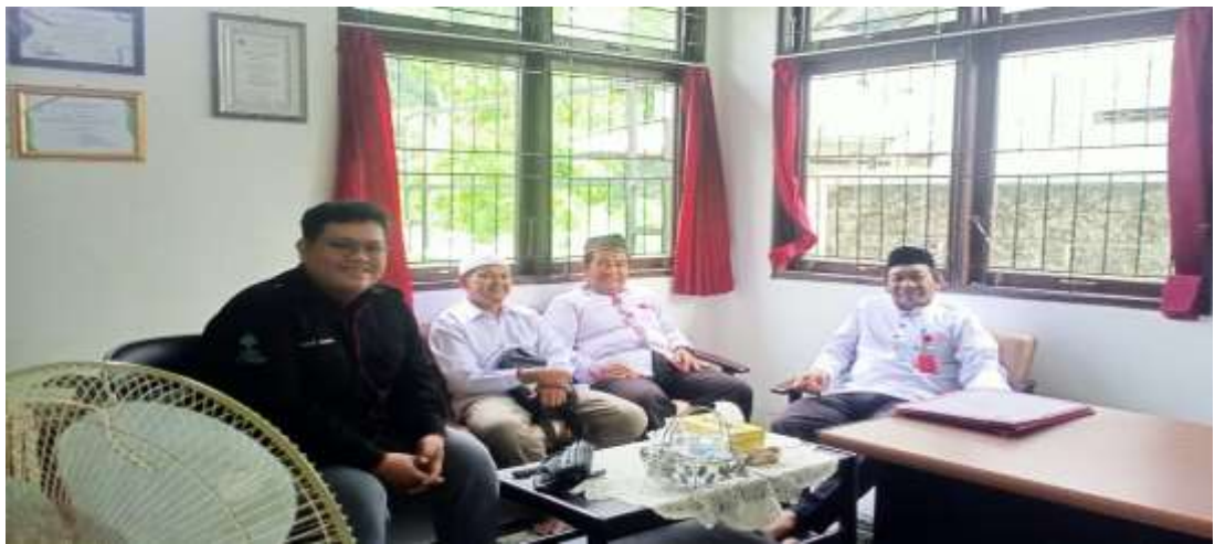
Bersama Kepala KUA dan Penghulu KUA Banjarbaru Selatan