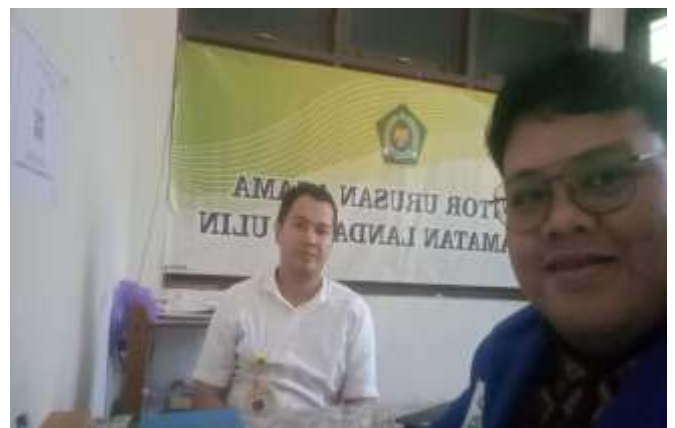
Bersama Penghulu KUA Landasan Ulin