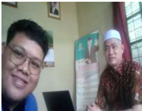
Bersama Kepala KUA Cempaka