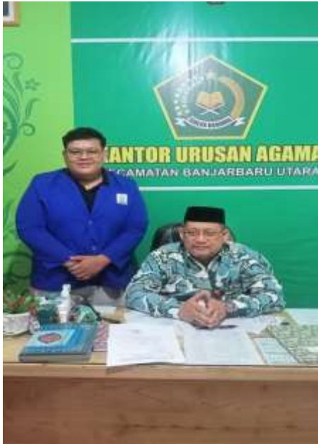
Bersama Kepala KUA Banjarbaru Utara