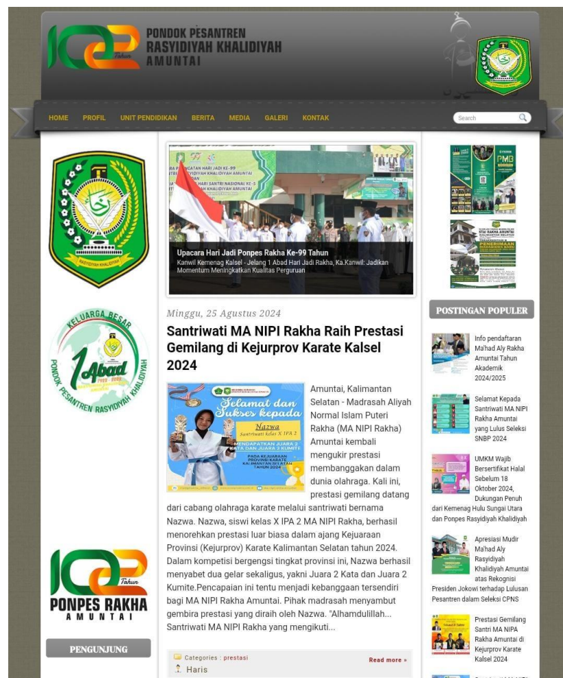
Gambar 4.3. Website Pondok Pesantren Rasyidiyah Khalidiyah Amuntai

Website yang dimiliki Pondok Pesantren Rasyidiyah Khalidiyah Amuntai bernama www.ponpesrasyidiyah.khalidiyah.com . Di dalamnya berisikan informasi-informasi serta rangkaian kegiatan-kegiatan yang dilakukan di Pondok Pesantren Rasyidiyah Khalidiyah Amuntai, dengan tujuan agar Pondok Pesantren Rasyidiyah Khalidiyah Amuntai dapat dikenal oleh masyarakat luas. 3