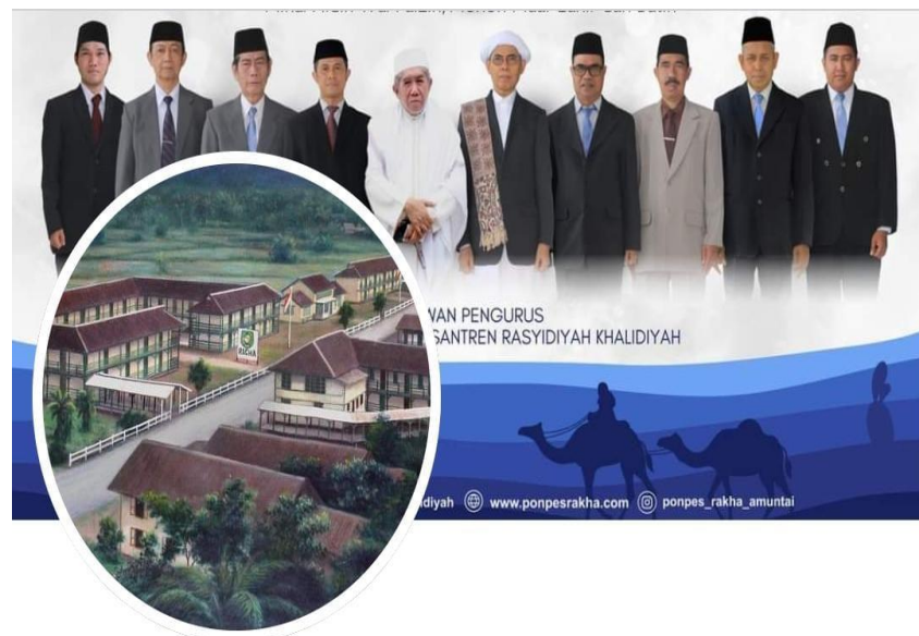
Gambar 4.2. Facebook Pondok Pesantren Rasyidiyah Khalidiyah Amuntai

Facebook yang dimiliki Pondok Pesantren Rasyidiyah Khalidiyah Amuntai bernama Ponpes Rasyidiyah Khalidiyah yang memiliki lebih dari 4.700 pengikut. Di dalamnya berisikan informasi-informasi serta rangkaian kegiatan-kegiatan yang dilakukan di Pondok Pesantren Rasyidiyah Khalidiyah Amuntai, dengan tujuan agar Pondok Pesantren Rasyidiyah Khalidiyah Amuntai dapat dikenal oleh masyarakat luas. 2