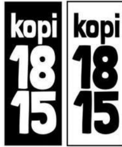
Gambar 4. 1 Logo Kopi 1815