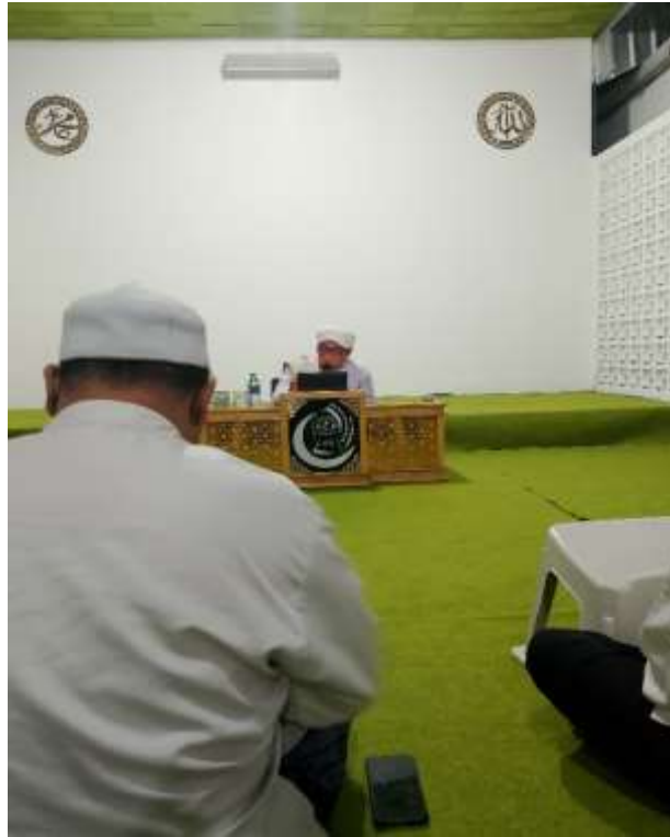
Pembacaan Kitab di Majelis Sya'ban al-Awwabin