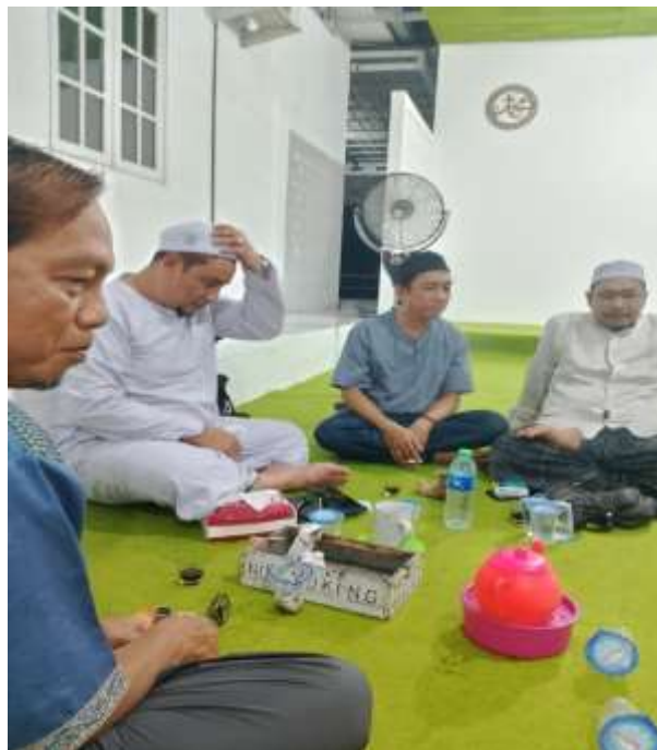
Wawancara dengan Para pengurus dan Jamaah Majelis Taklim Sya'ban al-awwabin