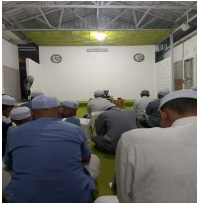
Jamaah Majelis Taklim Sya'ban al-Awwabin