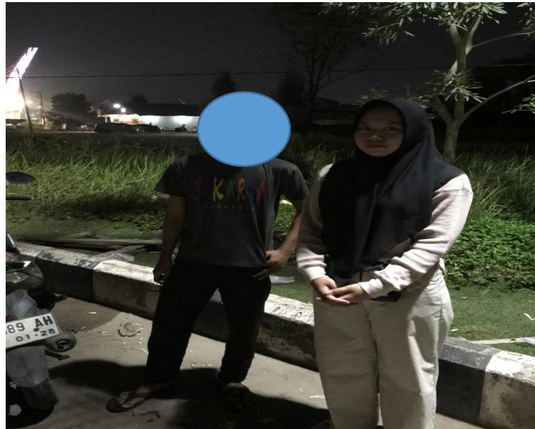
Gambar 12. Wawancara dengan teknisi kendaraan (S)