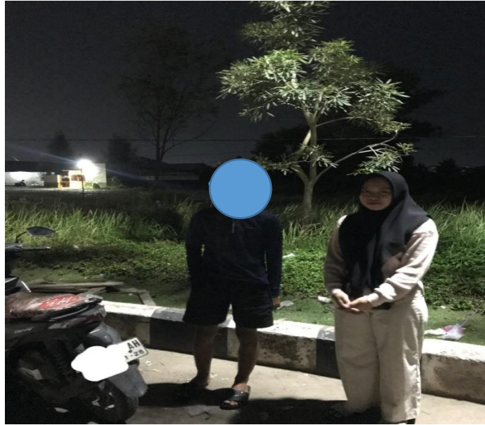
Gambar 10. Wawancara bersama pelaku balap liar (MF)