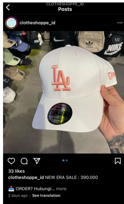
Gambar 1. 1 Produk @Clotheshoppe_id

Beberapa akun Instagram media sosial menawarkan layanan titip beli online. Dalam penelitian ini, penulis mengamati salah satu akun Instagram, yakni @clotheshoppe_id, yang telah berhasil menarik perhatian sejumlah besar pelanggan.