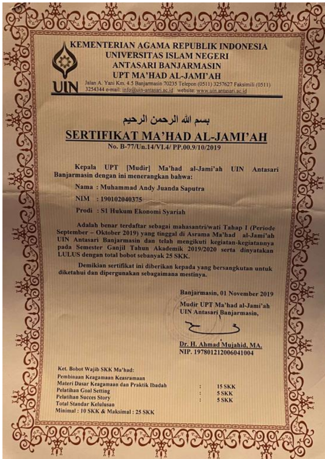
Lampiran 13 Sertifikat Ma'had al-Jami'ah