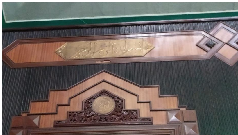
Kaligrafi di Masjid Jami' Banjarmasin Q.S. al-Fatihah/1: 1