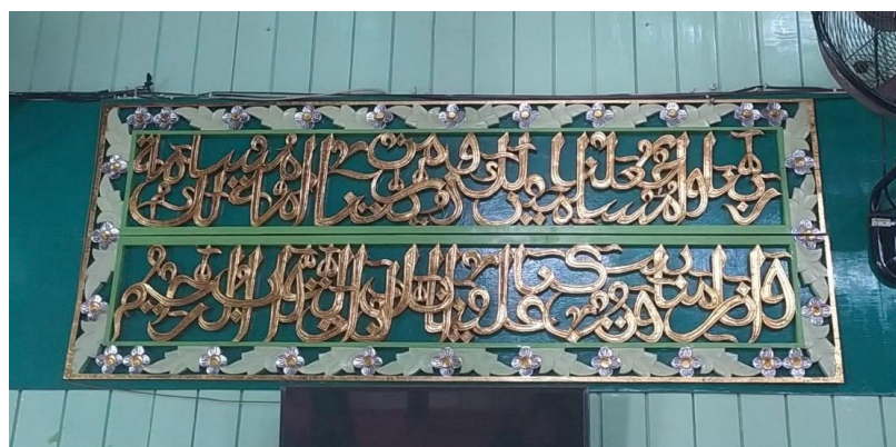
Kaligrafi di Masjid Sultan Suriansyah Q.S. al-Baqarah/2: 128