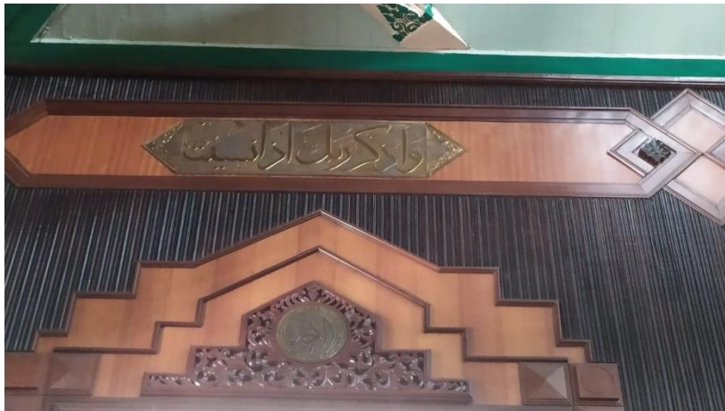
Kaligrafi di Masjid Jami' Banjarmasin Q.S. al-Kahfi/18: 24