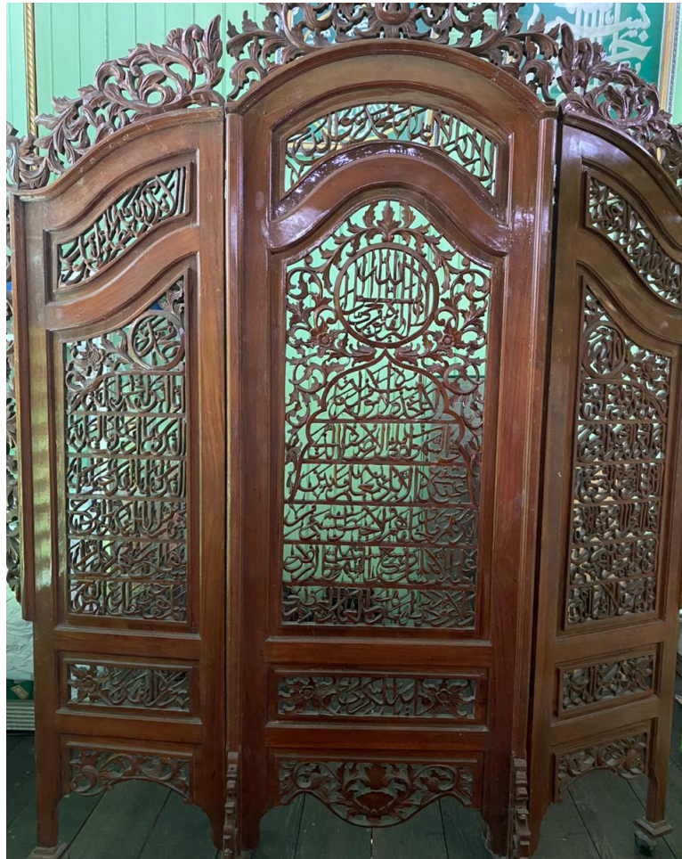
Kaligrafi di Masjid Sultan Suriansyah Q.S. Q.S. al-Fatihah/1: 1-7, Q.S. al-Baqarah/2: 255, dan Q.S. al-Qadr/97: 1-5