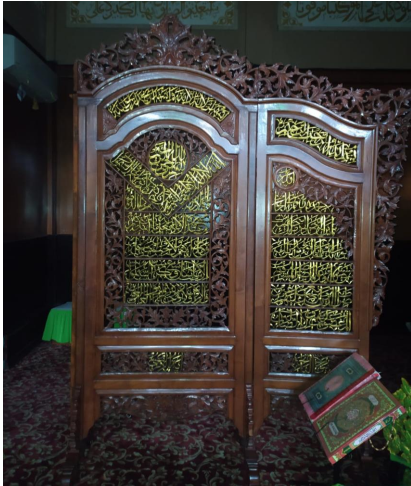
Kaligrafi di Masjid Jami' Banjarmasin Q.S. al-Fatihah/1: 1-7, dan Q.S. al-Baqarah/2: 255