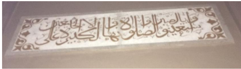
Kaligrafi di Masjid Jami' Banjarmasin Q.S. al-Baqarah/2: 45