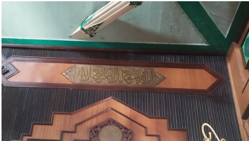
Kaligrafi di Masjid Jami' Banjarmasin Q.S.al-Fath/48: 10