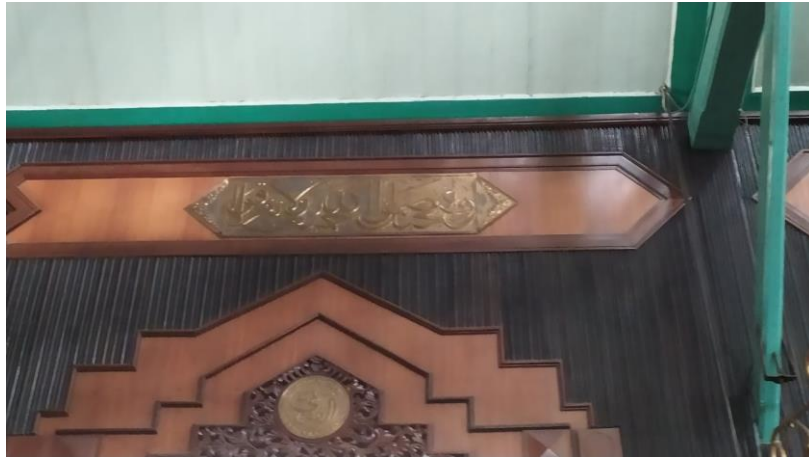
Kaligrafi di Masjid Jami' Banjarmasin Q.S. Ali Imran/3: 103