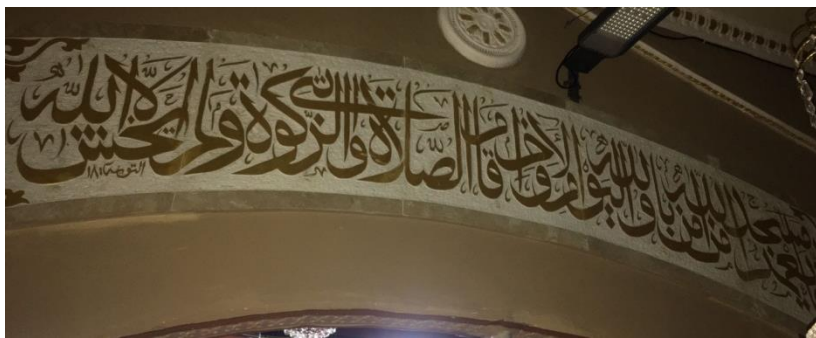
Kaligrafi di Masjid Jami' Banjarmasin Q.S. at-Taubah/9: 18