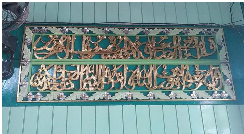
Kaligrafi di Masjid Sultan Suriansyah Q.S. al-Jumu'ah/62: 10