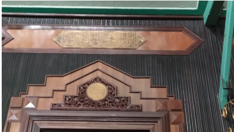
Kaligrafi di Masjid Jami' Banjarmasin Q.S.al-'Alaq/96: 3-5