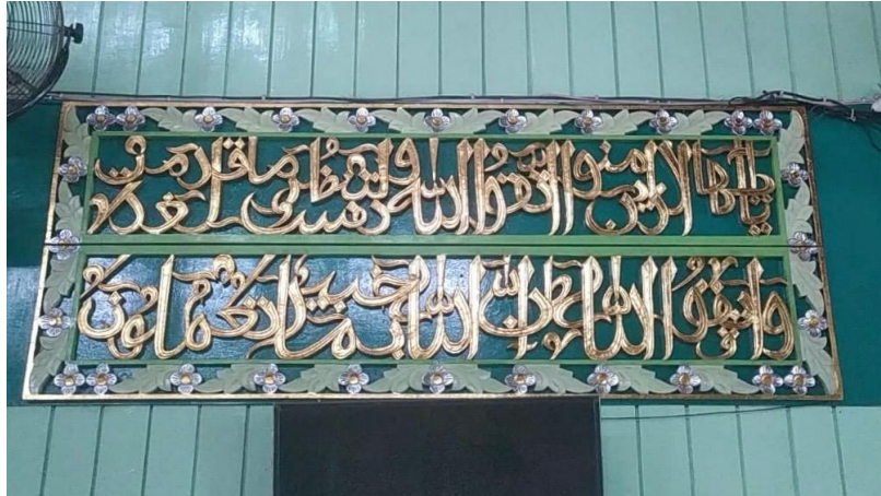
Kaligrafi di Masjid Sultan Suriansyah Q.S. al-Hasyr/59: 18