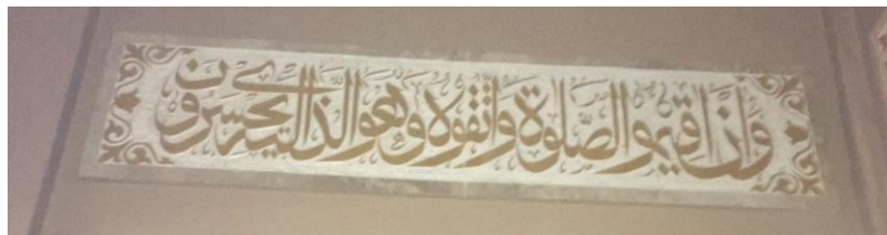
Kaligrafi di Masjid Jami' Banjarmasin Q.S. al-An'am/6: 72