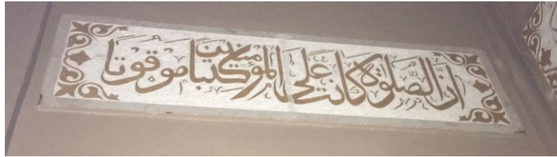
Kaligrafi di Masjid Jami' Banjarmasin Q.S. an-Nisa/4: 103