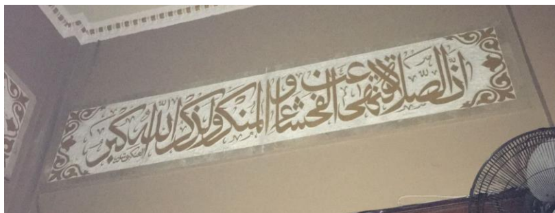
Kaligrafi di Masjid Jami' Banjarmasin Q.S. al-'Ankabut/29: 45