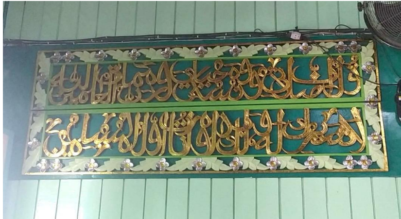
Kaligrafi di Masjid Sultan Suriansyah Q.S. al-An'am/6: 162-163