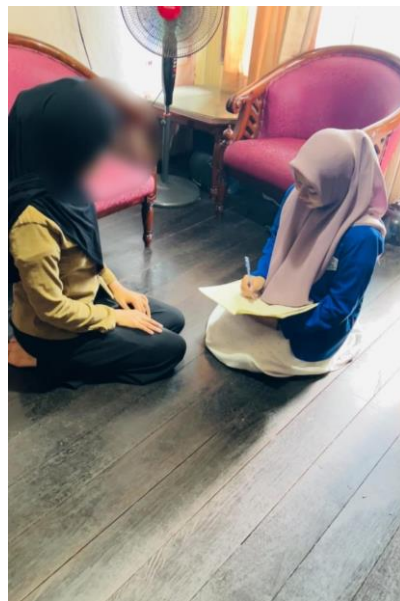
Dokumentasi Bersama Ibu LL (S1)