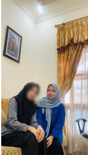
Dokumentasi Bersama Ibu IPL (S2)