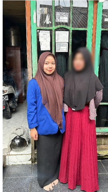
Dokumentasi Bersama Ibu N (SMA)