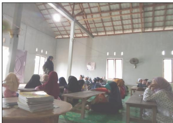
Gambar 4.3 : Pengelompokan santri / santriwati

Kegiatan belajar dilaksanakan dengan membagi menjadi dua kelompok dan dipimpin / didampingi masing-masing ustad / ustadzah, kelompok pertama terdiri dari santri / santriwati yang membaca kitab Iqro dan kelompok kedua santri / santriwati yang sudah membaca kitab Al Quran. Setiap santri/santriwati akan bergiliran dipanggil oleh ustad/ustadzahnya dan yang belum mendapat giliran mengisi waktu senggangnya dengan menuliskan kembali bacaan kitab Iqro atau Al quran dengan huruf hijaiyah (Tahsinul Kitabah) yang dipelajarinya pada hari itu, dan menyerahkan hasil tulisannya pada pengajarnya hari itu juga jika sudah selesai, tapi jika tidak selesai pada hari tersebut maka hasil tulisannya diserahkan besok harinya.