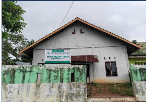
Gambar 4.2 Tampak Depan Gedung TK/TPA Arkanul Islam

Berdasarkan hasil wawancara dengan Kepala Sekolah TK / TPA Arkanul Islam (Ibu Darmawati) pada tanggal 10 Nopember 2024, diceritakan sejarah berdirinya TK/TPA Arkanul Islam bermula dari keinginan Bapak Muhammad Yasir 90 yang pada saat itu menjabat Kepala Desa Atu-atu periode Tahun 2003 - 2009 dan meninggal dunia Tahun 2018, kepala desa berangkutan mengizinkan masyarakat setempat untuk menggunakan Balai Desa / Gedung Pertemuan Desa Atu-atu sebagai tempat belajar mengaji anak-anak setelah sholat Ashar, awal bangunan tersebut di dirikan melalui swadaya masyarakat desa, selanjutnya diberikan perawatan melalui Anggaran Pemerintah Daerah, dan selanjutnya untuk sarana prasarana di dalamnya mendapatkan