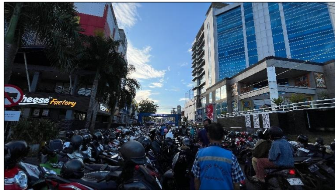
Keadaan pasar ketika survei awal