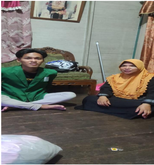
Bersama informan di Desa Telaga Silaba (Nisa)