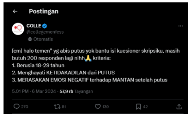
GAMBAR 1.4 MENTION FESS PADA LAMAN MEDIA X

Adapun dalam penelitian ini yang dimaksud dengan akun X @collegemenfess adalah akun anonim yang memberikan ruang bagi mahasiswa atau anggota komunitas perguruan tinggi untuk berbagi cerita, curhat, atau pengalaman mereka secara anonim. Selain itu juga, akun ini bisa digunakan untuk membantu para mahasiswa atau anggota komunitas merasa lebih nyaman dalam berbagi pengalaman atau perasaan mereka tanpa harus mengungkapkan identitas mereka.