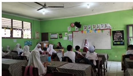
Gambar 4.3 Guru dan seluruh siswa kelas IV berdoa sebelum memulai pelajaran.

Setelah itu, guru kemudian memeriksa kehadiran siswa serta memastikan kerapihan pakaian mereka