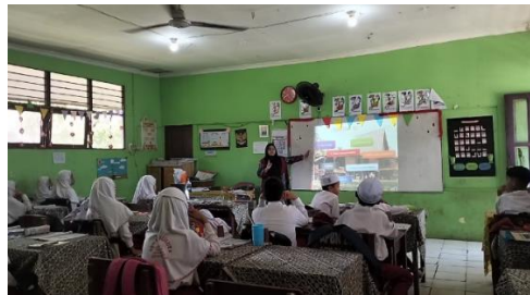
Gambar 4.11 Guru menyampaikan 7 hal yang mengenai kebudayaan suku Banjar Kalimantan Selatan