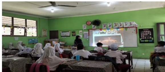
Gambar 4.19 Seluruh siswa kelas IV menonton pertunjukan tari jepen lenggang banua.