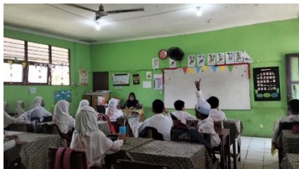
Gambar 4.4 Guru memeriksa kehadiran seluruh siswa kelas IV

sebagai bentuk pembiasaan disiplin. Guru kemudian meminta kepada seluruh siswa untuk mengeluarkan buku pelajaran Pendidikan pancasila serta buku dan alat tulis. Untuk membangkitkan semangat belajar, guru memberikan ice breaking dan motivasi yang mendorong siswa untuk lebih antusias dalam mengikuti pembelajaran.