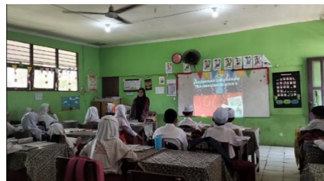
Gambar 4.8 Guru memberikan gambaran awal mengenai materi kebudayaan suku Banjar Kalimantan Selatan.

Guru kemudian menyampaikan kegiatan, capaian pembelajaran dan tujuan pembelajaran dengan jelas, melalui media interaktif berupa powerpoint agar siswa tahu apa yang diharapkan dari mereka. Guru menggunakan pendekatan culturally responsive teaching (CRT) untuk memperkuat identitas budaya siswa karena siswa kelas IV memiliki suku yang beragam yakni suku Banjar, Jawa dan Dayak, serta meningkatkan minat belajar siswa. Terakhir, guru memastikan kesiapan siswa secara mental dan fisik agar mereka dapat mengikuti pembelajaran dengan penuh perhatian dan semangat.