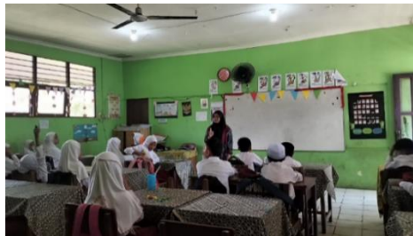
Gambar 4.2 Guru meminta salah satu dari siswa untuk memimpin doa