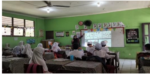
Gambar 4.16 Guru menjelaskan beberapa hal yaitu bahasa suku banjar yaitu bahasa sehari-hari, makanan, anggota tubuh, hewan dan alat masak suku banjar.