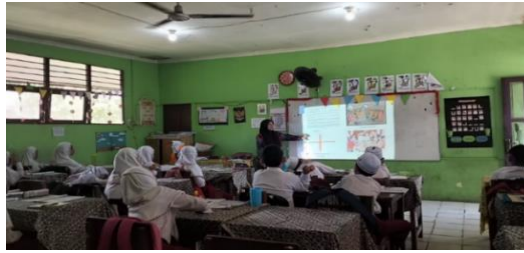
Gambar 4.13 Guru menunjukkan contoh baayun, pepatah dan simbol-simbol suku Banjar (bapidara) dan sasaran.