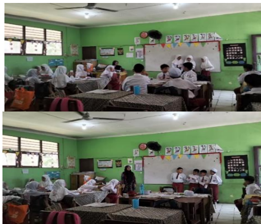
Gambar 4.28 Masing-masing kelompok maju kedepan