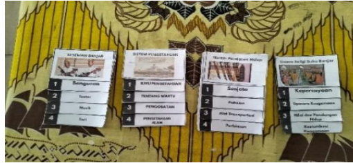
Gambar 4.29 Hasil plifbook yang dibuat setiap kelompok

untuk memaparkan hasil diskusi kelompok.