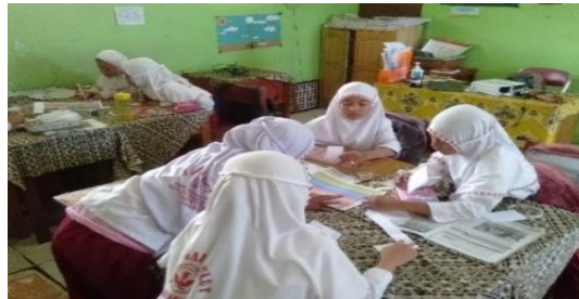
Gambar 4.27 Siswa bekerja sama dengan baik untuk menyelesaikan tugas yang diberikan oleh guru.