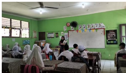
Gambar 4.5 Guru meminta seluruh siswa kelas IV untuk mengeluarkan buku pelajaran Pendidikan Pancasila