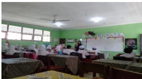
Gambar 4.30 Guru dan Seluruh siswa kelas IV menyimpulkan bersama materi yang telah dipelajari hari ini

memimpin doa setelah belajar didepan kelas. 7