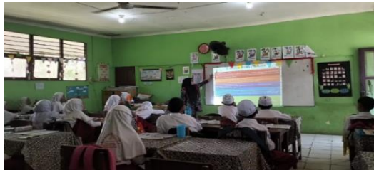
Gambar 4.17 Guru menjelaskan sistem pengetahuan suku Banjar

alam sekitar mereka. Contoh buah cri khas suku banjar yaitu ramania, kasturi, dan kuini.