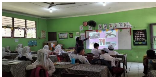
Gambar 4.22 Guru menunjukkan contoh dari sistem peralatan hidup suku banjar

Setelah guru menjelaskan materi yang sudah disampaikan, guru mengajukan pertanyaan kepada siswa tentang berbagai aspek kebudayaan suku Banjar di Kalimantan Selatan, termasuk sistem religi suku banjar, sistem kemasyarakatan suku banjar, sistem kesenian suku banjar, bahasa suku banjar, sistem pengetahuan suku banjar, sistem mata pencaharian suku banjar, dan sistem peralatan hidup suku banjar. Sebelum melanjutkan ke langkah berikutnya.