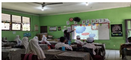
Gambar 4.15 Guru menjelaskan bahasa suku Banjar

Guru menjelaskan mengenai bahasa suku banjar mulai dari bahasa sehari-hari seperti saya “ulun”, kamu “pian”, besar “ganal”, kecil “halus”, kotor “rigat” dan mahal “larang”. Bahasa mengenai makanan ubi jalar “gumbili lanjar”, kunyit “janar”, dan labu “waluh”. Bahasa peralatan yang ada didapur yaitu wajan “rinjing”, teko “cirat”, kompor “atang” dan lain-lain. Adapun bahasa anggota tubuh yaitu alis “kaning” dan lain sebagainya.