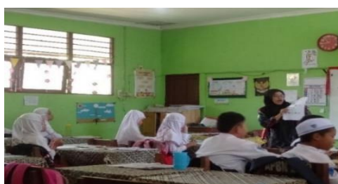
Gambar 4.24 Siswa menyimak petunjuk pembuatan yang diberikan oleh guru mengenai cara menyusun produk berupa plifbook tentang kebudayaan suku banjar Kalimantan selatan.