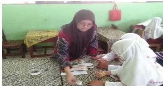
Gambar 4.26 Guru membimbing dan membantu siswa yang masih kesulitan dalam pembuatan plifbook

Dalam memaparkan laporan hasil diskusi, guru membimbing siswa dan memberi kesempatan kepada siswa lain agar bisa memberikan tanggapan, sebelum akhirnya membuat kesimpulan bersama.