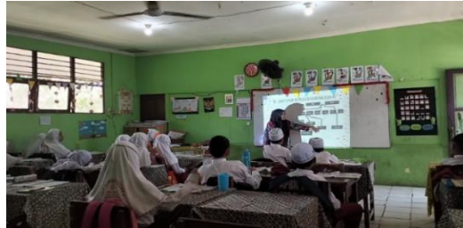
Gambar 4.14 Guru menjelaskan sistem kemasyarakatan suku Banjar (silsilah keluarga)