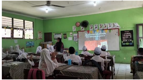
Gambar 4.10 Guru meminta seluruh siswa kelas IV ice breaking (tepek fokus)