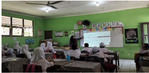
Gambar 4.21 Guru menjelaskan sistem peralatan hidup suku banjar