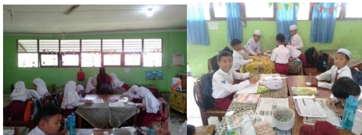
Gambar 4.23 seluruh siswa kelas IV membuat 4 kelompok kecil terdiri 1 kelompok ada 3 orang dan 4 orang.