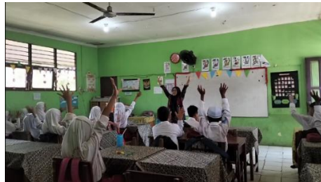
Gambar 4.1 Guru mengajak seluruh siswa ice breaking bersama agar suasana kelas menjadi akrab dan menyenangkan.

kabar mereka hari itu, dan meminta salah satu siswa untuk memimpin doa di depan kelas. 5