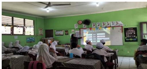
Gambar 4.12 Guru menjelaskan sistem religi suku banjar Kalimantan selatan.

di adakan setiap 1 tahun sekali pada bulan rajab, haul ini merupakan acara untuk memperingati wafatnya KH Muhammad Zaini Abdul Ghani, atau yang akarab disapa Abah Guru Sekumpul. Baayun (bayi baayun menggunakan kain kuning), maulut/ Maulid nabi memperingati kelahiran Nabi Muhammad SAW yang biasanya diadakan setiap 1 tahun sekali pada bulan rabiul awal. Basunat, baarwah (orang meninggal), bapara (tradisi adat perkawinan masyarakat suku Banjar yang berarti meminang atau melamar) dan sasarahan (acara pernikahan). Yang keempat komunikasi keagamaan yaitu melalui madihin dan balamut.