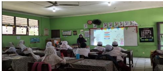
Gambar 4.20 Sistem mata pencaharian suku banjar

Mata pencaharian ini mencerminkan keberagaman aktivitas ekonomi masyarakat suku banjar yang beradaptasi dengan lingkungan sekitar, serta menunjukkan keterampilan dan tradisi yang telah diwariskan secara turun menurun.