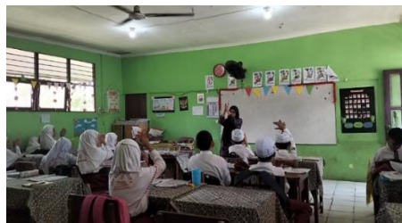
Gambar 4.6 Guru dan seluruh siswa kelas IV melakukan ice breaking dan memberikan motivasi untuk semangat belajar.