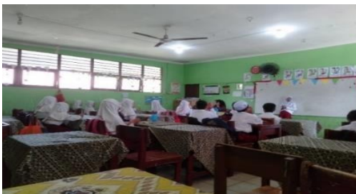
Gambar 4.31 Guru meminta salah satu siswa untuk memimpin doa setelah belajar sebagai ungkapan rasa syukur dan penutup kegiatan belajar.