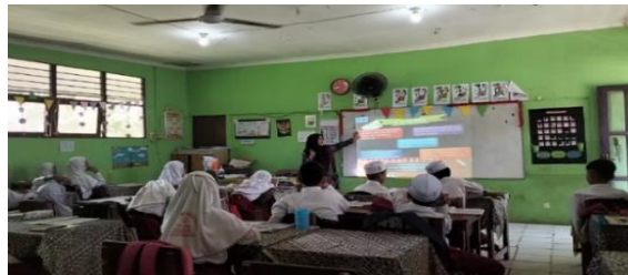
Gambar 4.18 Guru menjelaskan sistem kesenian suku banjar

(6) Musik suku banjar adalah salung ulin, kateng kupak, kintunglit, suling bambo, karung-karung panting, musik tiup, kuriding, bumbung,