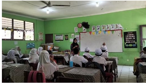
Gambar 4.7 Guru melakukan tanya jawab kepada seluruh siswa mengenai materi yang telah dipelajari.