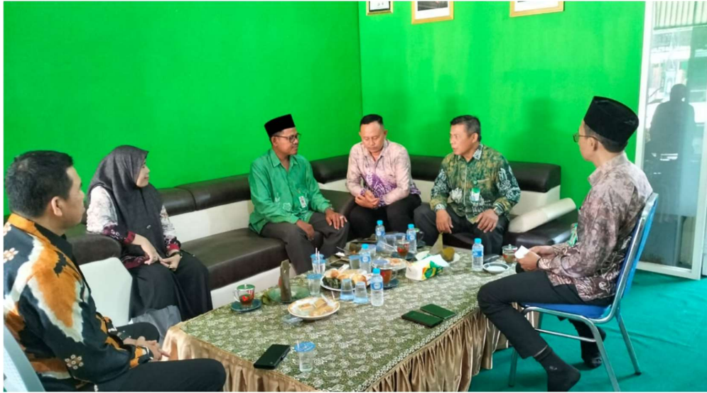
Wawancara dengan Pengawas Madrasah