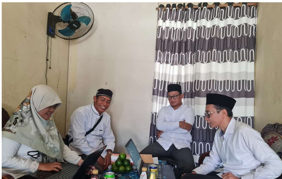
Wawancara dengan Guru Madrasah