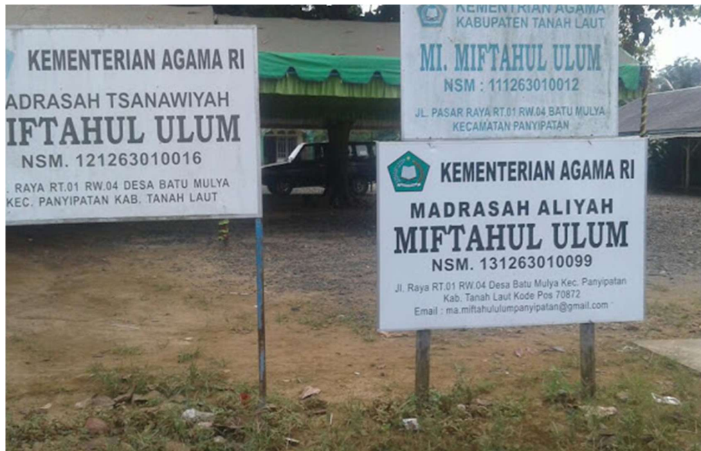
MA MIFTAHUL ULUM PANYIPATAN