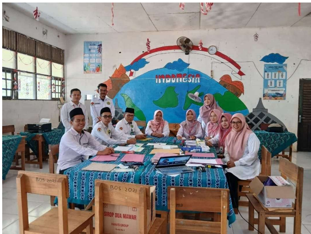
Wawancara dengan Guru MAN Tanah Laut