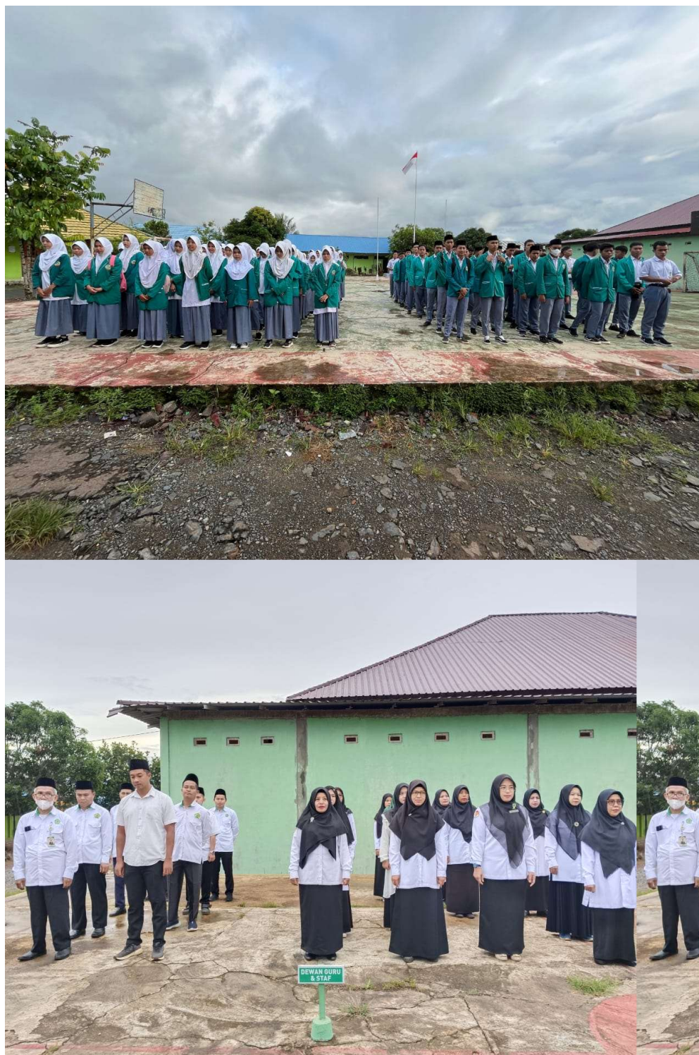
MAN TANAH LAUT