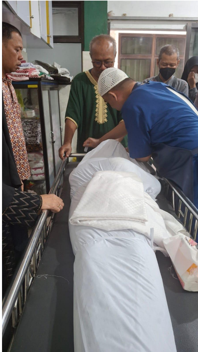
Pelatihan Penyelenggaraan Jenazah Masjid Al Jihad Banjarmasin