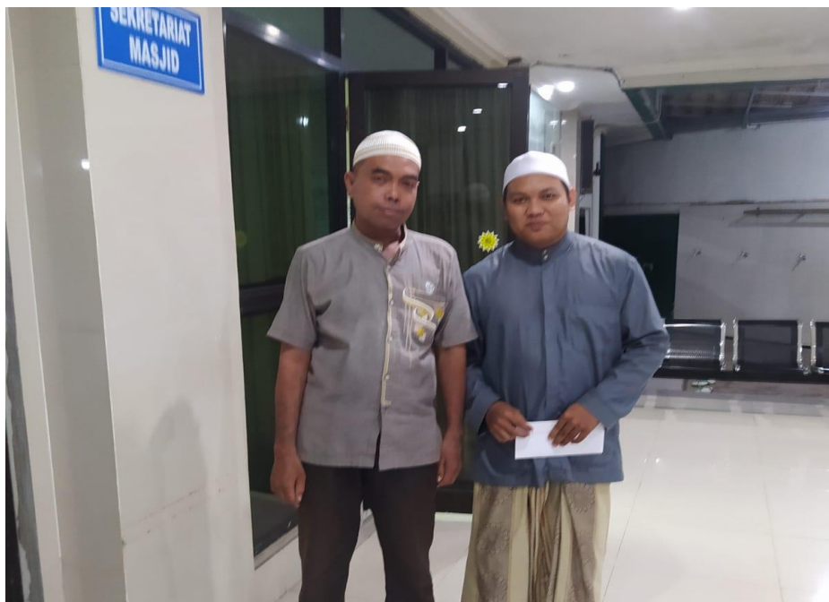
Wawancara Dengan Jamaah Masjid Al Jihad Banjarmasin