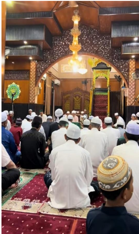
Majelis Taklim Masjid Jami Sungai Jingah