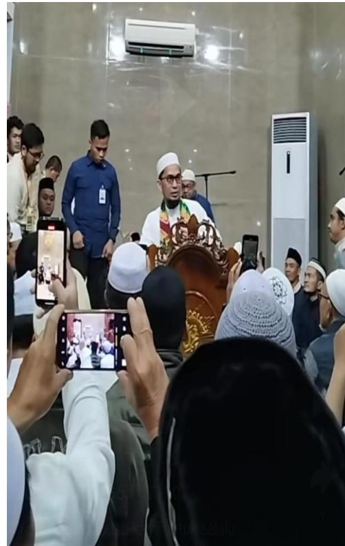
Majelis Taklim Bulanan Masjid Al Jihad Banjarmasin