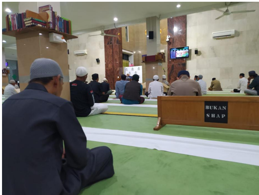
Majelis Rutinan Masjid Al-Jihad