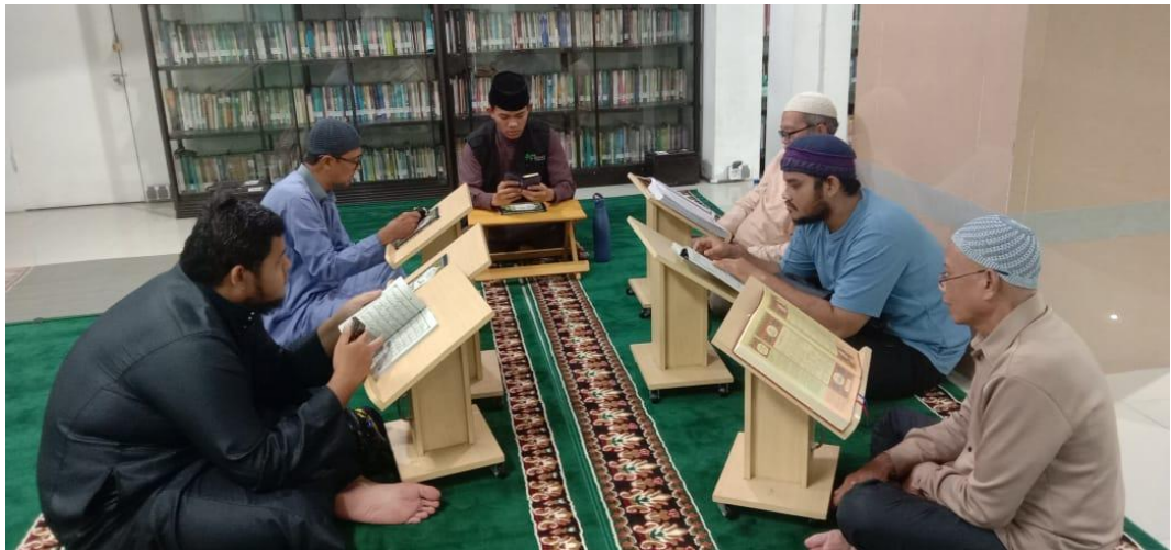
Pembelajaran Tahsin Al Qur'an Di Masjid Al Jihad Banjarmasin