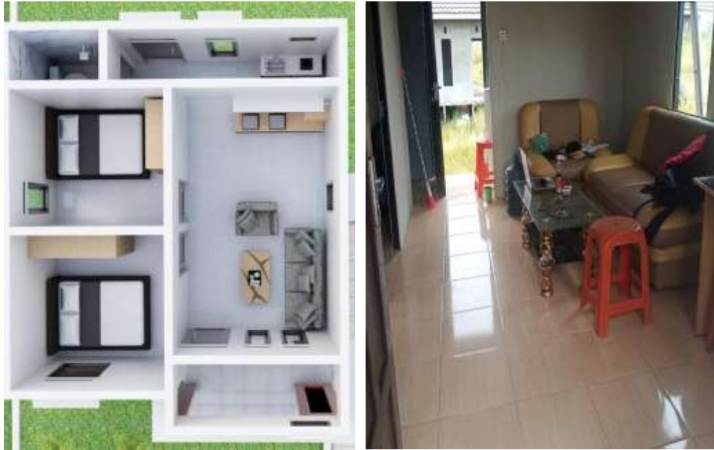
Gambar 3. 1 Denah Ruang dan Kondisi Ruangan Perumahan Syariah Indonesia Ajon 304

(Denah ruang Perumahan Syariah Indonesia Ajon)