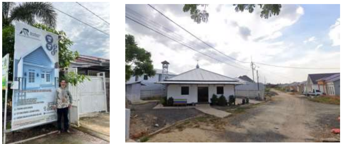
Gambar 3. 11 Masjid dan Tampilan Luar Perumahan Raudhatul Muhibbin 316

Meskipun demikian, Perumahan Raudhatul Muhibbin memiliki beberapa keunggulan tersendiri. Pertama-tama, kehadiran fasilitas keagamaan di dalam perumahan menjadi sorotan utama adalah Masjid yang berdiri kokoh di pusat kompleks, menjadi pusat kegiatan keagamaan bagi penduduk sekitar. Selain itu, tersedia pula musholla yang memberikan kemudahan bagi penduduk yang tinggal di sana untuk menjalankan ibadah sehari-hari.