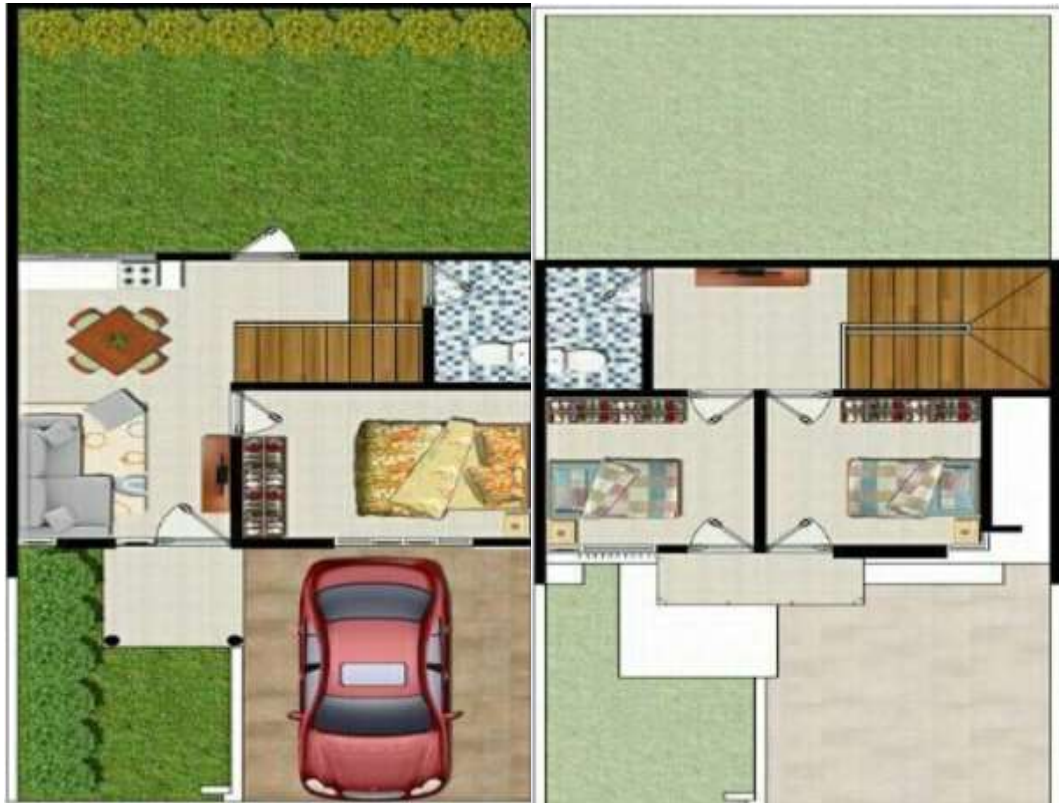
(Denah Lantai 1)