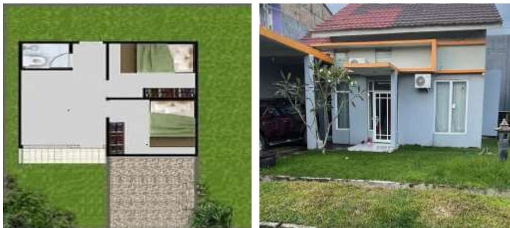
Gambar 3. 16 Denah Ruang dan Tampilan Luar Rumah KCG 323