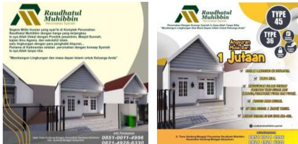
Gambar 3. 10 Brosur Perumahan Raudhatul Muhibbin 315

Meskipun demikian, Perumahan Raudhatul Muhibbin memiliki beberapa keunggulan tersendiri. Pertama-tama, kehadiran fasilitas keagamaan di dalam perumahan menjadi sorotan utama adalah Masjid yang berdiri kokoh di pusat kompleks, menjadi pusat kegiatan keagamaan bagi penduduk sekitar. Selain itu, tersedia pula musholla yang memberikan kemudahan bagi penduduk yang tinggal di sana untuk menjalankan ibadah sehari-hari.