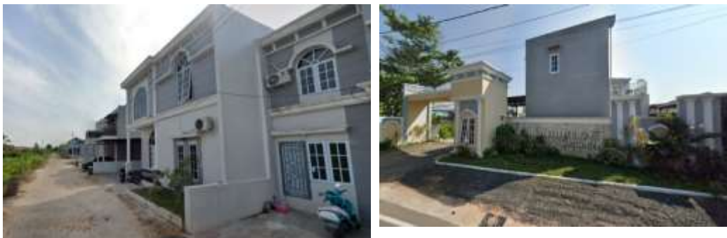
Gambar 3. 5 Tampilan Luar Al Mumtaz Residence Hikmah Banua 309

Salah satu temuan utama adalah bahwa Al Mumtaz Residence Hikmah Banua memang memiliki kualitas sebagai perumahan elite.