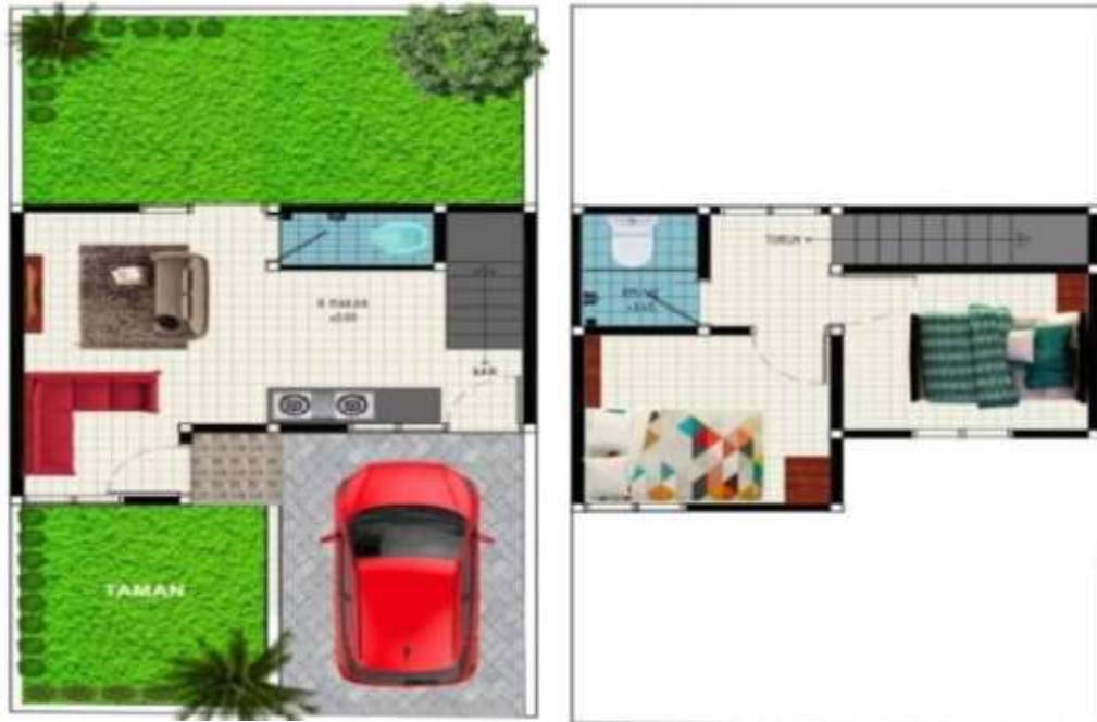
(Denah Lantai 1)