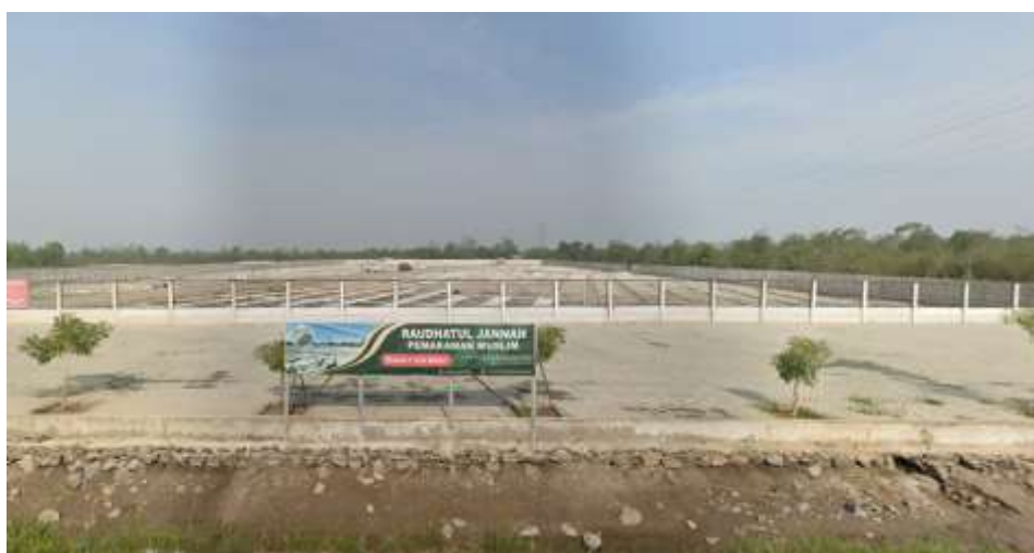
Gambar 3. 13 Alkah Perumahan Raudhatul Muhibbin 318

Selain fasilitas keagamaan dan sosial, perumahan Raudhatul Muhibbin juga memperhatikan kebutuhan akhirat dengan adanya menyediakan pemakaman bernama Alkah Raudhatul Jannah beralamat di Landasan Ulin Sel., Kec. Liang Anggang, Kota Banjar Baru, Kalimantan Selatan.