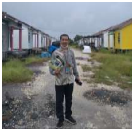
Gambar 3. 3 Kondisi Jalan dan Lingkungan Perumahan Syariah Indonesia Ajon 306

Awalnya, Perumahan Syariah Indonesia Ajon di Semangat Dalam, Kalimantan Selatan, diharapkan menjadi lambang konsep perumahan berbasis syariah yang berkembang di daerah tersebut. Namun, seiring berjalannya waktu, terjadi stagnasi dalam perkembangan pembangunan yang diharapkan.