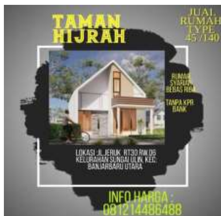
Gambar 3. 9 Brosur dan Tampilan Luar Taman Hijrah Banjarbaru 314

Baru, Kalimantan Selatan adalah salah satu perumahan berkonsep syariah yang diharapkan memberikan lingkungan yang nyaman dan sesuai dengan prinsip-prinsip syariah.