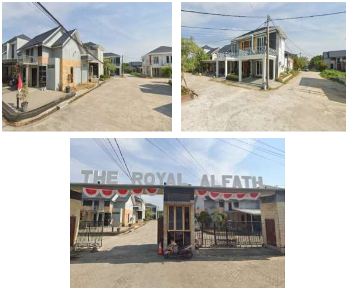
Gambar 3. 8 Tampilan Luar The Royal AlFath Residence 313

Namun, dalam penelitian ini, ditemukan kekurangan yang signifikan dalam hal fasilitas keagamaan. Tidak ada fasilitas seperti musholla atau tempat ibadah lainnya di dalam kompleks perumahan ini. Hal ini menjadi hambatan bagi penduduk yang ingin menjalankan ibadah dengan nyaman dan praktis tanpa harus meninggalkan perumahan.