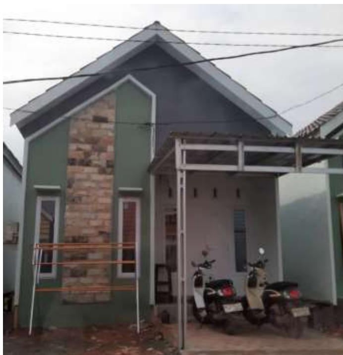
Gambar 3. 15 Brosur Perumahan Syariah Mahantas Modern Land 320

Kelebihan yang terdapat Perumahan Syariah Mahantas Modern Land diantaranya akses jalan yang telah menggunakan cor beton sehingga terbilang cukup baik, fasilitas air dan listrik yang sesuai standar, adanya pos keamanan, dan kondisi perumahan yang terbilang cukup bersih. Selain itu, akad yang digunakan juga menggunakan akad yang sesuai dengan prinsip syariah, yakni murabahah maupun salam dengan bekerja sama dengan Bank BTN Syariah.