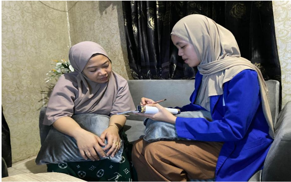
Gambar 4.4 Foto wawancara dengan Ibu L