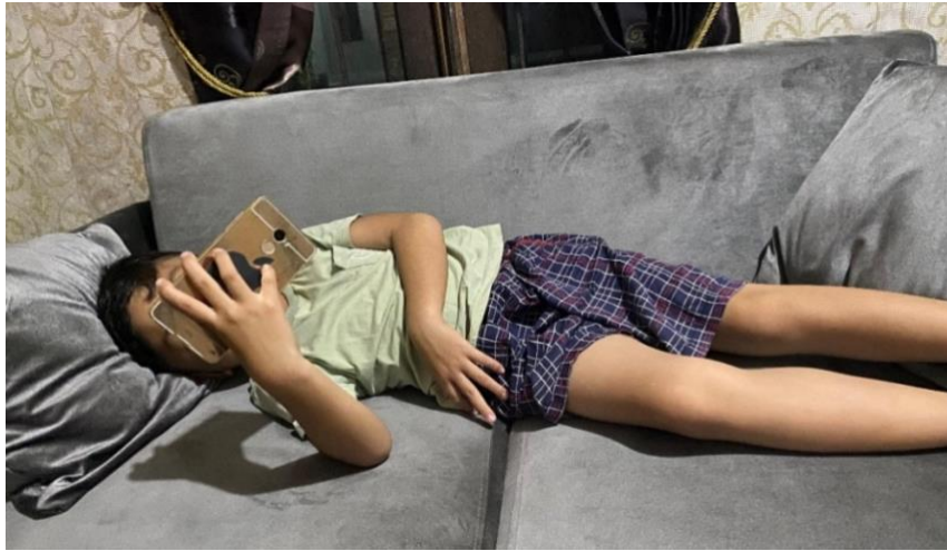
Gambar 4.14 Aktivitas H bermain handphone sebelum tidur

Pagi harinya H bangun kurang lebih sekitar pukul 08.00, H bangun tidur langsung mencari handphone nya dan memainkannya kembali dengan rentang waktu 1 jam lebih diatas tempat tidur. Pada pukul 10.20 H makan bareng keluarganya, Ayah F, Ibu L dan Kakaknya. H juga sering tidak mandi dipagi hari, padahal Ibu L sudah menyuruhnya, tetapi H nya yang tidak mau, kadang sampai seharian tidak mandi karena juga libur di rumah aja tidak kemana-mana.