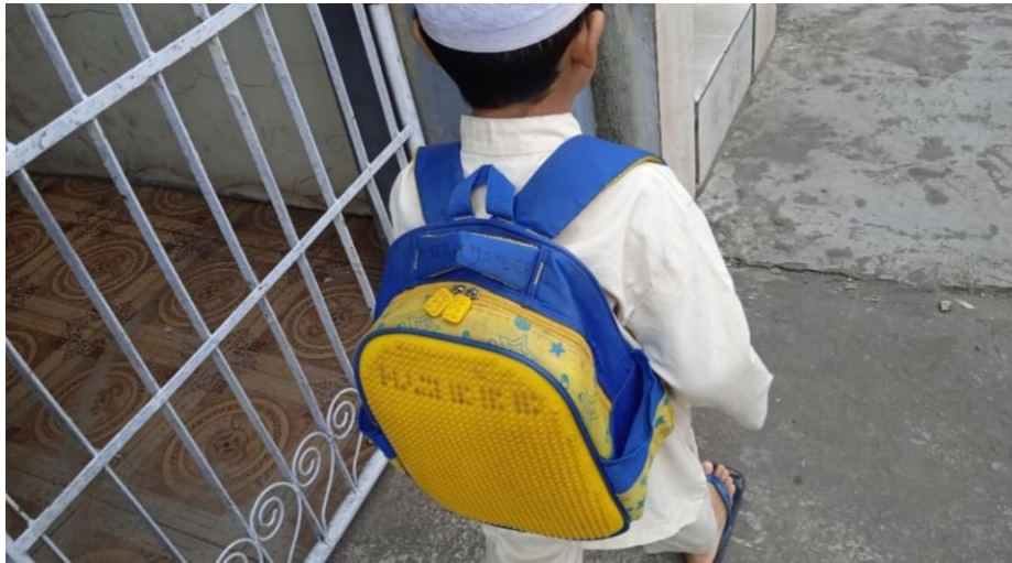
Gambar 4.8 Aktivitas H pergi sekolah TK Al-Qur'an

memasang sendiri baju dan celana sekolah tanpa dibantu sama kakek dan neneknya. H juga bersekolah mengaji dekat sekali dengan rumah neneknya, sekitar kurang lebih 100 meter. Jadi H pergi sekolah sendiri berjalan kaki begitupun pulang sekolah.