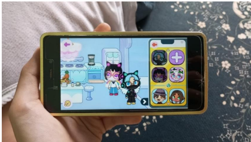
Gambar 4.17 Aplikasi Game Avatar World