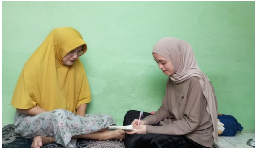
Gambar 4.5 Foto Wawancara dengan Nenek H

berikut hasil wawancara dengan Nenek disertai dengan dokumentasi.