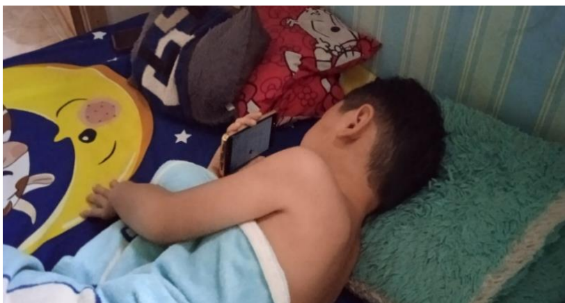
Gambar 4.15 Aktivitas H bermain handphone bangun tidur

Pagi harinya H bangun kurang lebih sekitar pukul 08.00, H bangun tidur langsung mencari handphone nya dan memainkannya kembali dengan rentang waktu 1 jam lebih diatas tempat tidur. Pada pukul 10.20 H makan bareng keluarganya, Ayah F, Ibu L dan Kakaknya. H juga sering tidak mandi dipagi hari, padahal Ibu L sudah menyuruhnya, tetapi H nya yang tidak mau, kadang sampai seharian tidak mandi karena juga libur di rumah aja tidak kemana-mana.