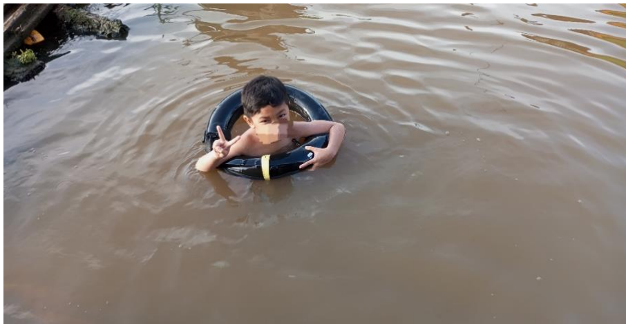
Gambar 4.10 Aktivitas H mandi ke sungai bersama kakek

Sembari menunggu Ayah F atau Ibu L menjemput H, biasanya berteman dengan tetangga sebelah, biasanya temannya yang ke rumah atau H yang mendatangi sebelah untuk bermain bersama. Mereka biasanya melakukan aktivitas menonton bareng, atau bermain kejar-kejaran di halaman rumah.