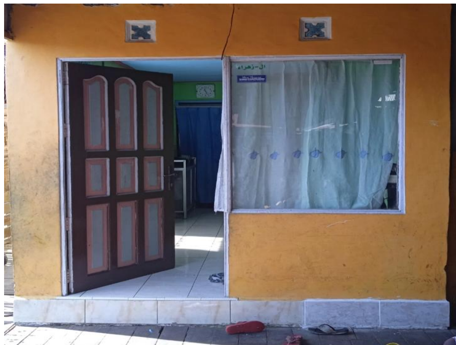
Gambar 4.3 Rumah Kakek dan Nenek