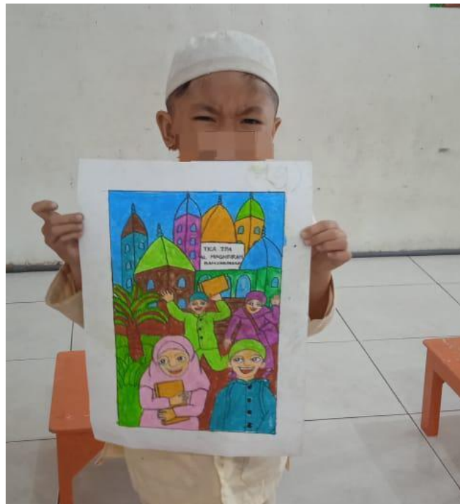
Gambar 4.19 H Juara Harapan II Lomba Mewarnai Seluruh TK Al-Quran di Banjarmasin Selatan

Gambar diatas salah satu hasil mewarnai H di sekolah TK Al-Quran, dengan peserta seluruh TK Al-Quran di Banjarmasin Selatan. H meraih juara harapan II.