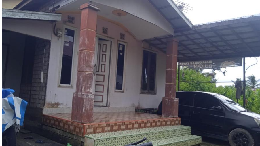
Gambar 4.2 Rumah Keluarga Ayah F dan Ibu