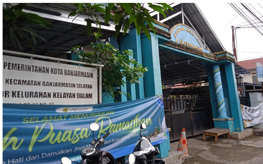
Gambar 4.1 Kelurahan Kelayan Dalam Banjarmasin Selatan

Sebelum peneliti menyajikan data tentang Pola Asuh Orang tua yang Sibuk Bekerja Terhadap Kebiasaan Anak Usia Dini Menggunakan Gawai Pribadi (Studi Kasus Terhadap Keluarga di Kelurahan Kelayan Dalam Banjarmasin Selatan), terlebih dahulu peneliti memberikan gambaran umum tentang lokasi penelitian sebagai berikut.