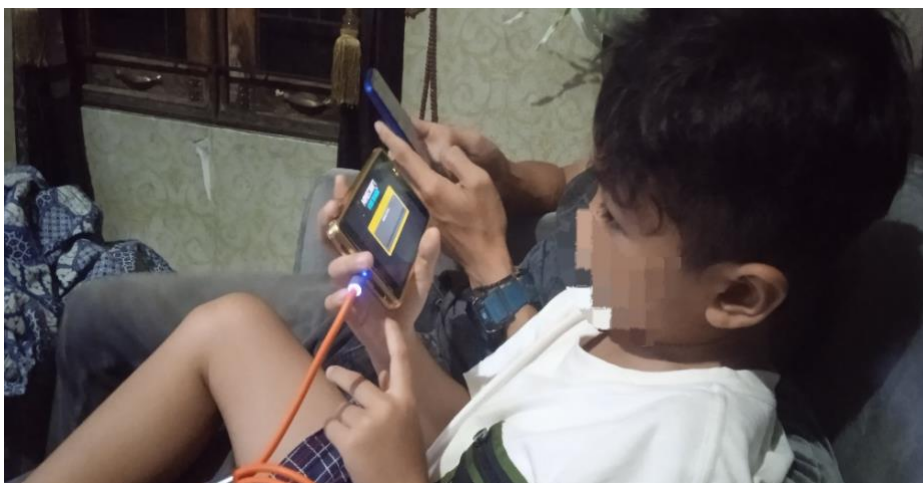
Gambar 4.12 Aktivitas H bermain handphone

Berdasarkan hasil observasi mengenai aktivitas keseharian yang dilakukan di rumah kakek dan nenek setiap hari weekdays , maka ini dilanjutkan aktivitas H di rumahnya di hari libur weekend bersama orang tuanya Minggu, 22 Desember 2024 kemudian disekitar pukul 20.00, H melanjutkan bermain handphone bersama ayahnya alias Ayah F, sambil menggunakan charghe .