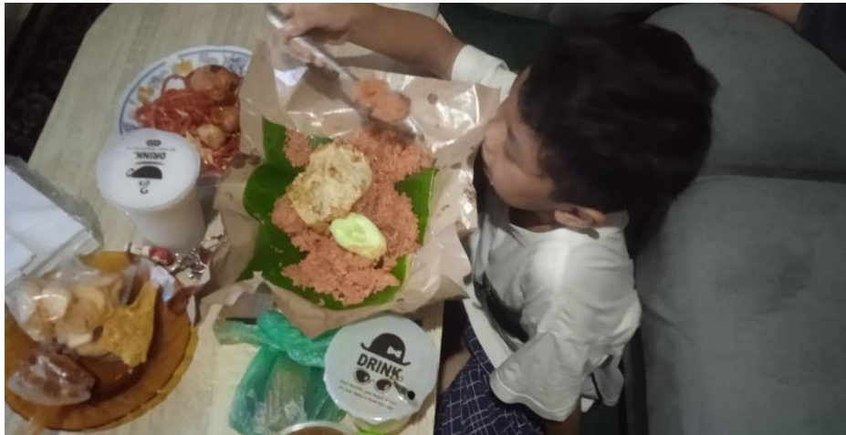
Gambar 4.13 Aktivitas H makan malam bersama orang tua

Kemudian kurang lebih pukul 20.30 an, 30 menit H bermain handphone dilanjutkan makan malam bersama Ayah dan Ibunya, adik H makan dengan nasi goreng yang dibelikan sama bundanya alias Ibu L.