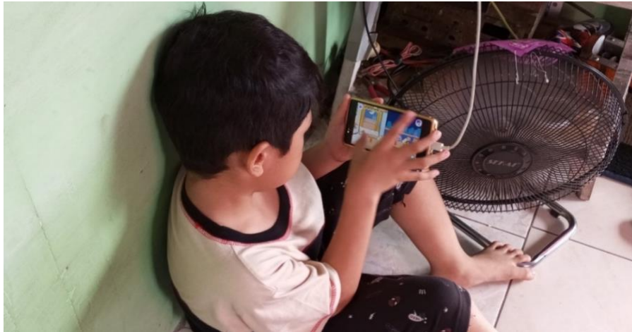
Gambar 4.9 Aktivitas H bermain handphone pulang sekolah TK Al-Qur'an