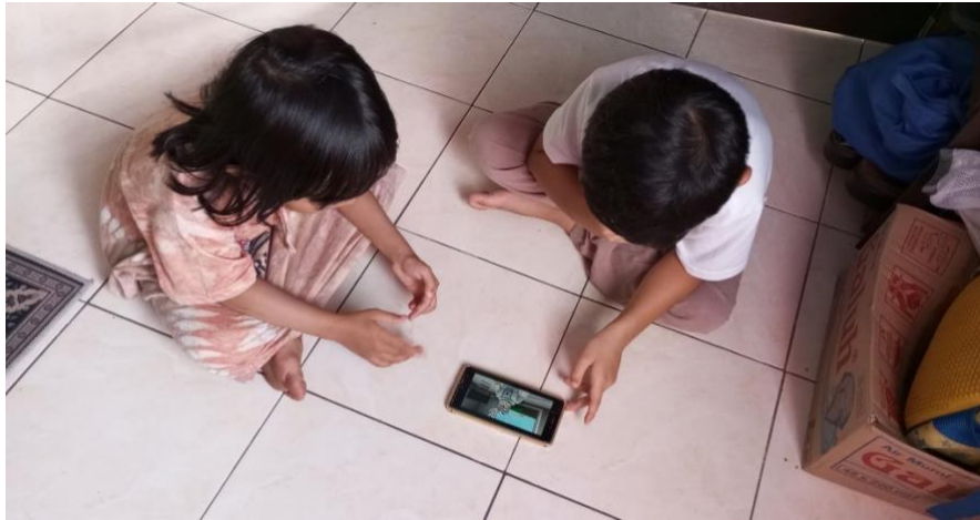
Gambar 4.11 Aktivitas H berteman dengan teman sebayanya

Berdasarkan hasil observasi mengenai aktivitas keseharian yang dilakukan di rumah kakek dan nenek setiap hari weekdays , maka ini dilanjutkan aktivitas H di rumahnya di hari libur weekend bersama orang tuanya Minggu, 22 Desember 2024 kemudian disekitar pukul 20.00, H melanjutkan bermain handphone bersama ayahnya alias Ayah F, sambil menggunakan charghe .