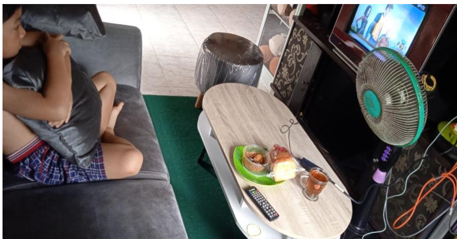
Gambar 4.16 Aktivitas H sedang menonton televisi

Siang sampai ke sore hari H biasanya menghabiskan waktunya menonton televisi hingga ketiduran, sembari menunggu handphone nya sedang di charghe , ayah H alias Ayah F menghabiskan waktunya beristirahat di dalam kamar, dan Ibu L menyelesaikan pekerjaan rumah yang lainnya.