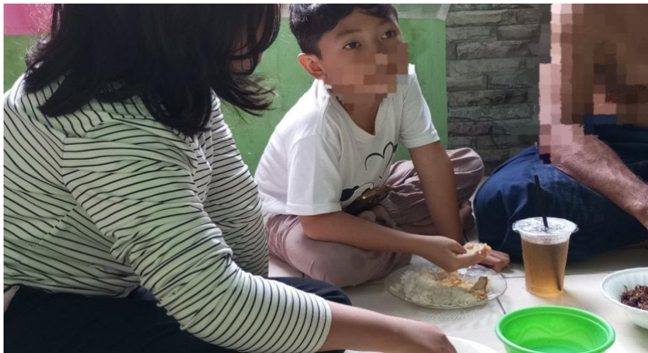
Gambar 4.7 Aktivitas H makan bersama kakek dan nenek

Setelah itu nenek menyuruh untuk makan siang bersama kakek, nenek dan juga kakaknya, H sudah terbiasa dengan rutinitas ini di waktu weekdays , kadang lebih sering H makan siang bersama kakek dan nenek saja bertiga.