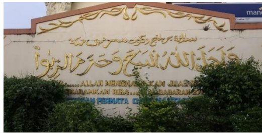
صورة في ساحة المركز التجاري CBS

ثانيا، ثنائية اللغة من نوع الإرشادات والإعلانات على المشاهد اللغوية توجد بلغتين اللغة العربية مع اللغة الإندونيسية. توجد في لوحة حول ساحة Cahaya Bumi Selamat قبل أن يدخل إلى سوقها بآية من القرآن الكريم في سورة البقرة ٢٧٥ "وَأَحَلَّ اللَّهُ الْبَيْعَ وَحَرَّمَ الرِّبَا" وتكتب في اللوحة من معناه باللغة الإندونيسية، كما في الصورة التالية: