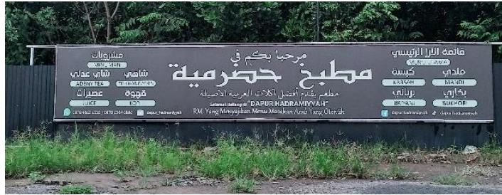
صورة مطعم مطبخ حضرمية

وأما مطعم باسم "مطبخ حضرمية" يقع في إيندراساري سكومفول، لم تلتق الباحثة بصاحب المطعم نظرًا لانشغاله بأنشطة أخرى خارج المطعم، حيث لا يأتي إلا في أوقات محددة للإشراف