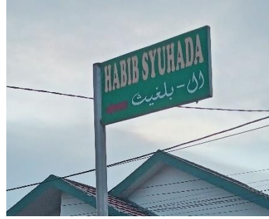
صورة اسم الشارع آل بلغيث

العربية. تتميز هذه اللوحات بكونها ثنائية اللغة، حيث تجتمع فيها العربية والإندونيسية. فبعضها يجمع بين الكلمتين، مثل "آل بلغيث HABIB SYUHADA"، وبعضها تكتب الكلمة العربية أولاً ثم الكلمة المماثلة لها، مثل "محبة MAHABBAH". كما توجد لوحات مكتوبة بالحروف الجاوية، مثل "جلان إناية JL.INAYAH" و"غغ السلام GG.ASALAM" و"غغ الكرمة GG.AL-KAROMAH". صُنعت هذه اللوحات من مواد مختلفة مثل المعدن والخشب، وكُتبت بخط النسخ بشكل عام، باستثناء لوحة "آل بلغيث" التي استخدم فيها الخط الديواني.