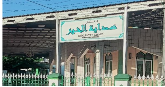
صورة لغكر فاستبقوا الخيرات

العديد من الأنشطة الدينية والاجتماعية، كحلقات تحفيظ القرآن ومجالس الذكر. وفي بعض الحالات، تستخدم "لغكر" كمركز تعليمي. يرجع تنوع استخدام "لغكر" إلى عدم وجود قيود صارمة على الأنشطة التي يمكن إجراؤها فيها، بخلاف المساجد التي تكون مخصصة بشكل أساسي للعبادة.