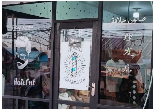
صورة متعددة اللغات صالون الحلاقة

تُظهر المشهد اللغوي لمحل صالون حلاقة للرجالية يقع في شارع فانديديكن، سكومفول، تنوعًا لغويًا في لوحة المحل. اللوحة مُلصقة على زجاج الدكان وتستخدم لغات متعددة، حيث تقارن بين اللغة العربية لكلمة "صالون حلاقة" مع اللغة الإندونيسية PANGKAS RAMBUT والإنجليزية HAIR CUT والصينية 理发店 وتذكر اسم المخلطة اللغة الإندونيسية والإنجليزية KUMIS BARBERSHOP. هذا التنوع اللغوي يمثل مزيجًا فريدًا من المشاهد اللغوية الموجودة في مدينة مرتافورا، حيث تحتوي اللوحة على أربع لغات مختلفة. لكن ما يبعث على الأسف هو أن هذا الصالون قد انتقل إلى مالك جديد. ورغم ذلك، لا يزال المالك الحالي يحافظ على التصميم الداخلي واللوحات الموجودة، رغم أنه لا يعرف معنى أو كيفية قراءة ما هو مكتوب على اللوحة المرفقة بالصالون. ٦٣