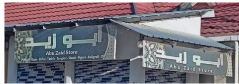
صورة متعددة اللغات الدكان أبو زيد