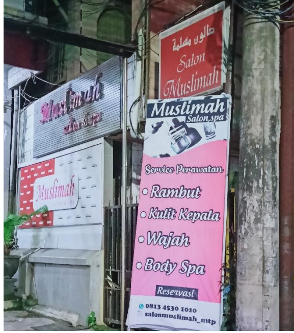
صورة متعددة اللغات صالون مسلمة

وأما لوحة صالون مسلمة من المشهد اللغوي متعددة اللغات في أسماء المحلات التجارية للخدمات بثلاثة أنواع اللغة يعني باللغة العربية في اسم المحل "صالون مسلمة" ومكافئها باللغة الإندونيسية SALON MUSLIMAH والإنجليزية MUSLIMAH SALON & SPA ومادة اللوحة مصنوعة من المعدن والفينيل. ويظهر من اسمه أن الصالون يخدم لخدمة النساء وخاصة للمسلمة. صالون مسلمة هو المكان الذي يمكن فيه للنساء العناية بأنفسهن بشكل كامل، حيث يتوفر كل ما يتعلق بالعناية بالجسم من الرأس إلى أخمص القدمين. بالإضافة إلى كونه مكاناً مريحاً للاسترخاء من خلال جلسات التدليك في المنتجع الصحي والخدمات الأخرى. بالنسبة للنساء، يعد العناية بالجسم والحفاظ على جمال وصحة البشرة أمراً ضرورياً. وبصرف النظر عن ذلك، يمكن أن تساعد علاجات الصالون والسبا في تنشيط العقل والجسم بعد يوم طويل من الأنشطة. لكن من المهم جداً ليس فقط العناية بالجسم، بل أيضاً اختيار مكان مريح وآمن، خاصة للنساء المسلمات اللاتي يحتجن إلى مكان خاص للعناية.