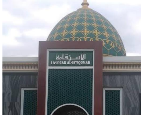
صورة مصلى الاستقامة

ووجدت الباحثة الخطأ في الكتابة لاسم مسجد بنى الاهل ومسجد محمد على. للنص "بنى الاهل" في الكتابة التي تحتاج إلى تحليل، لا سيما في استخدام كلمة "بنى" بدون نقطتين أدناه وكلمة "اهل" بدون همزة القطع. كان المفروض لكلمة "بنى" باستخدام حرف الياء بنقطتين تحتها لأن حرف الياء هي الياء النسبة التي تدل على علاقة الملكية أو أصل الشيء أو صفة الطبيعية، وفي كلمة بنى نسبة الياء أكثرها تدل على العلاقة بين الأبناء وأبيهم، ومع ذلك في سياق أسماء الأماكن أو أسماء العائلة، كما هو الحال في اسم هذا المسجد، غالبًا استخدام "بنى" تشير إلى الأصول أو هوية الملكية. في الكتابة العربية الصحيحة، يجب أن تكتب الياء النسبة في كلمة بنى بنقطتين أدناها، وهذه قاعدة ثابتة في قواعد اللغة العربية. وكلمة "الاهل" بدون همزة القطع تجعل الكلمة بالمعنى الآخر، و همزة القطع هي أحد حروف اللغة العربية الذي يعمل على الفصل بين حرفين متحركين متطابقين قد يكون عدم وجود همزة القطع في كلمة "اهل" بسبب عوامل اللهجة المحلية لأن في بعض اللهجات العربية، قد يكون استخدام همزة القطع غير متناسق أو حتى محذوف في كلمات معينة أو الكتابة القصيرة في صناعة اللوحة من الممكن أن يكون هذا الاسم قد كتب بشكل مختصر أو غير رسمي، فحذف الكاتب همزة القطع لتسريع الكتابة. وللنص "مسجد محمد على" كلمة "على" بدون نقطتين أدناها في حرف