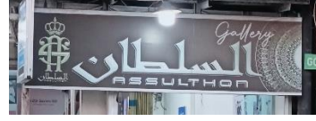
صورة لوحة دكان العطور باسم السلطان بلغتين العربية والإنجليزية

ومن الأمثلة على استخدام اللغتين العربية والإنجليزية معًا على لوحة أسماء الدكاكين، هناك