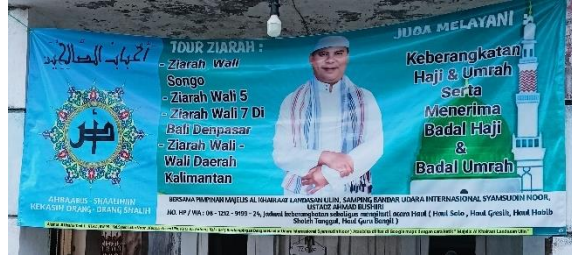
صورة مكتب وكالة سفر للزيارة

في الصورة السابقة، تظهر لوحة مكتب وكالة سفر للزيارة في كليمنتان وما حولها، مكتوبة بشائبة اللغة. تُعرض الكتابة باللغة العربية مع ترجمتها باللاتينية، بالإضافة إلى الترجمة باللغة الإندونيسية. الاسم المعروف على اللوحة هو "أحباب الصالحين" AHBAABUS SHAALIHIN, KEKASIH ORANG-ORANG SHALIH ويكتب أيضا الحرف الأول من اسم أحباب الصالحين بأيقونة "أ" و"ص" في اللوحة، ونص الكلمة العربية يكتب بالخط الكوفي. وعرض صورة الأستاذ من رئيس المجلس معين. يرتبط اسم 'أحباب الصالحين' ارتباطاً وثيقاً بالجوانب الاجتماعية لشعب مرتافورا، الذين يكونون احتراماً شديداً وحباً للصالحين والأولياء. يمكن ملاحظة ذلك من خلال زيارتهم المتكررة إلى مناطق مختلفة في كليمنتان وخارجها، وحتى إلى دول أخرى، لزيارة أولياء الله والصالحين، سواء كانوا قد توقوا أو لا يزالون على قيد الحياة. تهدف اللوحة إلى جذب انتباه المستهلكين من خلال تقديم معلومات عن خدمات السفر للزيارة في كليمنتان وخارجها، بما في ذلك الحج والعمرة. تستخدم الوكالة، 'أحباب الصالحين'، اللوحة كأداة دعائية لتشجيع الناس على الانضمام إلى رحلات الزيارة عبر خدماتهم.