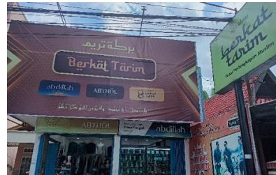
صورة لوحة الدكان بركة تريم

تحت اسم الدكان في اللوحة بخط الكوفي وحجمه أصغر قليلا من كتابة بركة تريم لاسم الدكان.