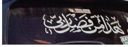
صورة نوع الملصقات على المركبات

في هذه الصورة تكتب بحجم كبير بخط الثلث الكلمة: "هذا من فضل ربي" مقتطفات الآية من سورة النحل: ٤٠. وبهذا المشهد المعروضة صاحب السيارة يعمل ما في الآية أن جميع النعم التي يملكها بما في ذلك السيارة هي هبة ونعمة من الله. وهذا شكل من أشكال الاعتراف بوجود الله والشكر على نعمه. وبدوافع روحية يمكن أن تكون هذه الآية بمثابة تذكير لأصحاب السيارات بأن يكونوا دائماً شاكرين وألا يتكبروا. وهذه الآية هي رسالة إلى الآخرين الذين يرون السيارة، ويمكن أن تكون هذه الرسالة بمثابة دعوة للإيمان والامتنان ومشاركة القيم الإيجابية.