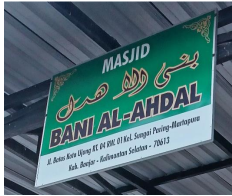
صورة مسجد بني الاهدل

في الصورة للمسجد "بني الاهدل" كلمة المسجد باللغة الإندونيسية واسم المسجد باللغة العربية بخط الديواني وتحتته الكلمة المماثلة للغة العربية باللغة الإندونيسية مع بيان الموقع، و في "مصلى دعوة الحق" كتبت كذلك ولكن بخط الثلث مع ذكر كلمة مصلى باللغة العربية، هذا ما يعرض لكثير من أسماء المساجد والمصليات في شكل ثنائية اللغة، وأحيانا تكتب في لوحة الاسم باللغة العربية ومماثلتها باللغة الإندونيسية بدون ذكر بيان الموقع كما في "لغكر الإستقامة"، أو فقط يكتب الاسم باللغة العربية بدون معناها المكافئ باللغة الإندونيسية لكن يذكر بيان الموقع كما في "مصلى دار المهتدين".