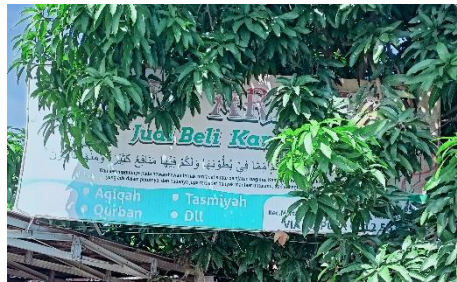
صورة لوحة الدكان العربية لبيع المعازر