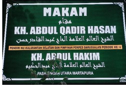
صورة لوحة المقام