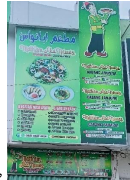
صورة متعددة اللغات مطعم أبا نواس

ومن البيانات متعددة اللغات في أسماء المحلات التجارية للمطعم وجدت الباحثة محلاً واحداً باستخدام اللغة العربية والإندونيسية والإنجليزية.