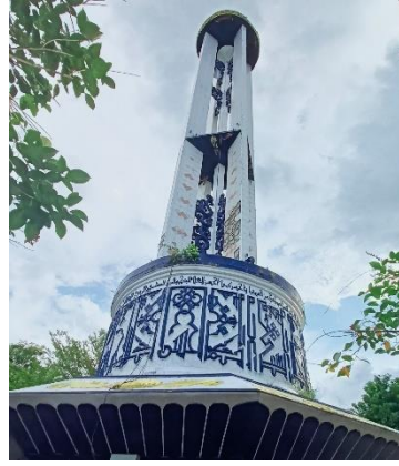
صورة أعمدة الساحة سورة القصص: ٧٧

وأعمدة أخرى توجد في ساحة الفاتحة وهي أعمدة الرئيسية فيها: