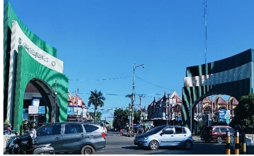
صورة بوابة سكومفول

وتوجد أيضا في ضمن هذا النوع بشكل أحادية اللغة بوابة الترحيب في مدخل شارع سكومفول بثلاث بوابات مع نفس نقش الكتابة فيها "أهلا وسهلا بقدومكم" للتحية و الترحيب بالأشخاص الذين يأتون إلى مرتافورا وخصوصا سكومفول للزيارة أو السياحة في مرتافورا.