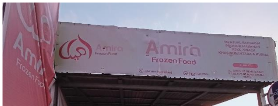
صورة متعددة اللغات الدكان اميرا