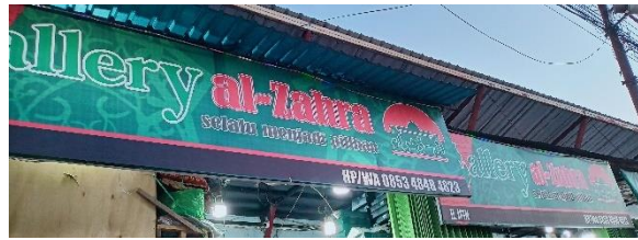
صورة متعددة اللغات الدكان ال زهراء

من بين البيانات التي جمعتها الباحثة حول المشاهد اللغوية العربية، وجدت ٤٦ لوحة تحمل أسماء محلات تجارية بشكل متعدد اللغات في مدينة مرتافورا. وقد ذكرت النصوص الكاملة للكلمة المكتوبة في الجدول ٤,٧ السابق فتذكر الباحثة في هذا الفقرة بالاسم اللغة العربية في اللوحة فقط، منها: الشاب، هداية، نجاح، آل زهراء، أميرا، عائشة حميرا، أبو زيد، الحج، يآبي والرفاني، ف، سلطان، آل محبوب، بركة عبايات. كان في أسماء متاجر الشاب، هداية، نجاح، آل زهراء، عائشة حميرا، الحج، يآبي والرفاني،سلطان، وآل محبوب، جميع المحلات المذكورة تقع في منطقة سكومفول في مرتافورا. تقوم هذه المحلات ببيع مجموعة متنوعة من العناصر التي تتضمن الملابس الرجالية والملابس النسائية للمسلمين، والإزار، وأدوات الصلاة للمسلمين والمسلمات. بالإضافة إلى ذلك، بعض المحلات تقدم أيضاً العطور والبخور. وكما نعلم سابقا، فإن معظم الأسماء المستخدمة للمحلات التجارية باللغة العربية يتم اختيارها من قبل أصحاب المحلات أنفسهم، سواء كانت مشتقة من اسم المالك، عائلته، كنيته، لقبه، أو قبيلته. كما قد تكون الأسماء مستوحاة من طبيعة السلع التي يتم بيعها أو من الرسائل التي يودون توصيلها، مثل الأمل والدعاء.