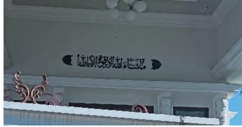
صورة لوحة ما يعرض في البيت ١

أما البيانات أحادية اللغة المشاهد اللغوية في مدينة مرتافورا على حالين ما يعرض في البيت وما يعرض في الحائط. أولاً، ما يعرض في البيت يعني أمامه الذي عند ما يمر الناس بالبيت قد يري على المشاهد اللغوية باستخدام اللغة العربية فيه، توجد بيتان اللذان يعرضان اللغة العربية أمام البيت في سكومفول، واحد منهما يكتب "ما شاء الله لا قوة إلا بالله" فيها كلمتان ليستا غريبتان عند المسلمين، كما في الصورة التالية :