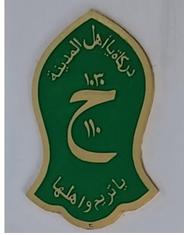
صورة لوحة ما يعرض في البيت ٢

وثاني منهما تكتب الكلمة "دركة يأهل المدينة ياترجم واهلها" ثم كتبت بعض الأرقام العربية على شكل نعل النبي المعروض أمام البيت، ومعنى الجملة تبين أنها صيغة الذكر والأوراد قدمها علماء من منطقة حضرموت في اليمن. والأمر الأكثر إثارة للاهتمام هو أن هذه الجملة التدريبية يتم الحصول عليها عن طريق الإجازة أو لعملية على ممارستها ويمكن أيضا من يتمسك به بدون الإجازة وفهم الغرض منه. فهنا تعبيرات الدينية على شكل كلمة الذكر ويعتبر دعائية لذكر الله وإظهار طلب المساعدة إلى الله. وكانت الكلمة أحيانا بالملصق قد توجد أيضا في البيت والسيارة وغيرها في الأماكن العامة في مدينة مرتافورا.