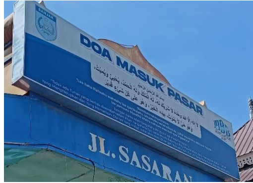
صورة البوابة في سوق Batuah

تذكر فيها الدعاء نقل الحديث عن رواية ابن ماجه "بِسْمِ اللَّهِ الرَّحْمَنِ الرَّحِيمِ لَا إِلَهَ إِلَّا اللَّهُ وَحْدَهُ لَا شَرِيكَ لَهُ لَهُ الْمُلْكُ وَلَهُ الْحَمْدُ يُحْيِي وَيُمِيتُ وَهُوَ حَيٌّ لَا يَمُوتُ بِيَدِهِ الْخَيْرُ كُلُّهُ وَهُوَ عَلَى كُلِّ شَيْءٍ قَدِيرٌ" تحت الدعاء المكتوب باللغة العربية، يتم كتابة النص أيضاً بالحروف اللاتينية، ثم تُذكر ترجمته ومعناه باللغة الإندونيسية. وعدد البوابات لهذا السوق ثلاث بوابات، وفي كل بوابة تعرض اللوحة التي تكتب فيها الدعاء المذكور. تعبر هذه اللوحة عن رسالة دعائية وتذكيرية تهدف إلى توجيه وإرشاد الناس بالأخلاق والآداب، حتى عند دخول السوق في المجتمع الحضري في مدينة مرتافورا. وهذا يتماشى مع الثقافة الدينية الإسلامية السائدة في المدينة.