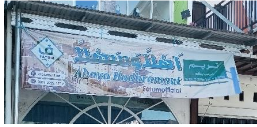
صورة متعددة اللغات الدكان بركة عبايات