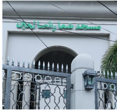
صورة مسجد شعار الصالحين