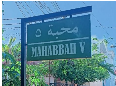
صورة اسم الشارع "محبة"

يشير اسم الشارع "آل بلغيث" إلى قبيلة عربية، مما يدل على أن هذه المنطقة تسكنها عائلات عربية. وتدل هذه اللوحة على وجود منزل ومجلس تعليم يملكه حبيب شهداء آل بلغيث. وبهذا يسهل على الناس تحديد مكان هذا المنزل والمجلس. وترمز على أن حبيب شهداء هو من المجتمع العربي ولو كان يسكن في غير مسكن المجتمع العربي في مرتافورا.