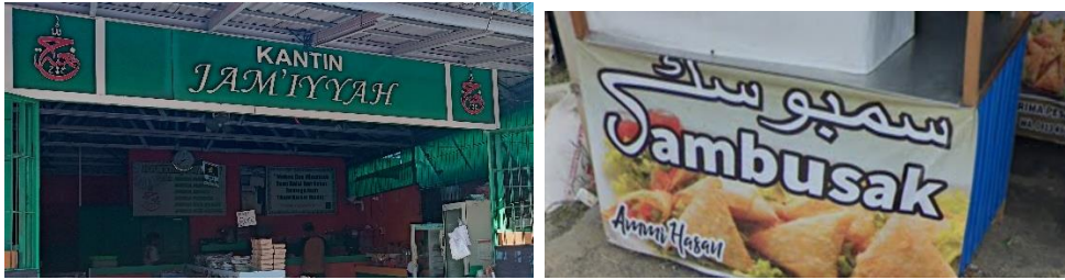
صورة الكشك جمعية

الثقافي في مرتافورا، والتفاعل بين مختلف المجتمعات. كما يعكس هذه الأسماء هوية المكان وتاريخه، ويؤكد على أهمية الحفاظ على التراث اللغوي والثقافي.