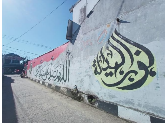
صورة ما يعرض على الحائط

في الصورة تكتب على الحائط كلمة "اللهم صل على سيدنا محمد" وكلمة "نور الهداية"، وكان الخط العربي مصنوعا بالطلاء الأسود على الحائط برسم راية إندونيسيا بلون الخلفية أحمر وأبيض لكلمة الصلوات وجانبها بلون الخلفية أصفر لكلمة نور الهداية، أولئك الذين فعلوا ذلك كانوا مبادرة أفكار إبداعية من أعضاء المجلس نور الهداية مع السكان المتحمسين في زقاق سدولور كراتون مرتافورا لتزيين بيئة الزقاق للاستعداد بيوم عيد الاستقلال الإندونيسي في سنتين ماضيين ولا تزال اللوحة موجودة حتى اليوم، وهذا نشاط إيجابي لشباب المجتمع، وكلمة نور الهداية التي مكتوبة جانبها من اسم مجلس التعليم عندهم. يتمتع من هذا المشهد بخلفية دينية قوية ويريدون ربط ما يتم عرضهم بالقيم الإسلامية والاجتماعية.