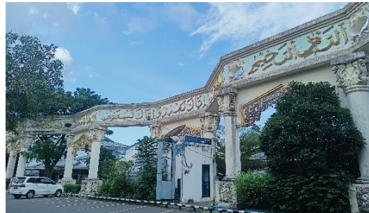
في الصورة: صورة المشهد اللغوي سورة الفاتحة

وكانت نقطة المركز أكثر ما يعرض النصب التذكارية في مدينة مرتافورا التي توجد في ساحة Cahaya Bumi Selamat وتوجد بها أحد مراكز تجارة الماس الشهيرة في مرتافورا وأن هناك كثيرة النصب التذكارية من الآثار المنقوشة بآيات من القرآن الكريم بفن الخط العربي، ويعرف كثير من الناس في مرتافورا مدعو باسم ساحة الفاتحة لأن موجودة كتابة سورة الفاتحة من أول الآية إلى آخرها، كما