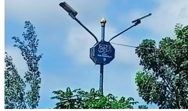
صورة لوحة الشعار أسماء الحسنی

ومن البيانات ثنائية اللغة المشاهد اللغوية في نوع غيرها باستخدام اللغة العربية مع ذكر مقارنتها ومعناها في اللوحة هي كلمة أسماء الحسنی الموجودة عن لوحة الشعار على طول الطريق أحمد ياني في وسط مدينة مرتافورا. وهنا صعوبة للحصول على صورة واضحة للوحة التي مكتوبة عليها أسماء الحسنی بسبب طولها مرتفع وموقعها في منتصف الطريق حيث تمر وسائل النقل دائما دون توقف، إذن ما يمكن التقاطها الباحثة من الصورة هي كما يلي: