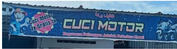
صورة مغسل تنظيف بركة

موقع الصالون، القريب من معهد دار السلام، قد أثر على اختيار الاسم ولغة الإعلان. يبدو أن صاحب الصالون يتأثر بشكل كبير بالطلاب من المعهد، ويجمع بين اللغة العربية والإنجليزية لجعل الاسم يبدو عصريًا وجذابًا للزوار، سواء من المقيمين في المنطقة أو الطلاب الذين يعيشون في محيط المعهد. كما يُلاحظ أن صاحب الصالون يفهم المعنى في اللغات المستخدمة على اللوحة، حيث تُذكر ساعات العمل باللغة الإنجليزية أيضًا. "وجدت الباحثة لوحة لكان مخلطة بين اللغة العربية والإندونيسية في منطقة فكاومن، حيث يحمل المكان اسم "تنظيف بركة CUCI MOTOR"، وهو مغسلة للدراجات النارية. أُجريت مقابلة مع بعض الموظفين في المكان، الذين لم يعرفوا سبب استخدام اللغة العربية في الاسم، ولم يكونوا متأكدين ما إذا كان صاحب المغسلة من أصل عربي أم أنه يستخدم المفردات العربية لجذب الزبائن في المنطقة. ومع ذلك، لاحظت الباحثة أن الموظفين يفهمون معنى كلمة "تنظيف"، وهي مأخوذة من الفعل "نظّف" الذي يعني عملية تطهير لإزالة الأوساخ. كما أن كلمة "بركة"، التي تُستخدم في السياق المحلي، تشير إلى الرجاء في الحصول على الخير والنعمة والسعادة من الله. ٦٢ وهذا مرتبط على ما ورد أدنى الاسم باللغة الإندونيسية أن رضا الزبائن هو أولويتنا، لتوفير الشعور بالثقة والمنفعة في الخدمات التي يقدمونها.