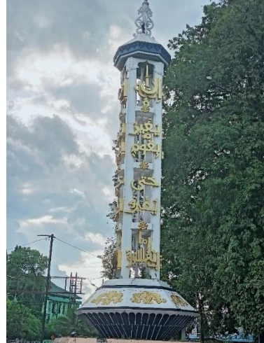
صورة لعمود من أعمدة الساحة سورة الرعد: ١١ صورة لعمود من أعمدة الساحة إن الله جميل يحب الجمال

في هذه الصورة تظهر الآيات المكتوبة على أعمدة الساحة من سورة الرعد في الآية ١١: {إِنَّ اللَّهَ لَا يُغَيِّرُ مَا بِقَوْمٍ حَتَّىٰ يُغَيِّرُوا مَا بِأَنْفُسِهِمْ}٦٤. تحتوي هذه الآية على رسالة دعوة الناس لتغيير أنفسهم من السلوكيات غير الجيدة إلى السلوكيات الصالحة، أي من الأخلاق المذمومة إلى الأخلاق الكريمة. كما أنها تحتوي على تعاليم حول أخلاقيات العمل، مما يحث كل مسلم على النشاط والإنتاجية في حياته، مستفيداً من عقله ومهاراته وإمكاناته. وفي أعمدة الساحة الأخرى مكتوبة عبارة باللغة العربية: {إن الله جميل يحب الجمال}، التي تحمل رسالة دعوة المجتمع لغرس ثقافة الجمال والنظافة،