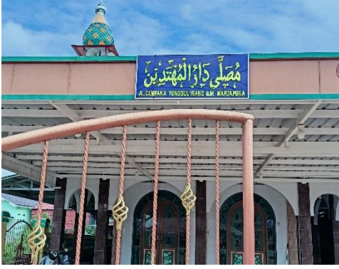
صورة مصلى دار المهتدين