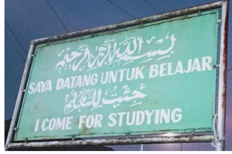
صورة لوحة الإرشادات في المعهد الإسلامي الأمين

ثالثاً، متعددة اللغات من نوع الإرشادات والإعلانات على المشاهد اللغوية باستخدام اللغة العربية توجد بثلاث لغات العربية والإنجليزية والإندونيسية في لوحة واحدة أمام المعهد الإسلامي الأمين للبنات فساينغان مرتافورا، كما في الصورة التالية: