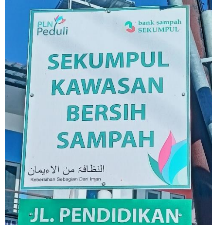
صورة ثنائية اللغة من نوع الإرشادات

وجدت الباحثة لوحة في منطقة سكومفول تشير إلى الجهة المنفذة للمشهد اللغوي بالتعاون مع خدمات كهرباء الدولة وبنك القمامة، وذلك فيما يتعلق بالتوصيات الخاصة بتنظيف المناطق المحيطة في سكومفول من القمامة، كما في الصورة التالية: