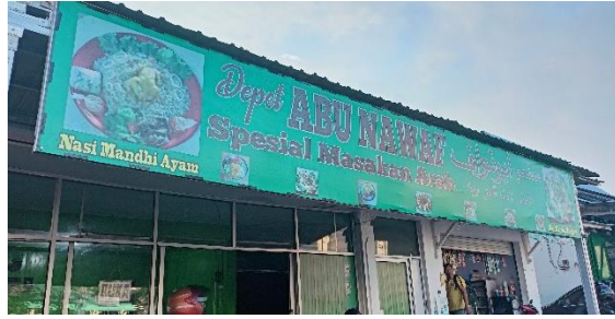
صورة مطعم ابو نواف

لم يكن صاحب المطعم متخصصًا في تقديم نوع معين من الطعام، ولكن مع الوقت، بدأ أصدقاؤه ومعارفه يوصون السياح العرب والهنود بالقدوم إلى مطعمه عند زيارتهم لمرتافورا. ٦٠ ولاحظت الباحثة هنا أن كتابة " للمكولات العربية" في اللوحة ليست الكتابة الصحيحة في اللغة العربية وينبغي الكتابة للمأكولات العربية بالهمزة بعد الميم في كلمة مأكولات وبالتاء المربوطة في كلمة العربية، "وغالبًا ما يرتكب العرب أخطاءً في كتابة اللغة العربية، وذلك بسبب كتابة الكلمات بناءً على النطق الدارج في العامية. هذا يؤدي إلى العديد من الأخطاء في القواعد الصحيحة للكتابة، ومن أبرز هذه الأخطاء ترك النقطة على التاء المربوطة في الكتابة.