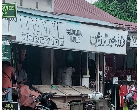
صورة لدكان بالآية القرآنية

من البيانات في الجدول، تبين أن اللوحات المكتوبة باللغة العربية في البقالة تعرض أنواعًا مختلفة من المواد الأساسية والسلع المنزلية الأخرى، مثل الأرز والسكر والبهارات والصابون. وقد تبين أن أصحاب المتاجر هم من أنشأ هذه اللوحات، و لذلك فإن الجهة المنفذة للمشهد اللغوي ليست من الحكومة و إنما هي من الأفراد. لم تذكر الباحثة عمودًا عن الجهة المنفذة، بل استبدلته بعمود فئة المحلات التجارية.