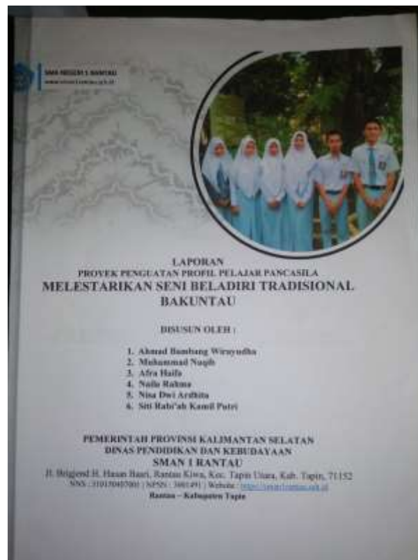
Lampiran 10: Contoh Laporan P5 dari Siswa dan Sekolah