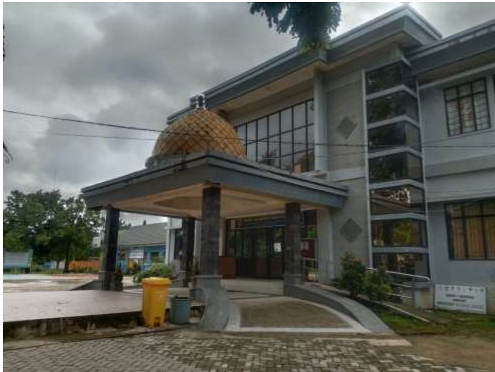
Lampiran 15: Foto Dokumentasi Penelitian