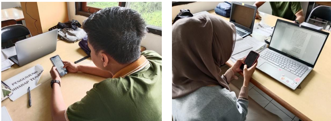
Pengisian kuesioner penelitian