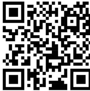
Barcode kuesioner penelitian