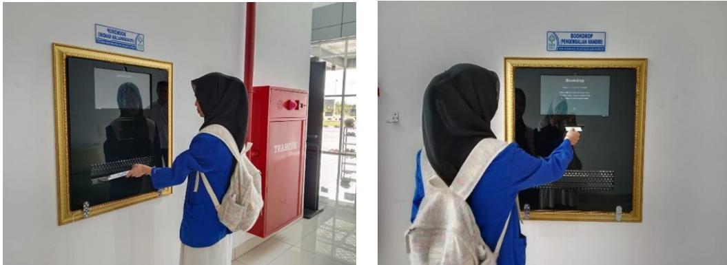
Book drop tempat pengebalian buku