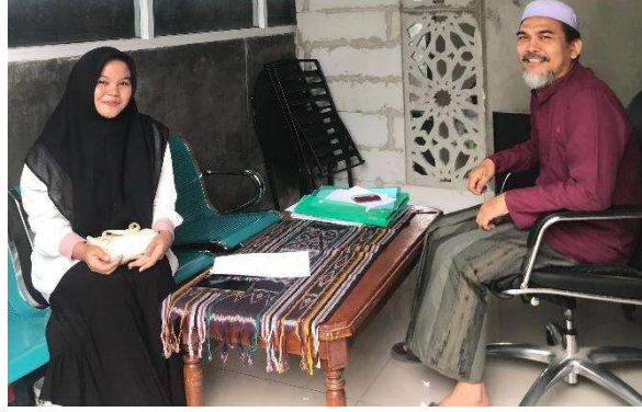
مقابلة مع مدير معهد منبع العلوم للبنات