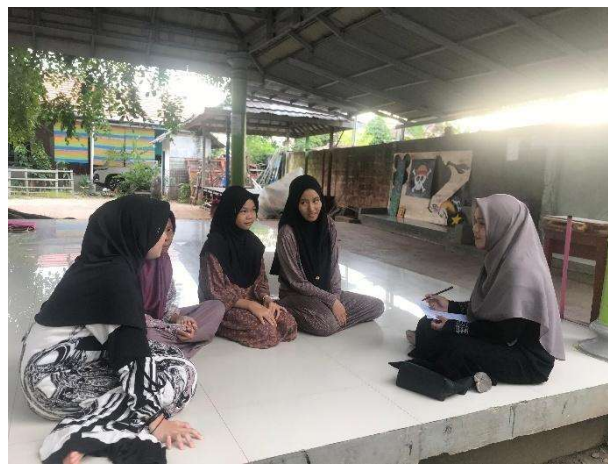
مقابلات مع بعض الطالبات