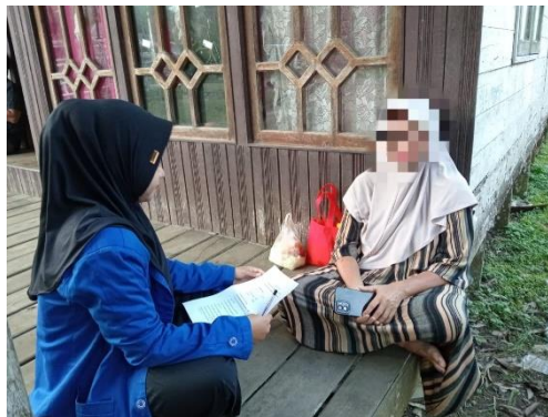
Dok. Informan Kasus III