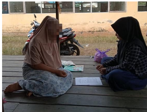
Dok. Informan Kasus II