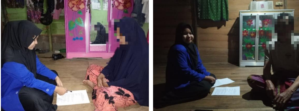
Dok. Informan Kasus I