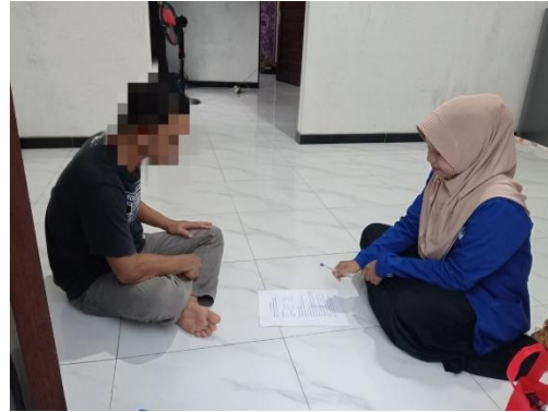
Dok. Informan Kasus IV