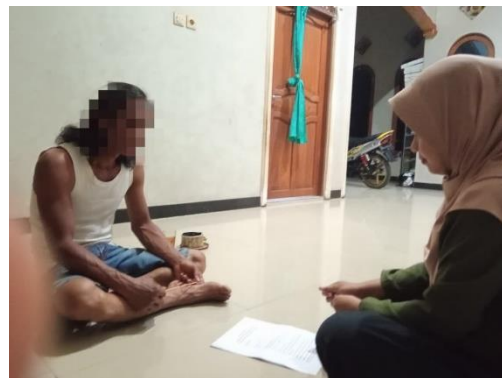
Dok. Informan Kasus V