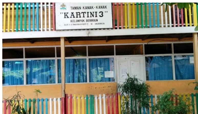
Gambar 4.4 TK Kartini 3 Pelambuan