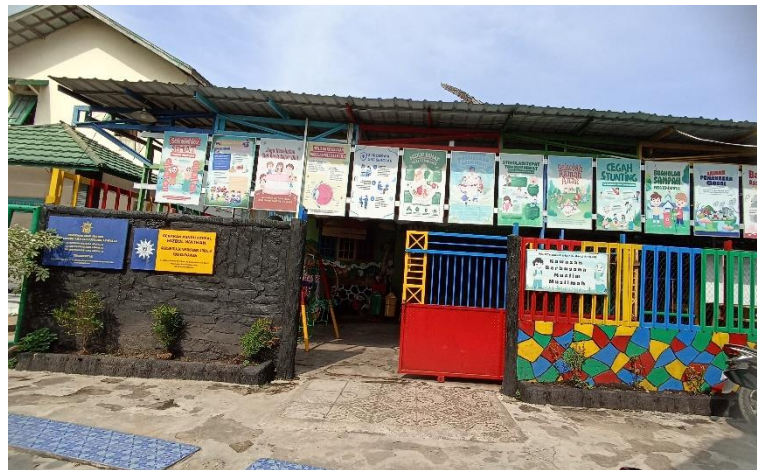
Gambar 4.3 PAUD Terpadu Aisyiyah Bustanul Athfal 43