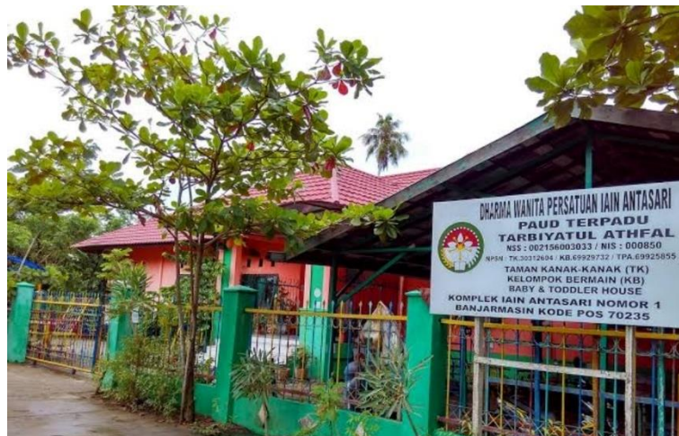
Gambar 4.1 PAUD Terpadu Tarbiyatul Athfal