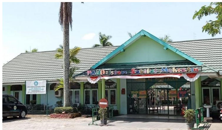
Gambar 4.2 PAUD Terpadu Islam Sabilal Muhtadin