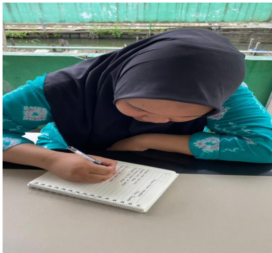
Gambar 1.3 Siswa MAN 2 Kota Banjarmasin di tantang untuk menulis puisi

Selain itu di perpustakaan MAN 2 juga ada program yang berkaitan dengan menulis dan berkaitan dengan karya sastra yaitu perpustakaan MAN 2 mengadakan lomba melatih siswa menjadi komentator dari sebuah film jika dikaitkan dengan karya sastra sebuah film masuk ke bagian jenis karya sastra drama. Dari hasil menonton film para siswa diberikan kesempatan untuk menjadi komentator dari sebuah film yang sudah ditayangkan. Sebagaimana hasil wawancara dengan kepala perpustakaan sebagai berikut: