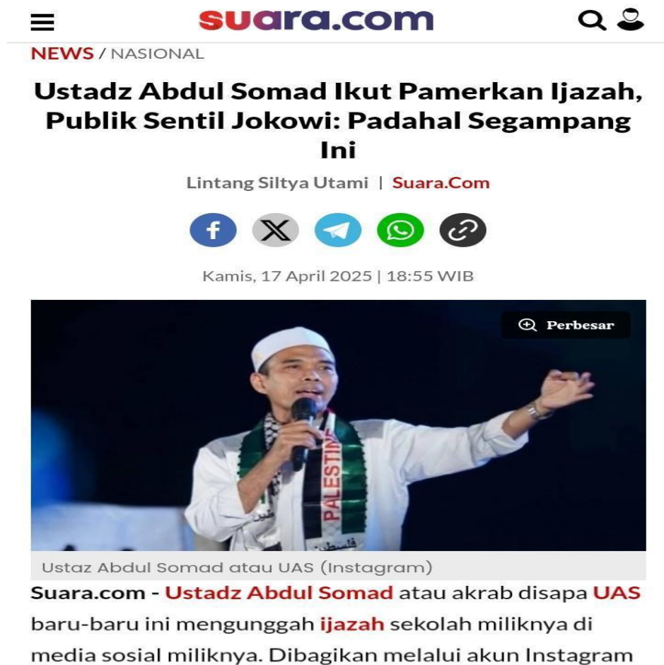
Gambar 4.1 Screenshoot Artikel Berita Suara.com

Suara.com adalah sebuah portal berita online yang beroperasi 24 jam sehari, menyajikan informasi terkini dari spektrum liputan yang sangat luas, mulai dari politik, bisnis, dan hukum sebagai berita keras, hingga sepak bola, entertainment, gaya hidup, otomotif, sains teknologi,