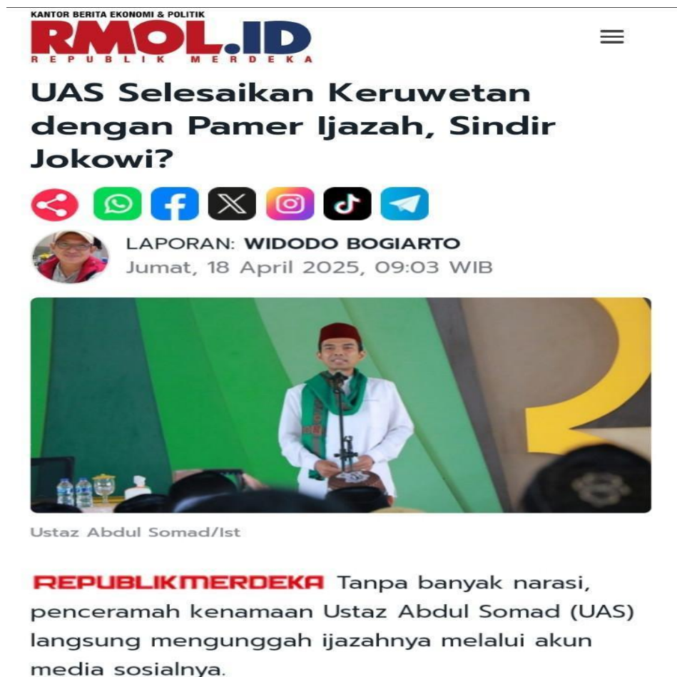
Gambar 4.2 Screenshoot Artikel Berita Rmol.id