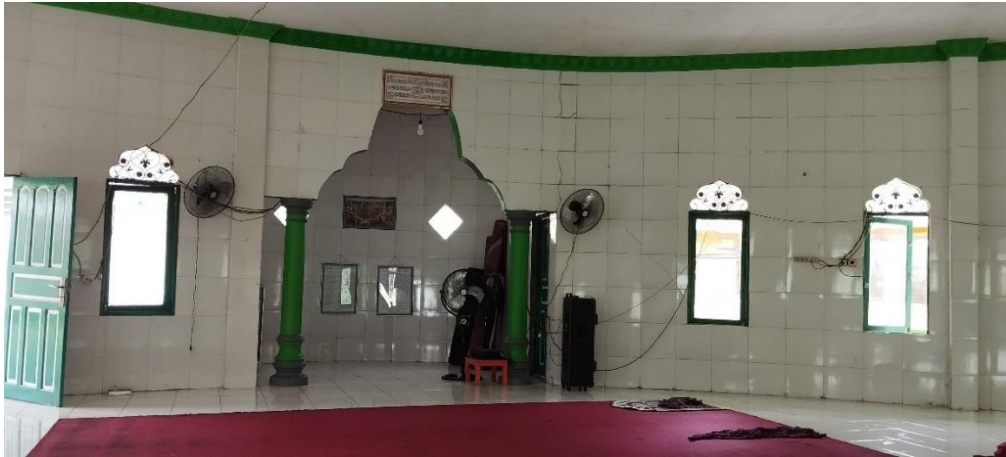
Musholla Panti Asuhan Anak Yatim-Piatu Putri Asri