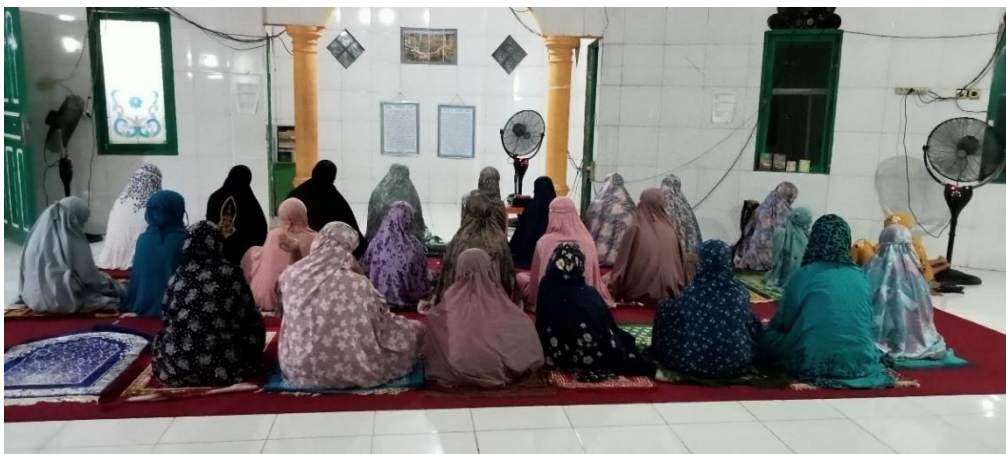
Dokumentasi Saat Sholat Berjamaah di Panti Asuhan Anak Yatim-Piatu Putri Asri