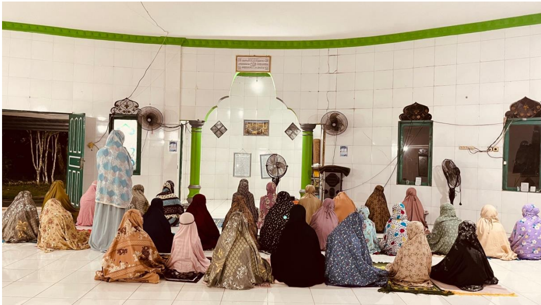
Dokumentasi Saat Pemberian Sanksi