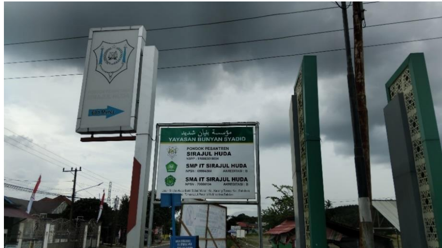
Gambar 4.3 Plang Nama Pondok Pesantren Sirajul Huda Pelaihari Kabupaten Tanah Laut