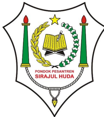
Gambar 4.1 Logo Pondok Pesantren Sirajul Huda Pelaihari Kabupaten Tanah Laut

Seiring berjalannya waktu dan tekad untuk memajukan syiar dan pendidikan agama Islam maka nama yang semula hanya Al-Bunyan kemudian diganti menjadi Bunyan Syadid. Bunyan Syadid adalah panduan antara bahasa Al-Qur'an dan hadis artinya bangunan yang kokoh. Terdapat dalam hadis, almukminu lil mukmini kal bunyani yasyuddu ba'duhu ba'da . Nama Bunyan Syadid ditetapkan pada hari Jum'at, 20 Februari 2009 dengan Akta Pendirian Tanggal 26 Oktober 2009 Nomor 166. Bunyan Syadid mempunyai arti bangunan yang kokoh agar nama tersebut menjadi semangat untuk senantiasa mengembangkan nilai-nilai agama. 72