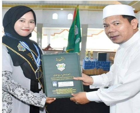
Gambar 4.5 Foto Kelulusan Santri Putri Pondok Pesantren Sirajul Huda Pelaihari Kabupaten Tanah Laut