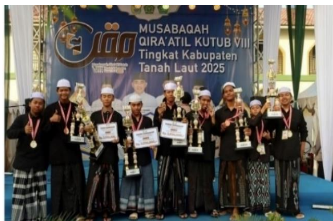
Gambar 4.6 Foto Prestasi Santri Putra dan Putri Pondok Pesantren Sirajul Huda Pelaihari Kabupaten Tanah Laut