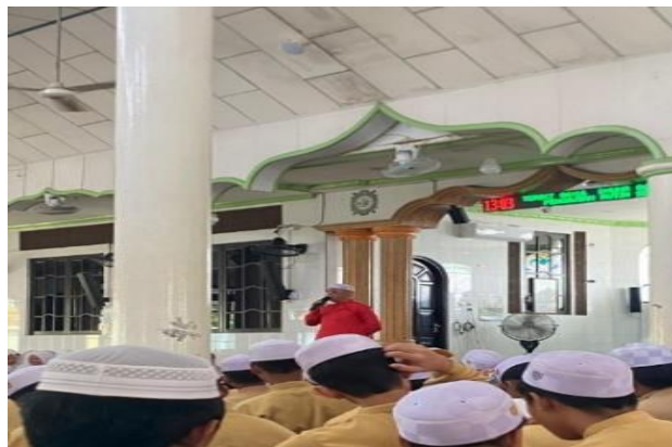
Gambar 4.5 Evaluasi oleh Pembina 31

Berikut Adalah tabel yang memudahkan untuk melihat bagaimana fungsi manajemen yang ditemukan dalam lapangan serta temuan faktor pendukung dan penghambat dalam proses manajemennya :