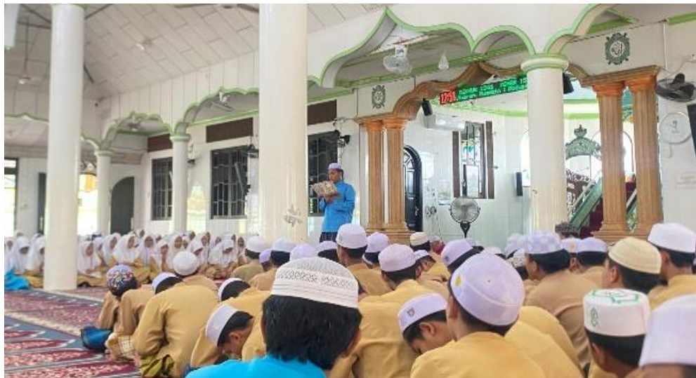
Gambar 4.4 Pelaksanaan Muhadharah 27

kami dalam meningkatkan cara berbicara di depan orang banyak dan membuat kami lebih percaya diri||. 26 Testimoni ini memperlihatkan bahwa kegiatan muhadharah telah memberikan kesempatan bagi santri untuk berlatih secara langsung dan bertahap, sehingga kemampuan berbicara mereka berkembang seiring waktu. Secara keseluruhan, pelaksanaan muhadharah tidak hanya menjadi kegiatan rutin, tetapi juga menjadi media pembinaan yang berjalan secara berkelanjutan. Proses yang berlangsung secara terstruktur, disertai evaluasi dan pembiasaan, memberikan pengalaman praktis kepada santri dalam dunia dakwah, yang menjadi tujuan utama dari program ini.